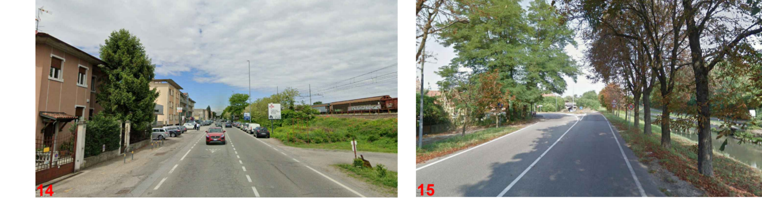
A sinistra fuga prospettica dall'uscita della Statale Giovi, importante via d'ingresso alla città, a destra viale della Repubblica costeggiata dal Naviglio Pavese limes naturale della città storica.

Visuali dai viali di ingresso alla città di Pavia