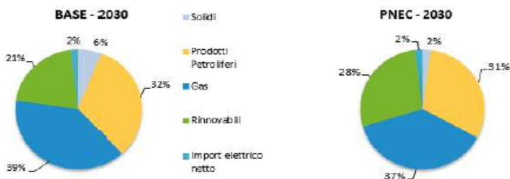
Figura 162- Mix del fabbisogno primario al 2030

Le fonti rinnovabili sostituiscono progressivamente il consumo di combustibili fossili passando dal 16.7% del fabbisogno primario al 2016 a circa il 28% nello scenario PNEC. I prodotti petroliferi dopo il 2030 continuano a essere utilizzati nei trasporti passeggeri e merci su lunghe distanze, ma il loro utilizzo è significativamente inferiore al 2040 (25% del mix primario). Il loro declino è maggiormente significativo negli ultimi anni della proiezione dello scenario quando il petrolio nel trasporto è sostituito cospicuamente da biocarburanti e veicoli ad alimentazione elettrica. Nella