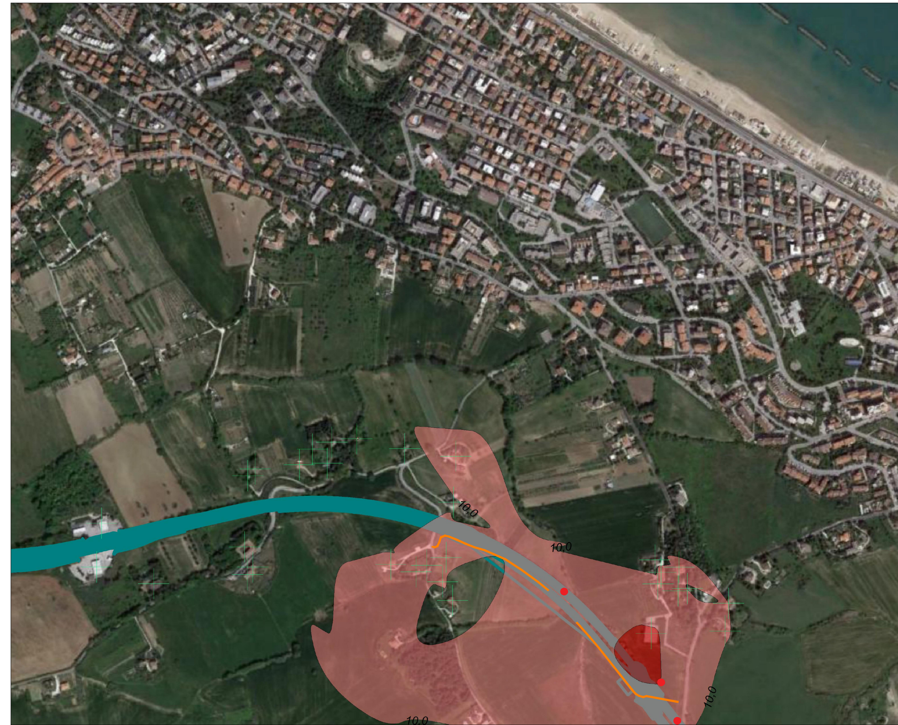
Planimetria INTERVENTO "2" - Viadotto Falconara II Asse nord