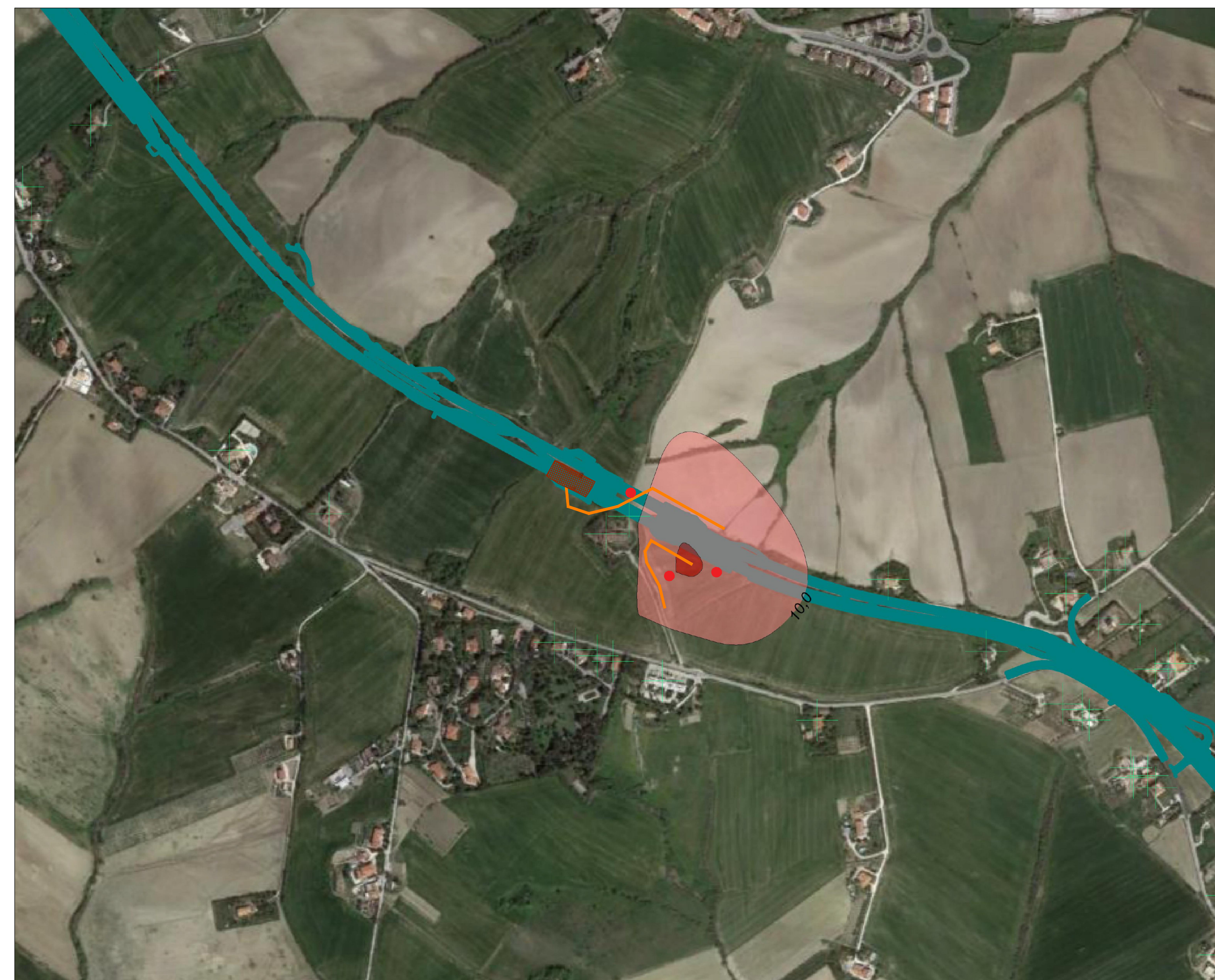
Planimetria INTERVENTO "3B" - Galleria Orciani Asse nord