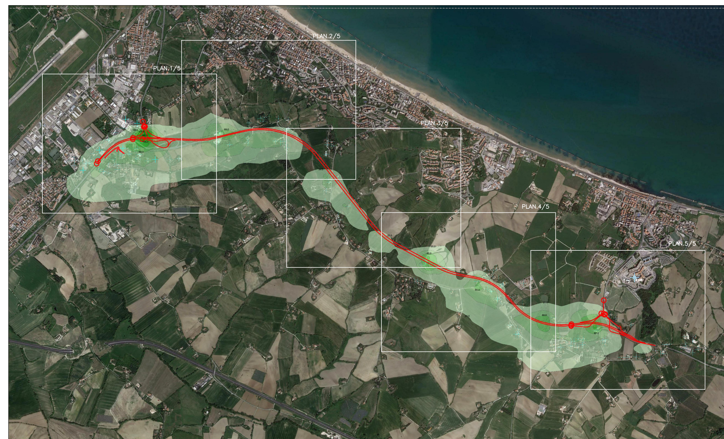
TAV.8: Quadro d'unione