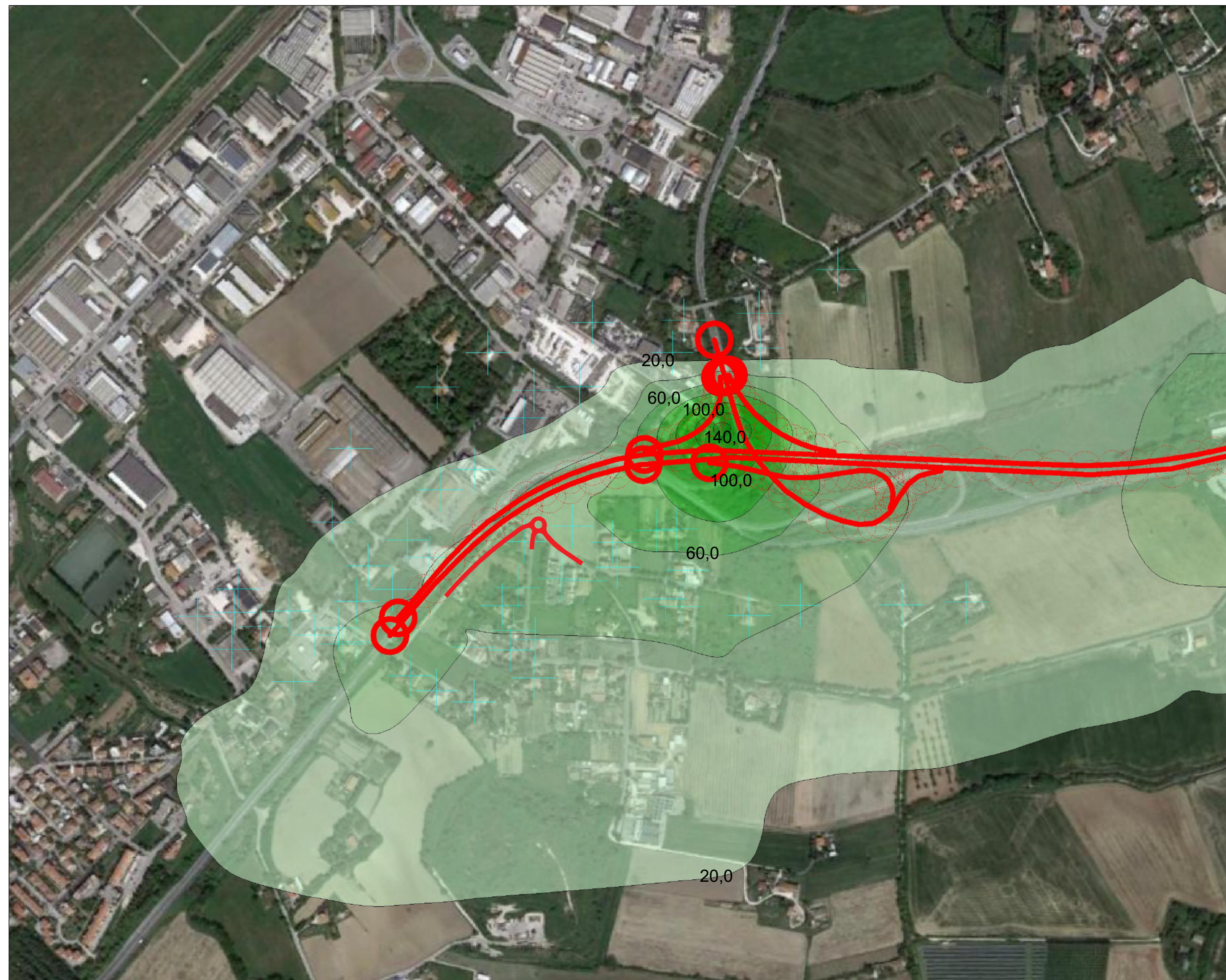
TAV.8: Planimetria 1/5 SCALA: 1:5.000