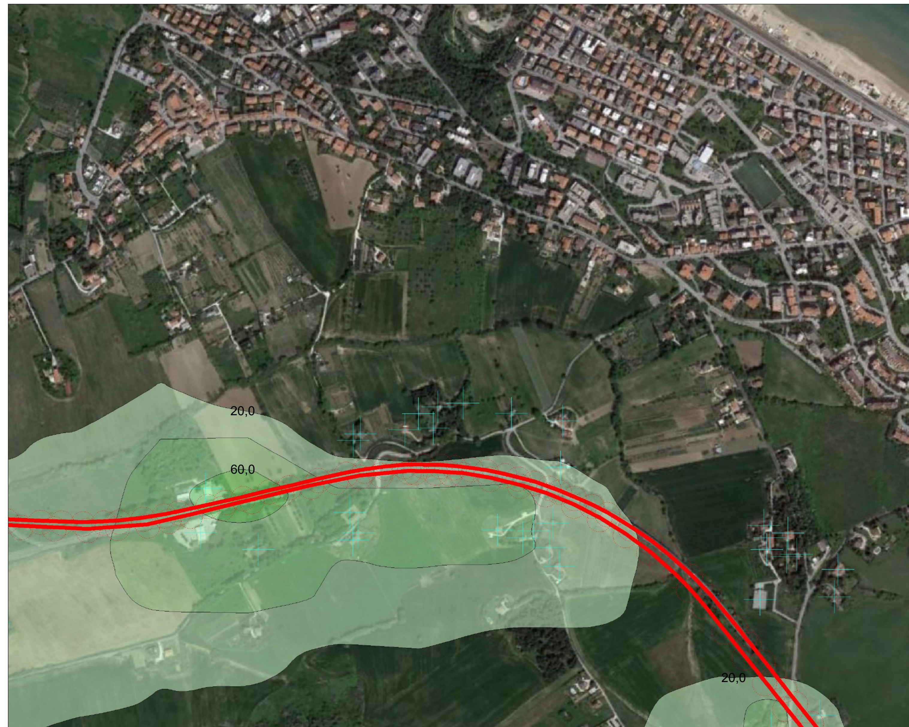
TAV.8: Planimetria 2/5 SCALA: 1:5.000