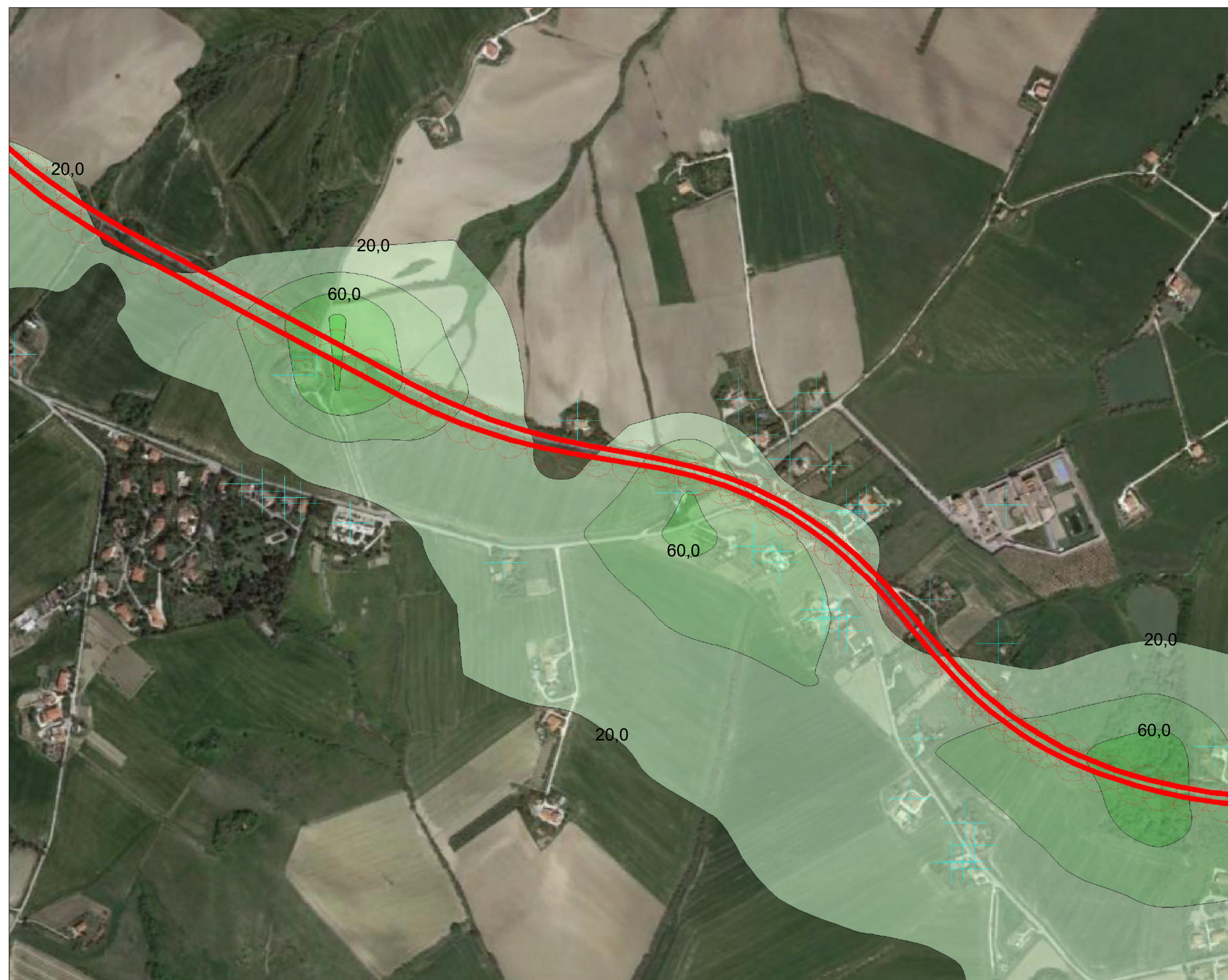
TAV.8: Planimetria 4/5 SCALA: 1:5.000