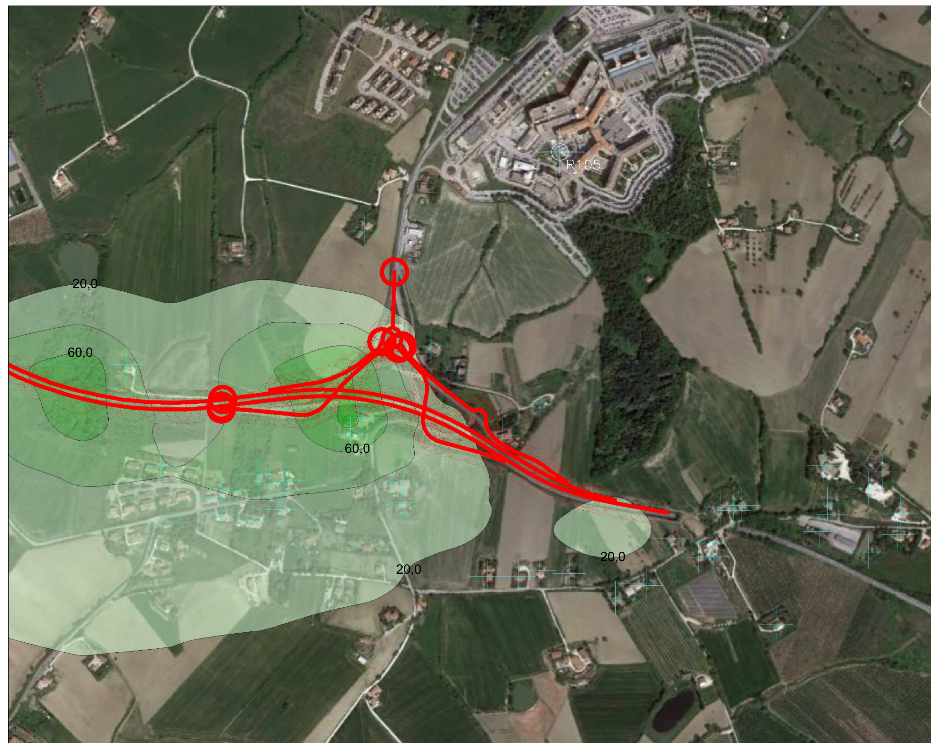
TAV.8: Planimetria 5/5 SCALA: 1:5.000