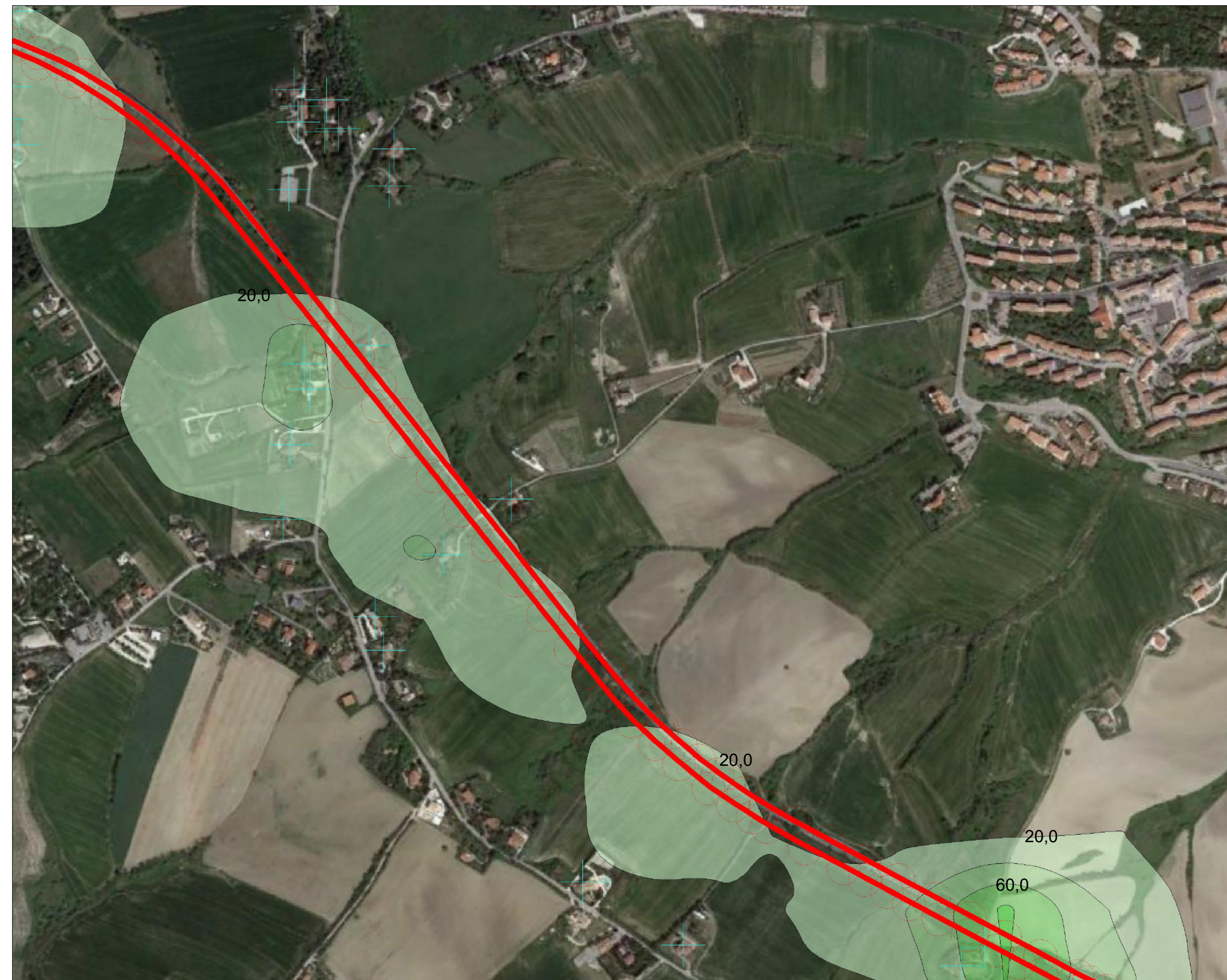
TAV.8: Planimetria 3/5 SCALA: 1:5.000