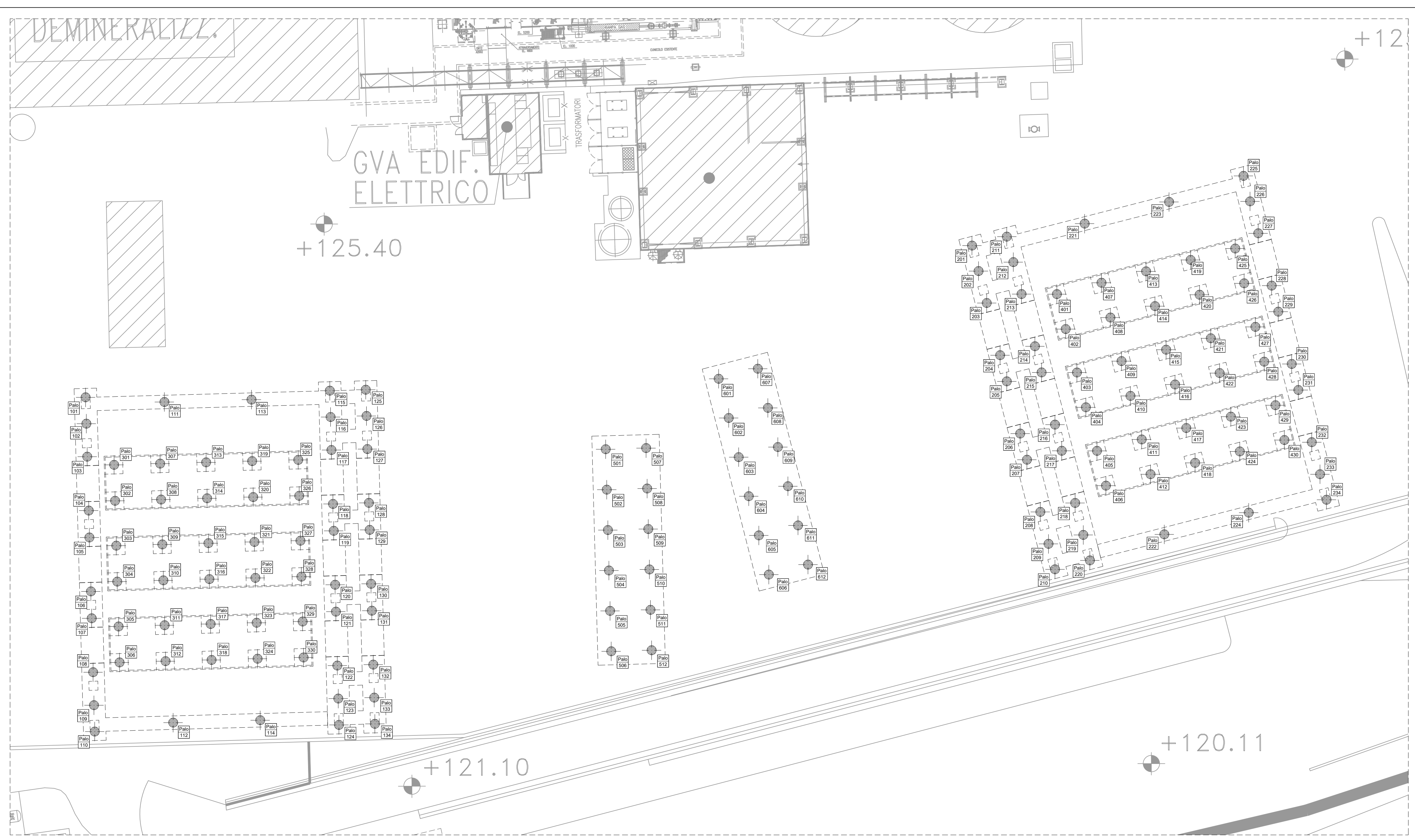
PLANIMETRIA DI TRACCIAMENTO PALI DI FONDAZIONE Scala: 1:200