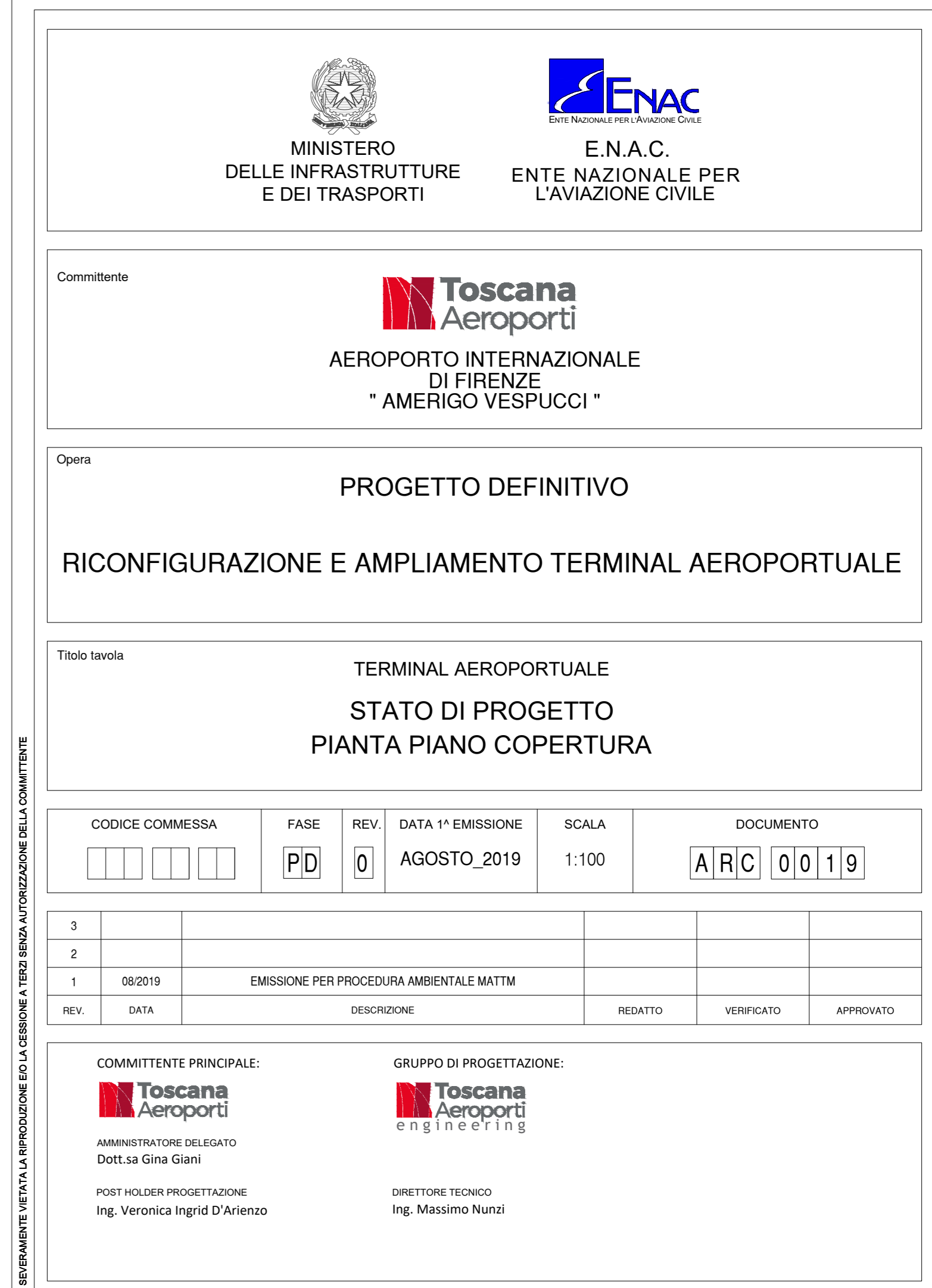
PIANTA DELLE COPERTURE 1:100