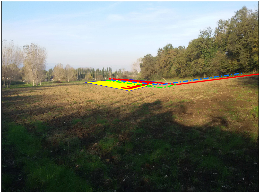
IMPIANTO HPRS 10 E VARIANTE

Il presente disegno e' di proprieta' aziendale - La Societa' tutelera' i propri diritti a termine di legge.