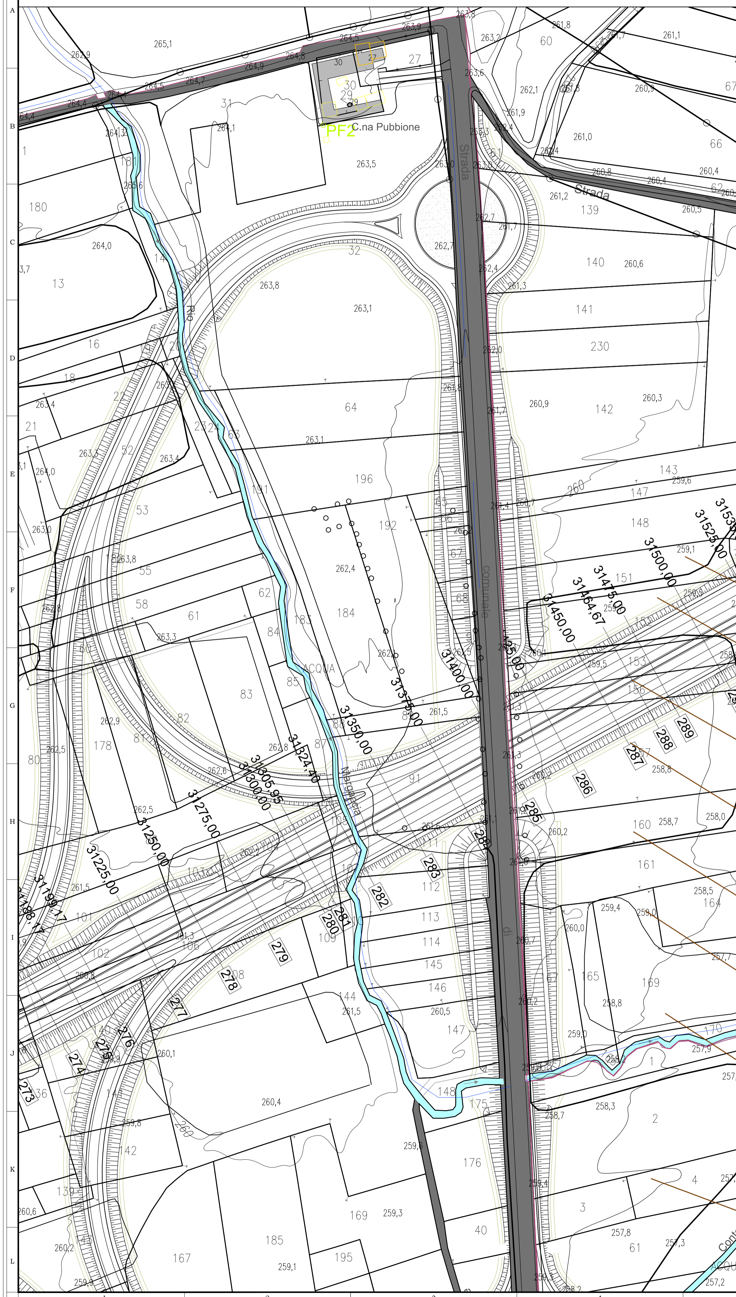
ATTRAVERSAMENTO RIO MARGACCIA - PLANIMETRIA 1 : 1000