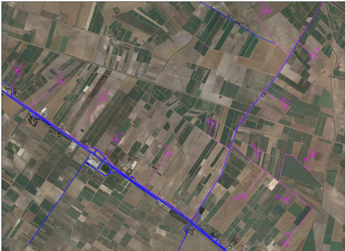
Figura 4 - Layout Impianto

Una volta definito il layout, la fattibilità economica dell'iniziativa è stata valutata utilizzando i dati anemometrici raccolti nel corso della campagna di misura e tradotti in ore equivalenti/anno per gli aerogeneratori in previsione di installazione.