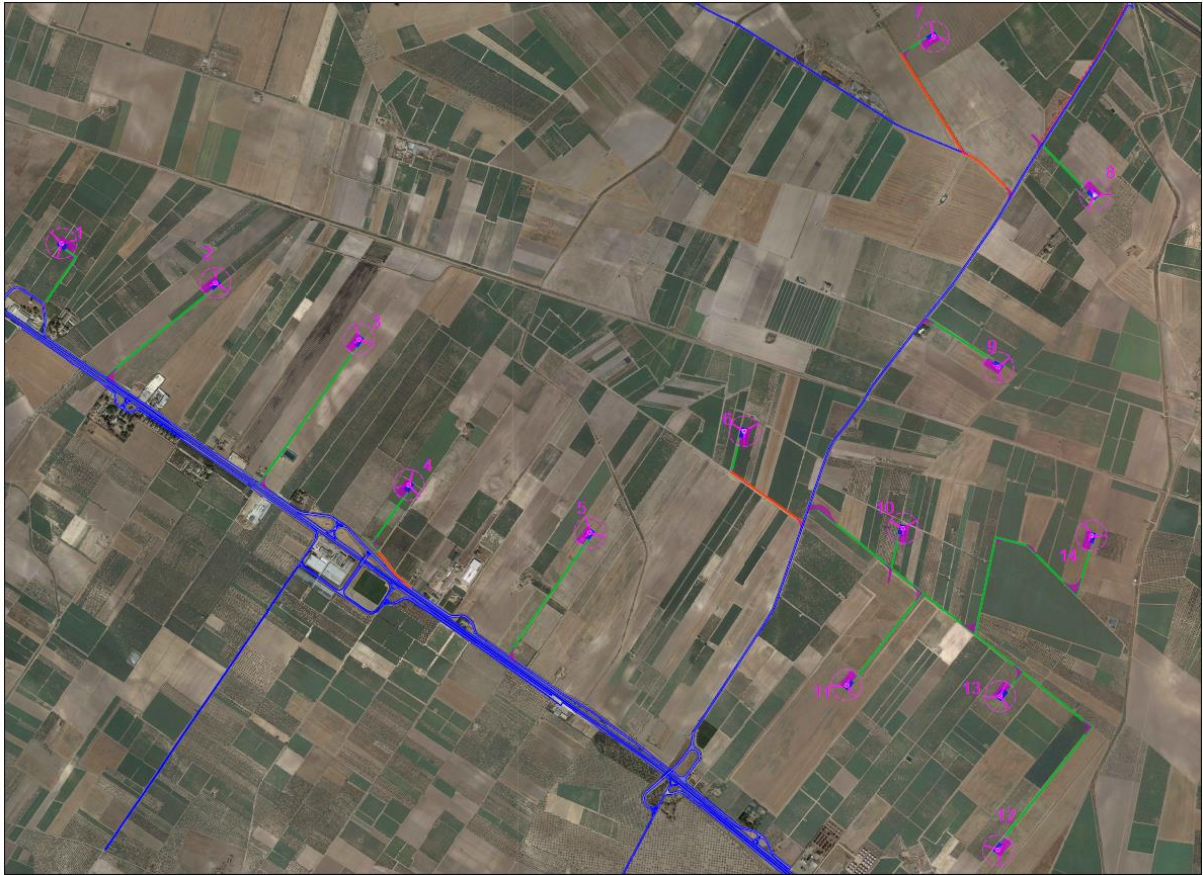
Figura 5- Viabilità accesso al parco

I tratti contraddistinti in blu rappresentano la viabilità esistente, quelli in arancione la viabilità da adeguare e quelli in giallo da realizzare ex novo.