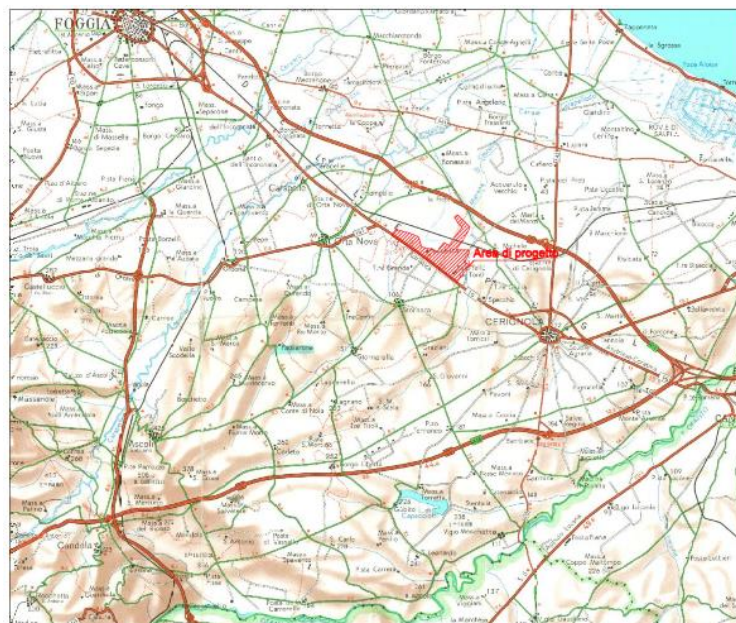
Figura 3- Inquadramento geografico

In particolare, il parco eolico interessa una superficie di circa 800 ricadono in località "Salice-La Paduletta" e sono censiti nel NCT del Comune di Cerignola ai fogli di mappa nn. 99 – 101, e del Comune di Orta Nova ai fogli di mappa nn. 32-34-35-37. L'elettrodotto interrato esterno al parco ricade in parte nel Comune di Ortanova al foglio di mappa n. 34 e in parte, compresa la sottostazione MT/AT, ricade nel Comune di Cerignola ai fogli di mappa nn. 85-87-88-89-90-93.