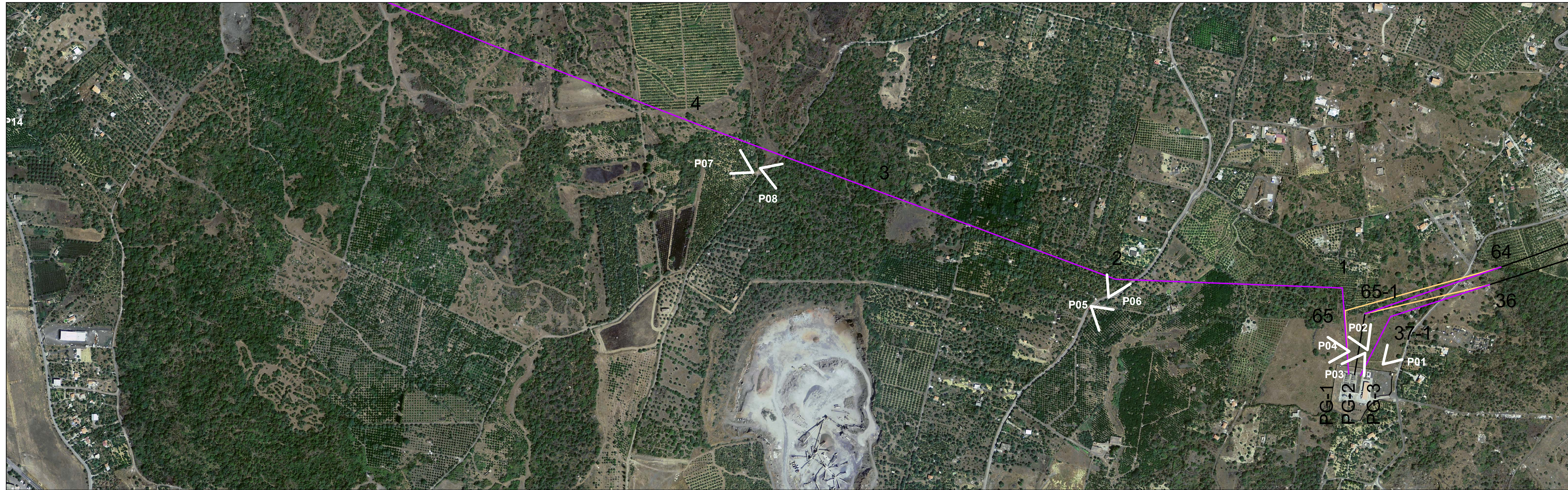
Foto 01 - Visuale verso le linee " Misterbianco - Belpasso" e " Belpasso - Viagrande"