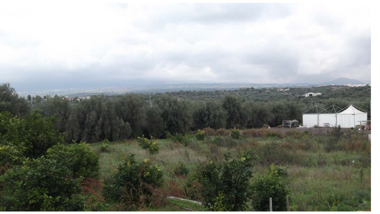
Foto 15 - Visuale da S.C. Palazzolo verso sostegno 13