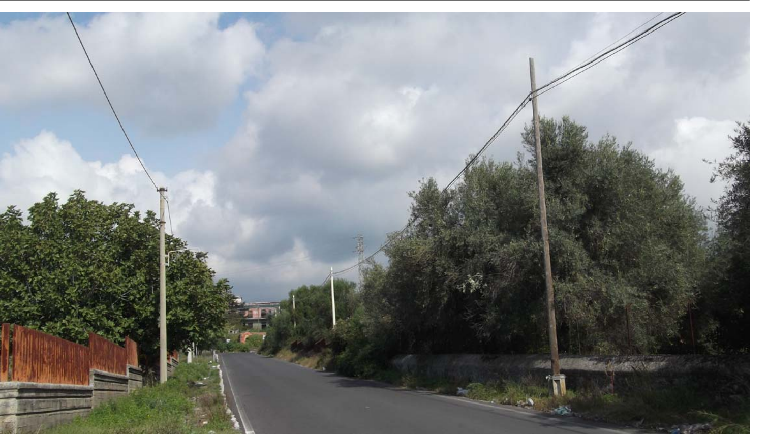
Foto 11 - Visuale da S.P. 56ii verso sostegno 9