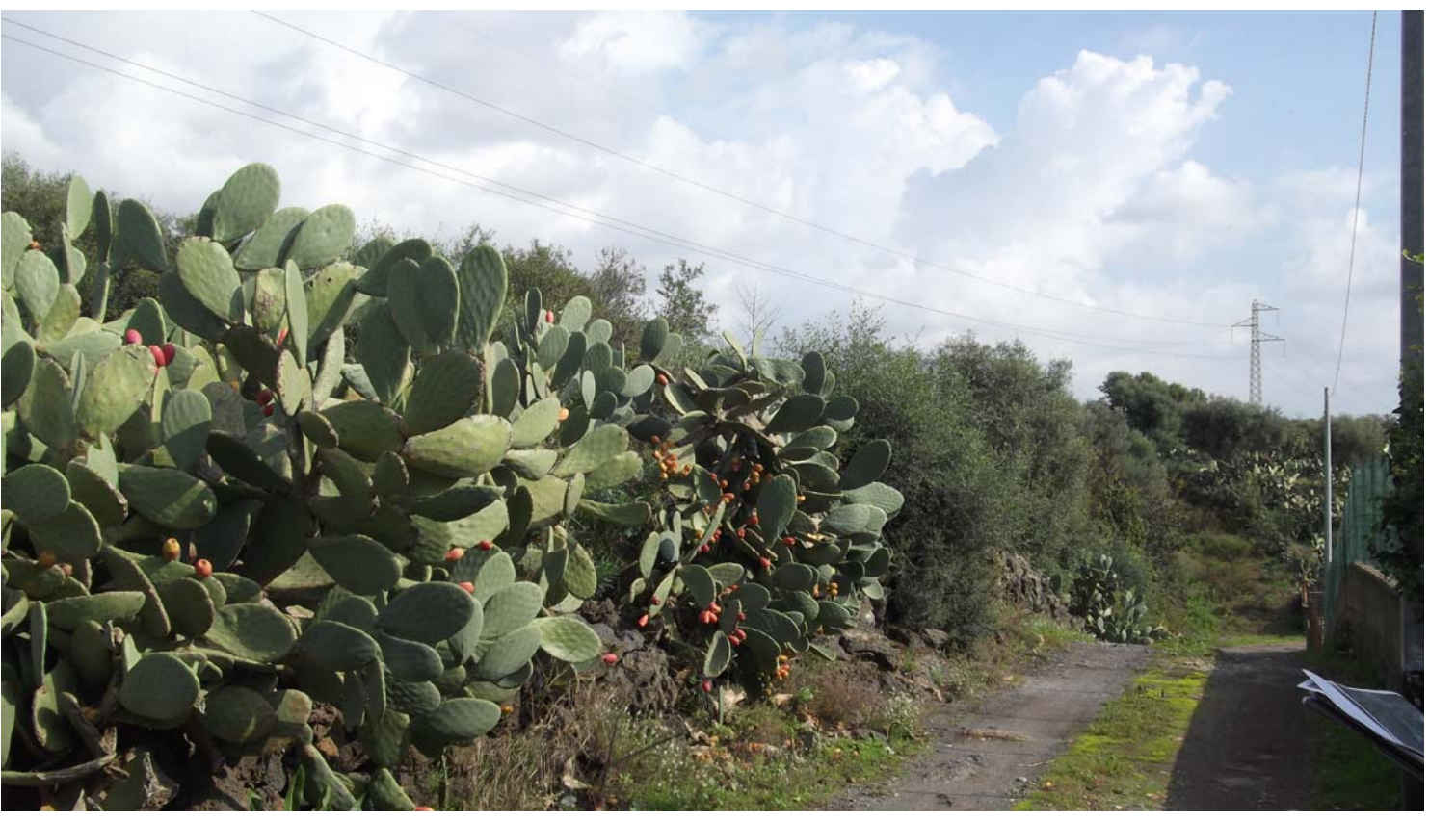
Foto 16 - Visuale da S.C. Palazzolo verso linee esistenti