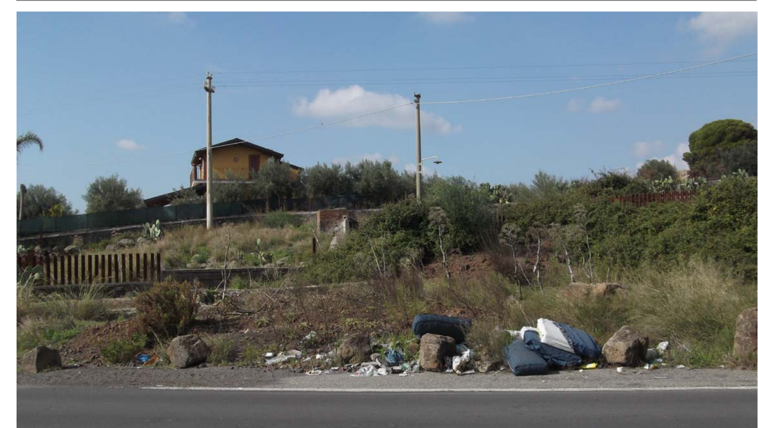
Foto 10 - Visuale da S.P.184 verso sostegno 9