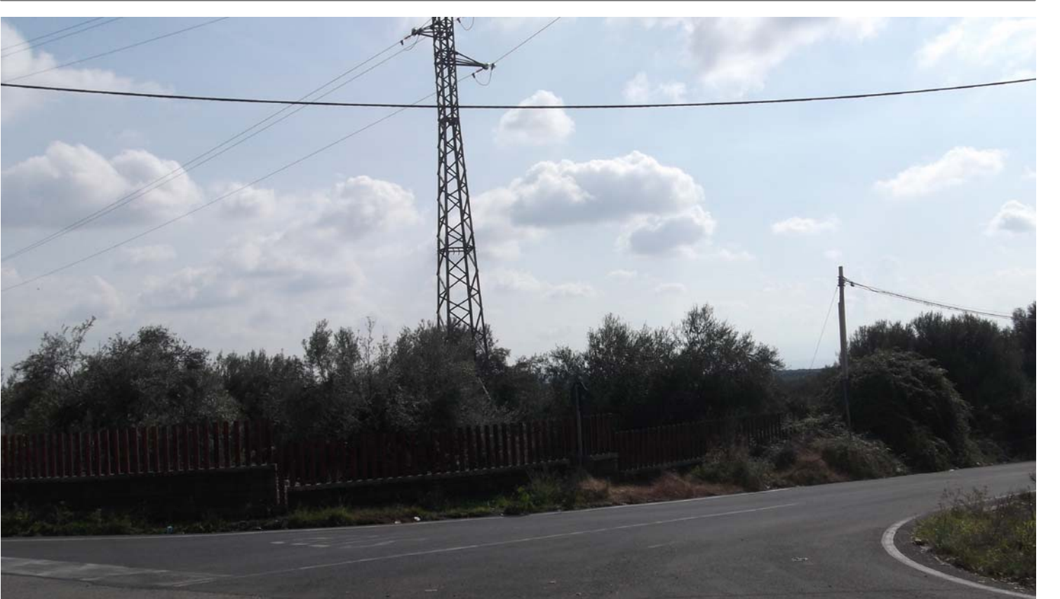
Foto 12 - Visuale da Via palazzolo verso sostegno 10