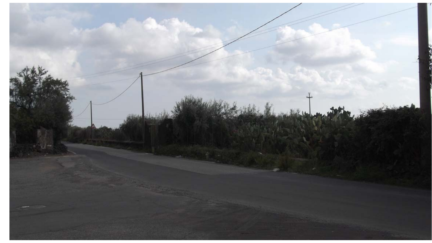
Foto 14 - Visuale da S.P.184 verso i sostegni 7, 8 e 9