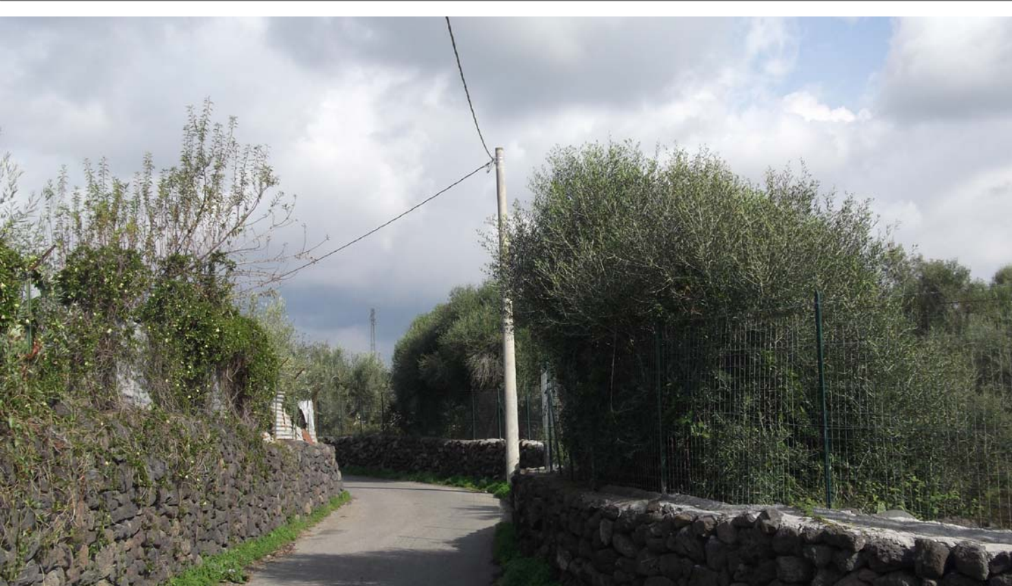
Foto 13 - Visuale da S.P. 56ii verso sostegno 10