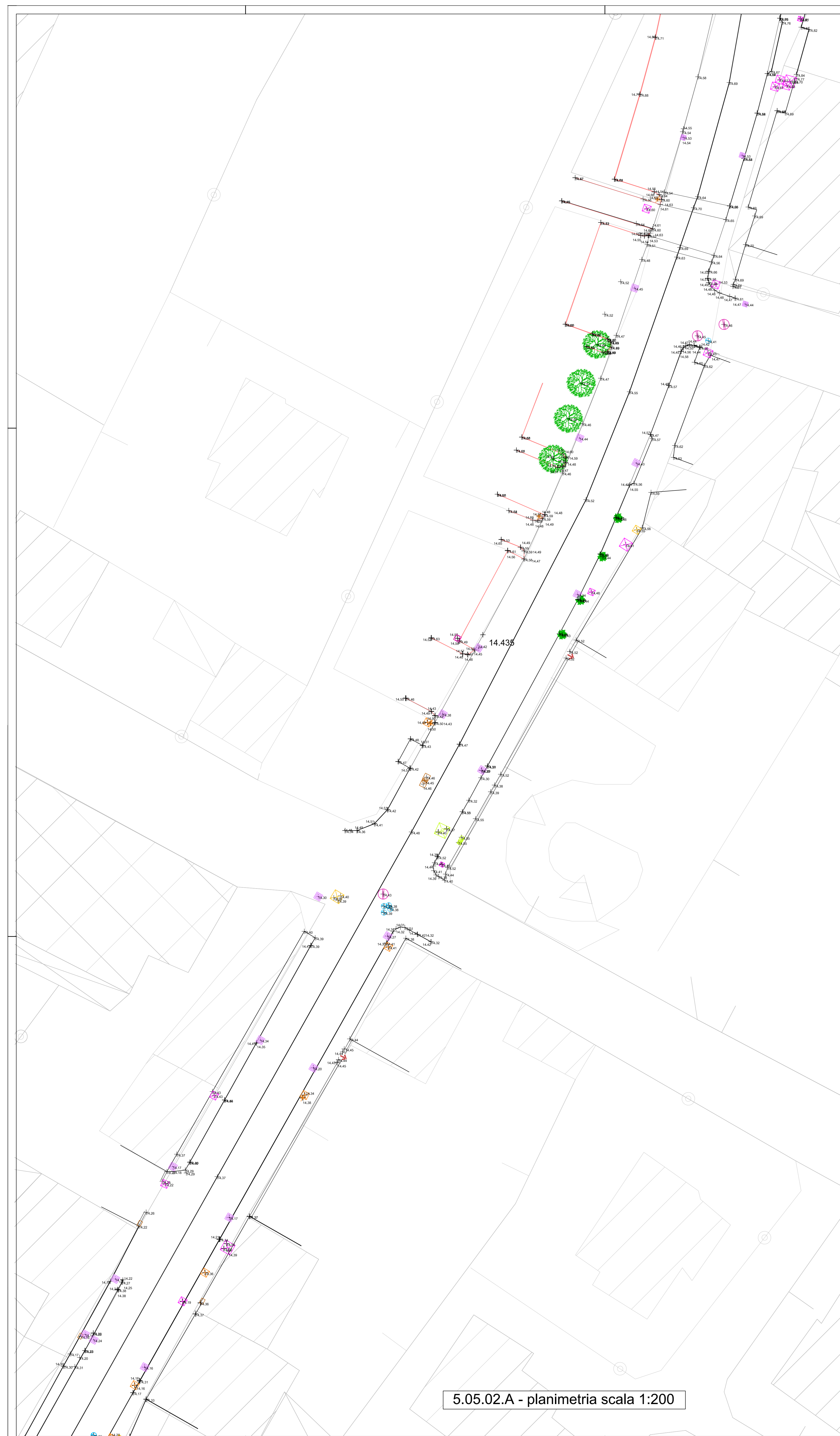
5.05.02.A - planimetria scala 1:200