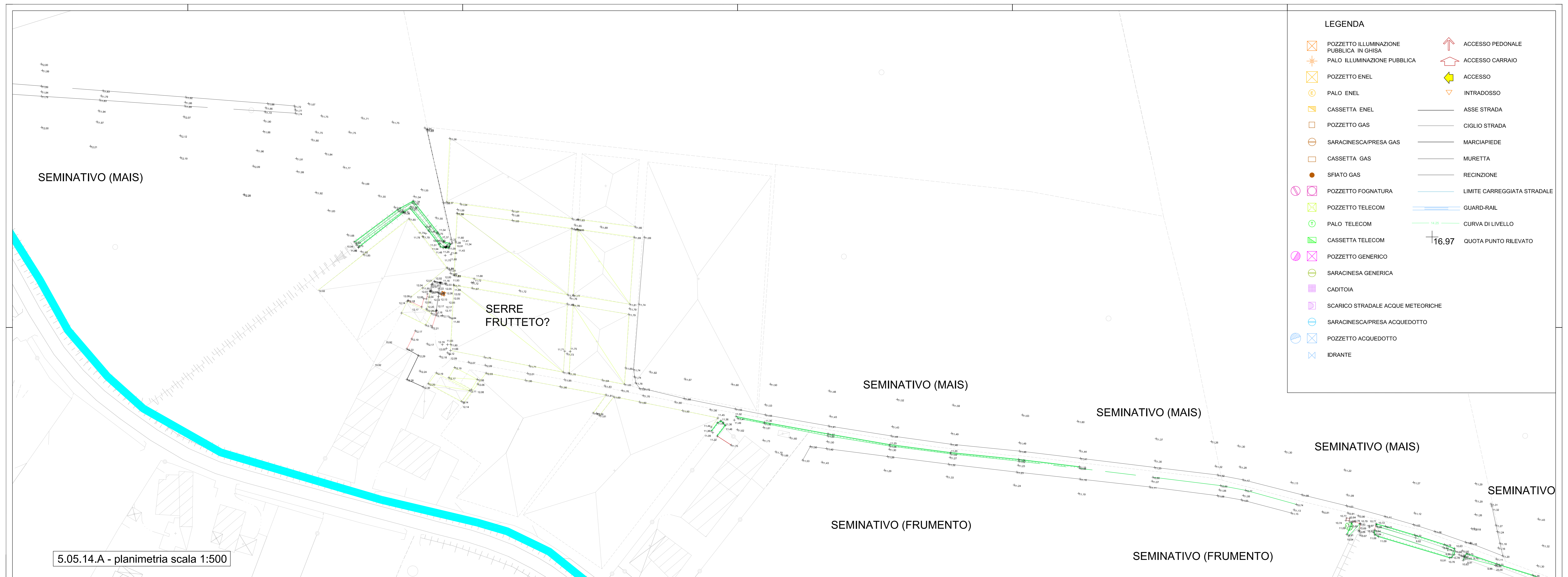
5.05.14.A - planimetria scala 1:500