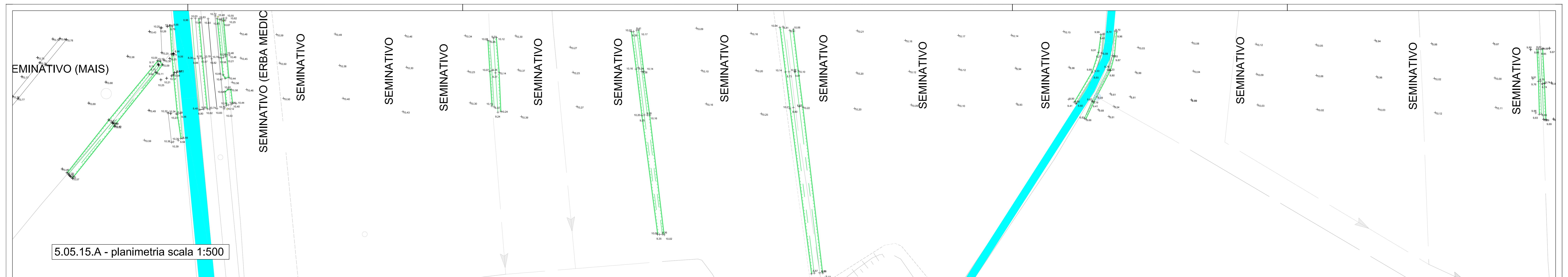
5.05.15.A - planimetria scala 1:500