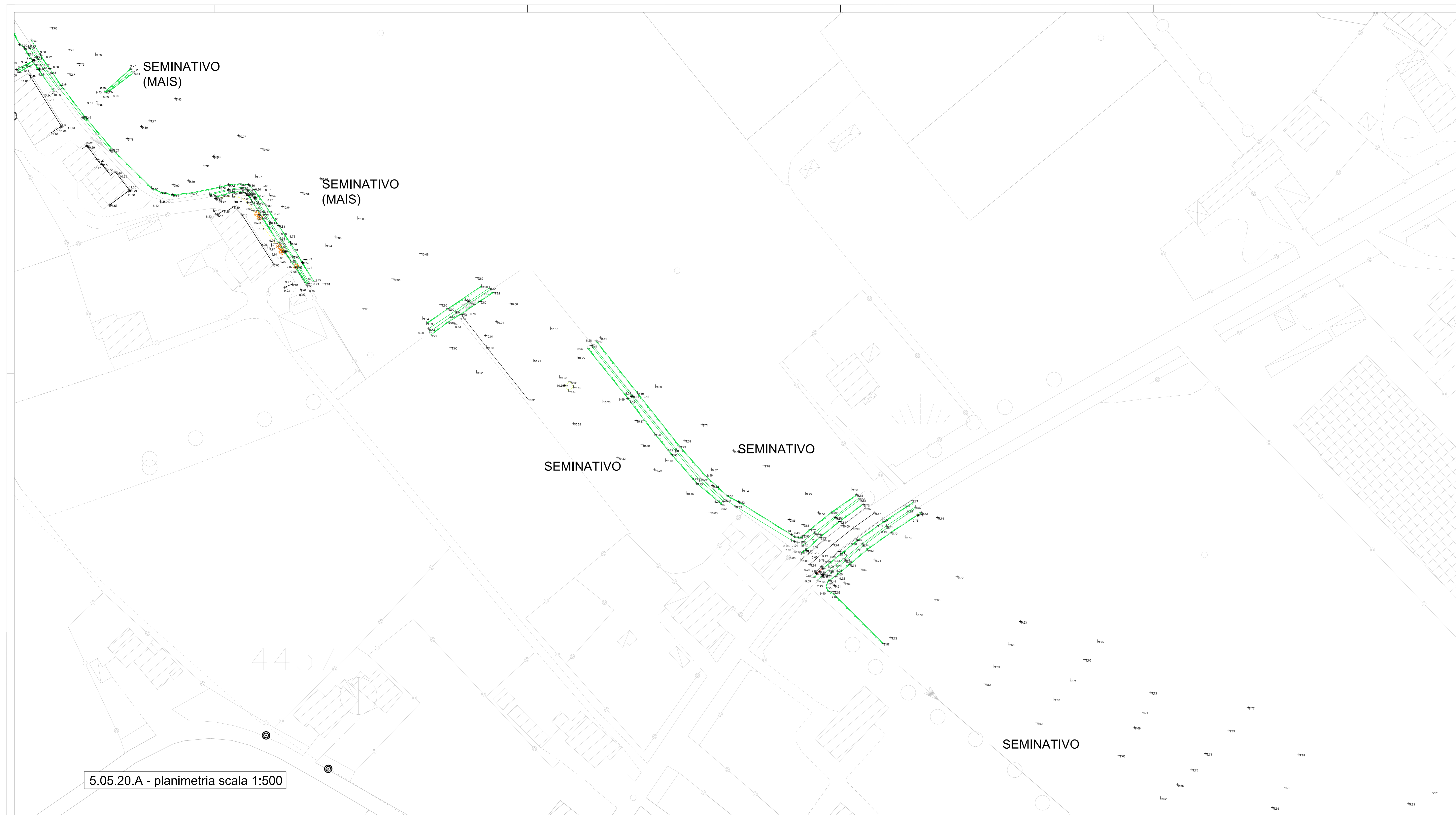
5.05.20.A - planimetria scala 1:500