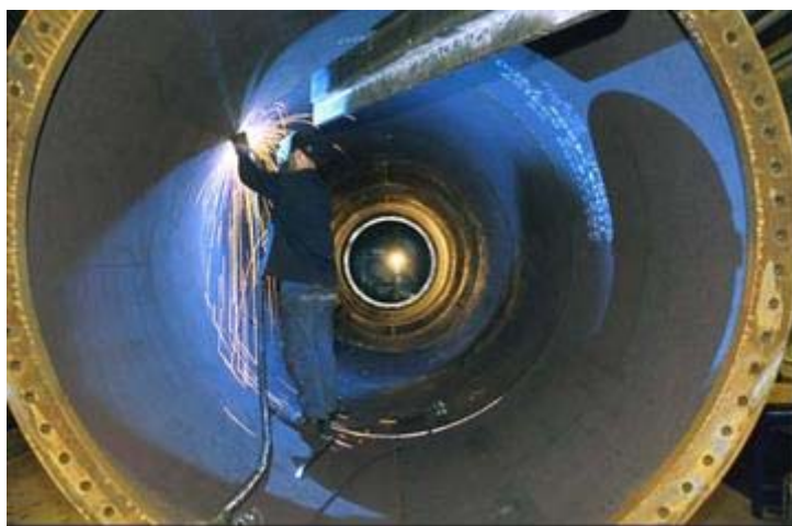
Figura 10: interno di una torre

All'interno delle torri si installano vari componenti come scale, cavi elettrici di connessione dell'aerogeneratore, porta della torre e casse di connessione. Tali torri sono fabbricate con piastre di acciaio di spessore tra i 16 e i 36 mm, che alla fine sono ricoperte al loro esterno e al loro interno da strati di pittura per proteggerli dalla corrosione. All'interno delle torri si installano una serie di piattaforme, scale e linee di vita per l'accesso degli operai all'interno della navicella. Tali componenti sono fabbricati in acciaio o ferro galvanizzato visto che all'interno sono protetti dalla corrosione.