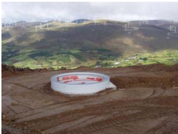
Figura 12: fondazione