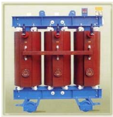
Figura 8: trasformatore

I materiali costituenti l'armatura e la carcassa esteriore verranno rottamati, così come il rame generato che si recupererà per la sua rifusione.