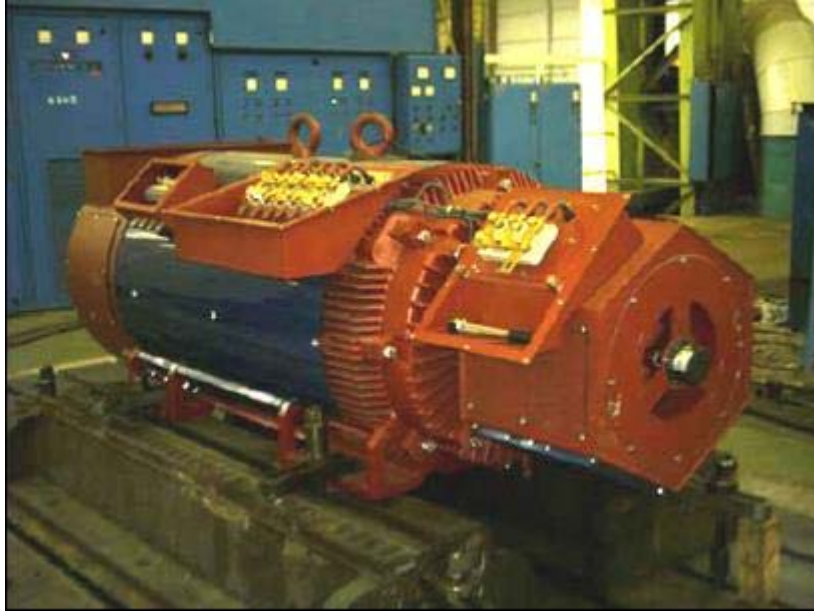
Figura 5: generatore

Tanto l'acciaio quanto il rame sono destinati al riciclaggio come rottame. Bisogna prestare particolare attenzione al recupero del rame, a causa del suo elevato costo sul mercato.