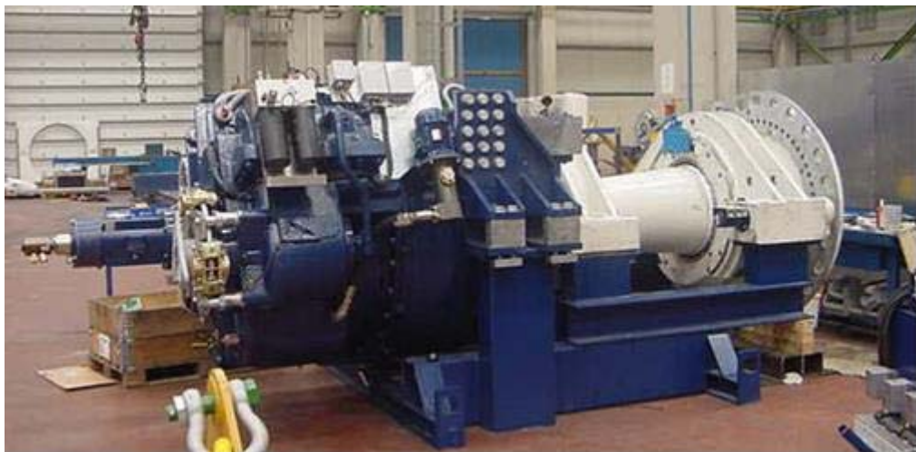
Figura 4: asse di alta velocità

Nel caso in cui qualche pezzo di questi componenti si trovi in buono stato si può pensare al loro riutilizzo in componenti simili.