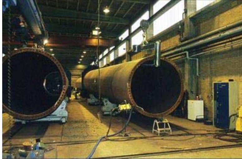
Figura 11: torri

L'opzione più attuabile relativamente alla gestione finale dei trami che costituiscono le torri è il riciclaggio come rottame.