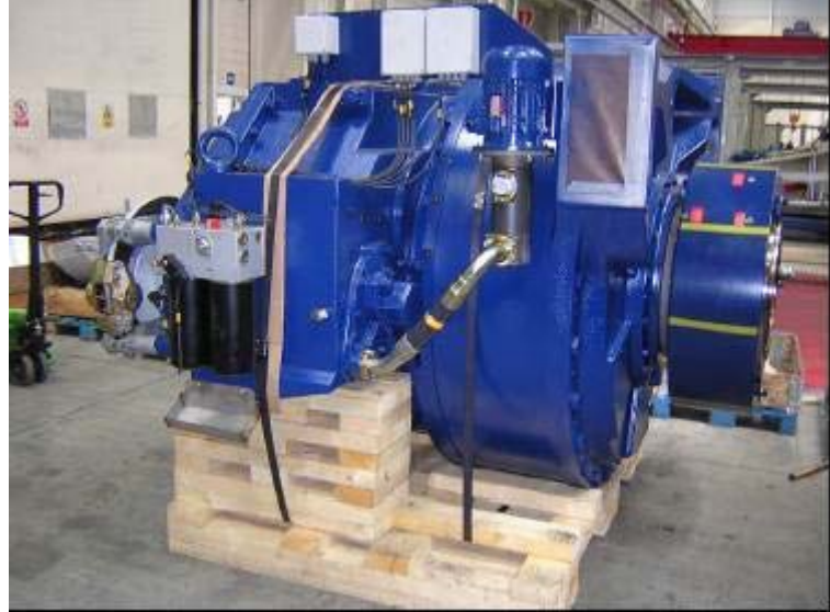
Figura 3: moltiplicatore