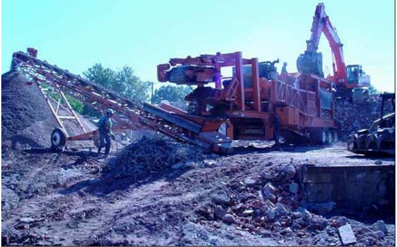
Figura 14: demolizione