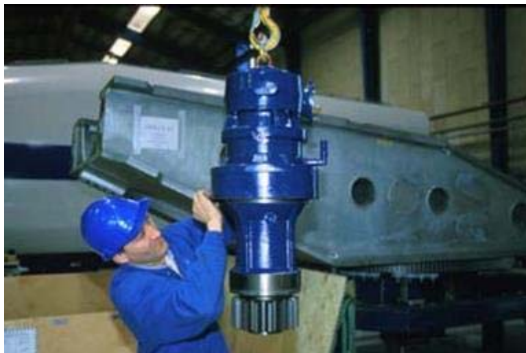
Figura 6: motori di giro e riduttori