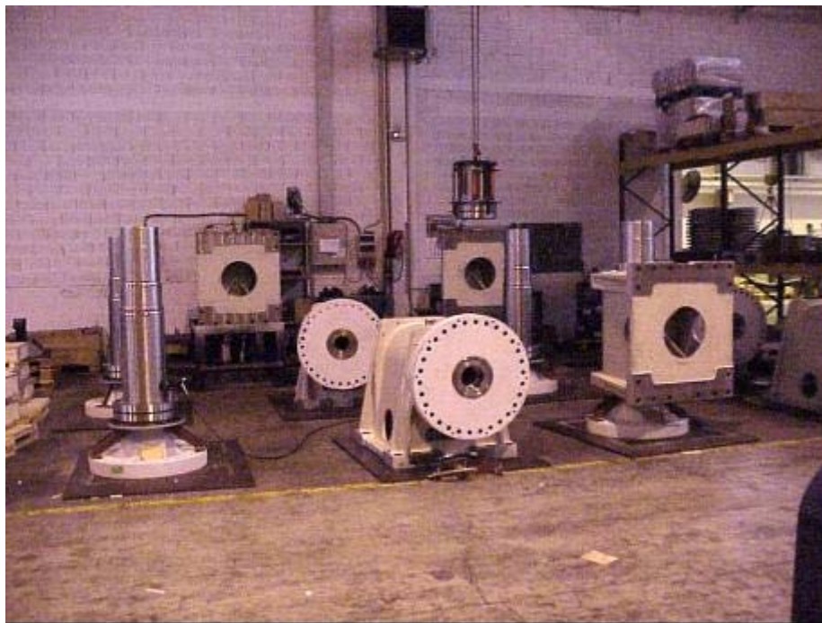
Figura 2: asse di bassa velocità