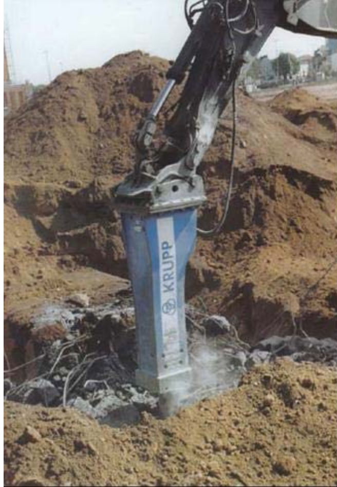
Figura 13: trivellazione

Il passo seguente sarà il taglio, mediante cesoie idrauliche, dei cavi di ferro forgiato, in modo tale che si possano separare ed essere facilmente maneggiabili. Una volta realizzato questo processo ci sono due opzioni per il ritiro e la gestione dei residui provenienti dalla demolizione.