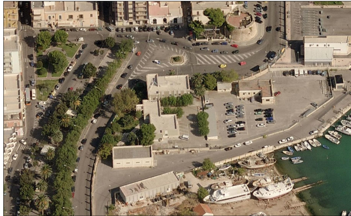
Vista 1 Ante opera