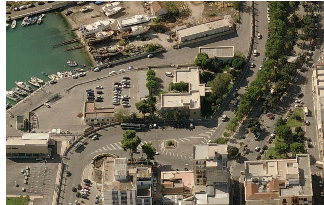
Vista 2 Ante opera