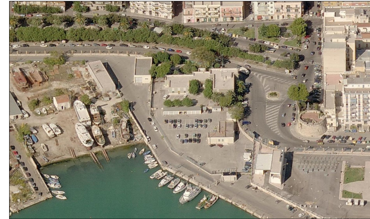
Vista 3 Ante opera