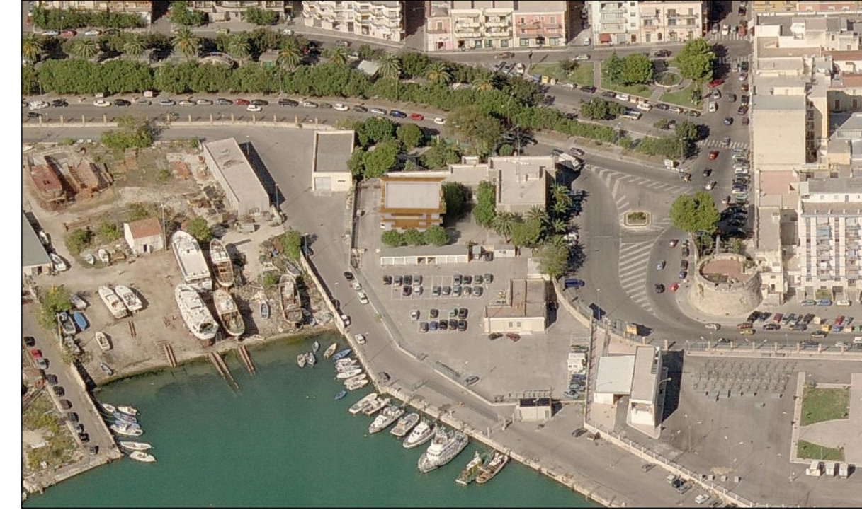
Vista 3 Post opera