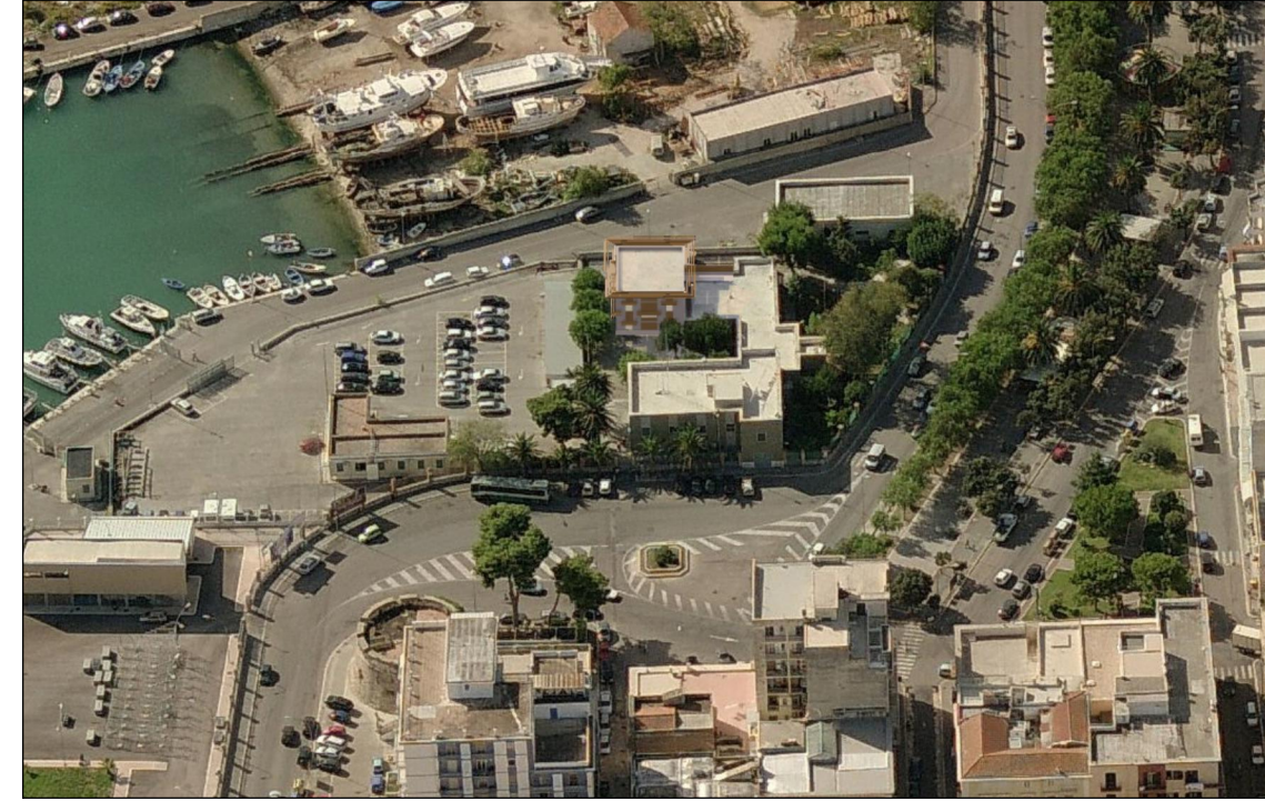
Vista 2 Post opera