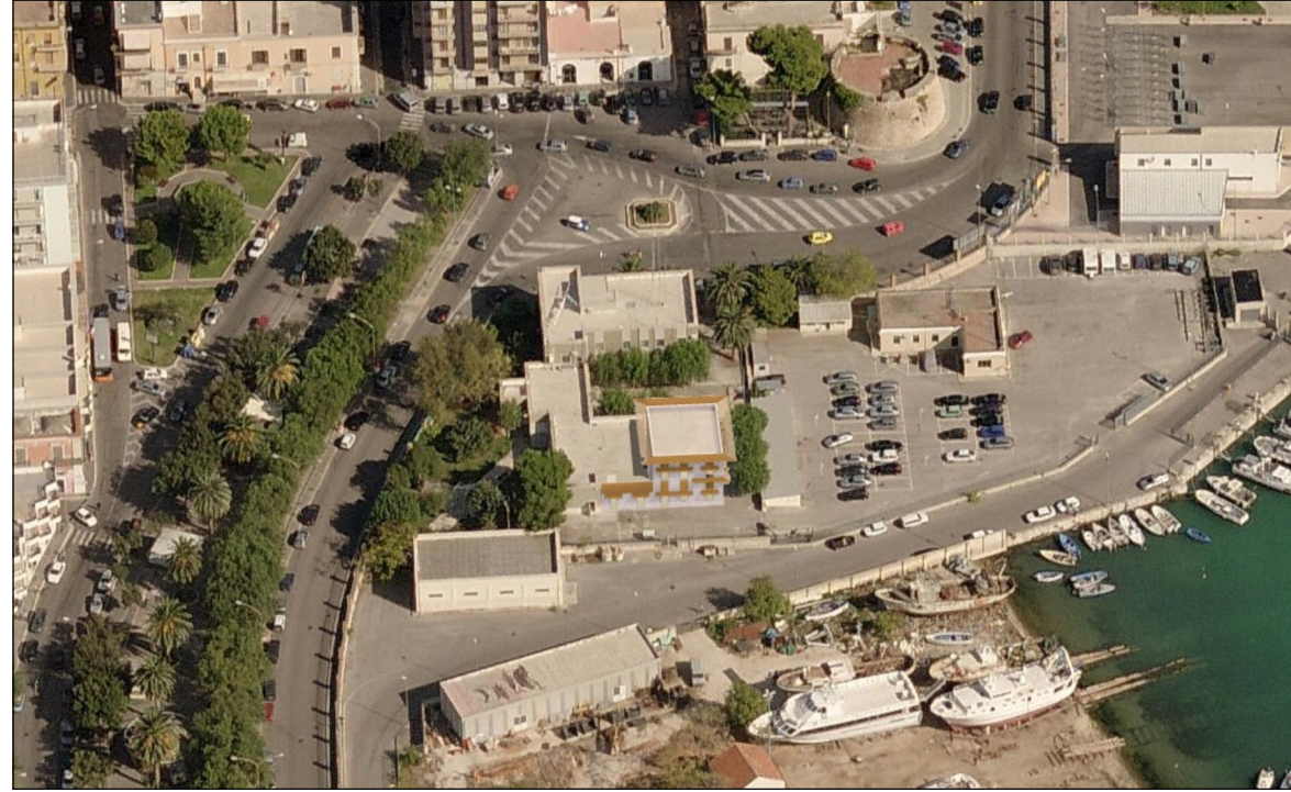
Vista 1 Post opera