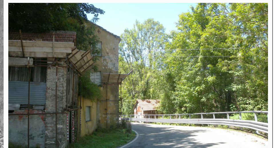
1. Edifici abbandonati lungo il tracciato di progetto della SS 45