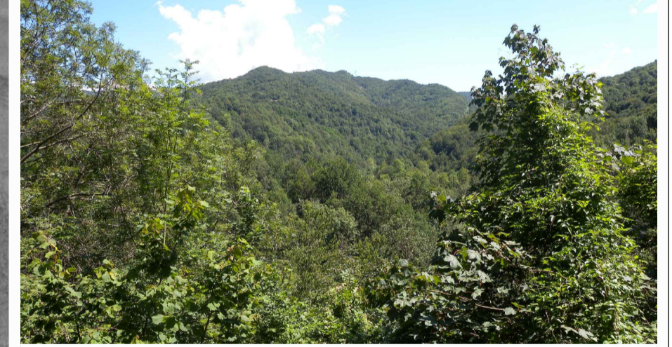
5. Vegetazione dell'ambito di progetto