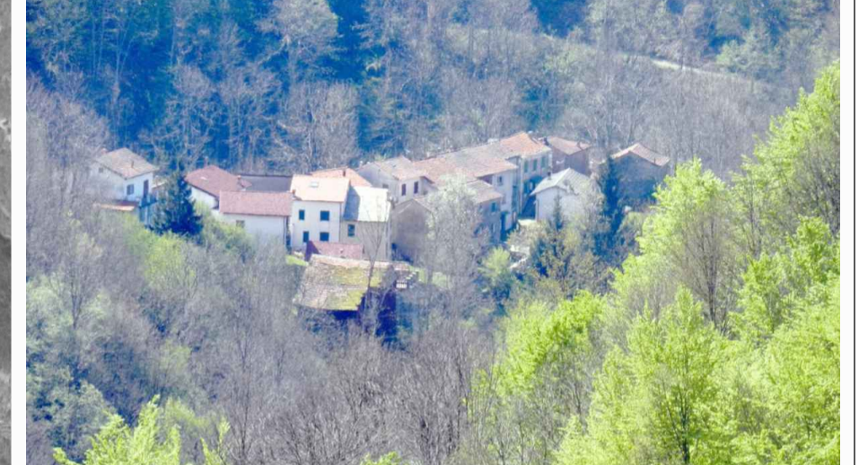
2. Vista di Serra di Ponte Trebbia