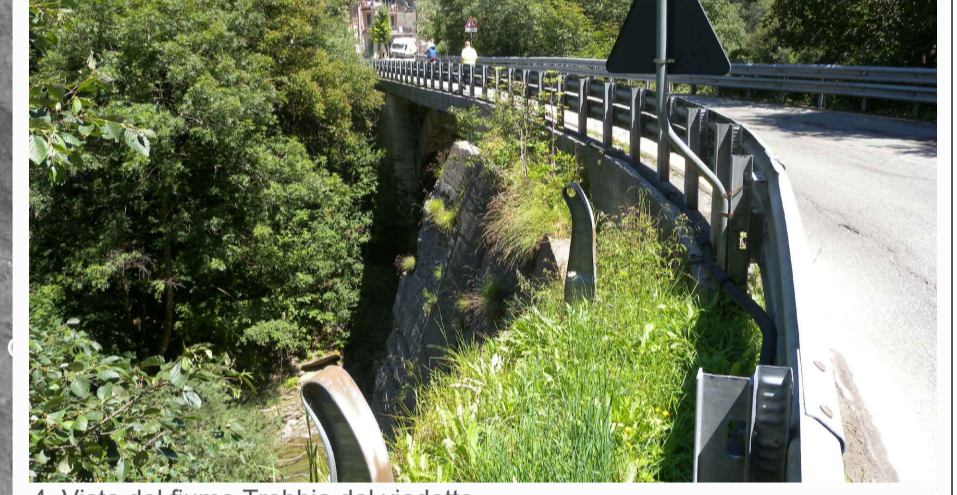
4. Vista del fiume Trebbia dal viadotto