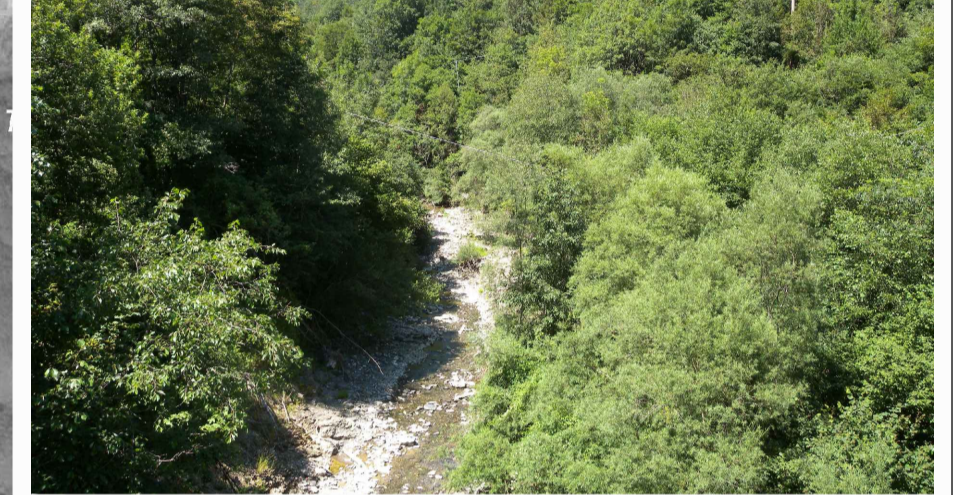
3. Fiume Trebbia