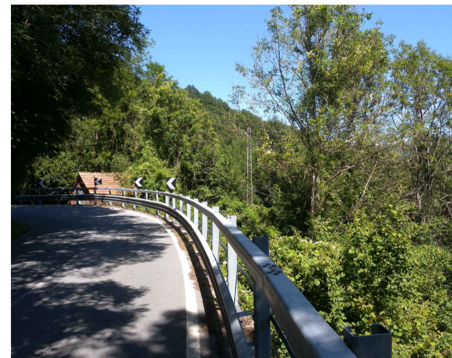
2. Stato di fatto