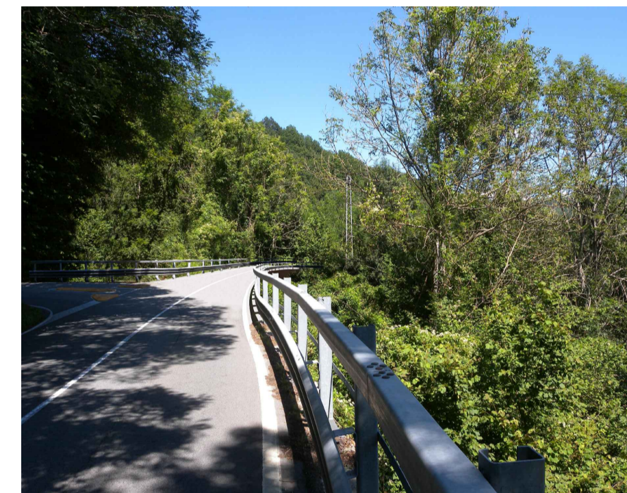
2. Fotosimulazione stato di progetto