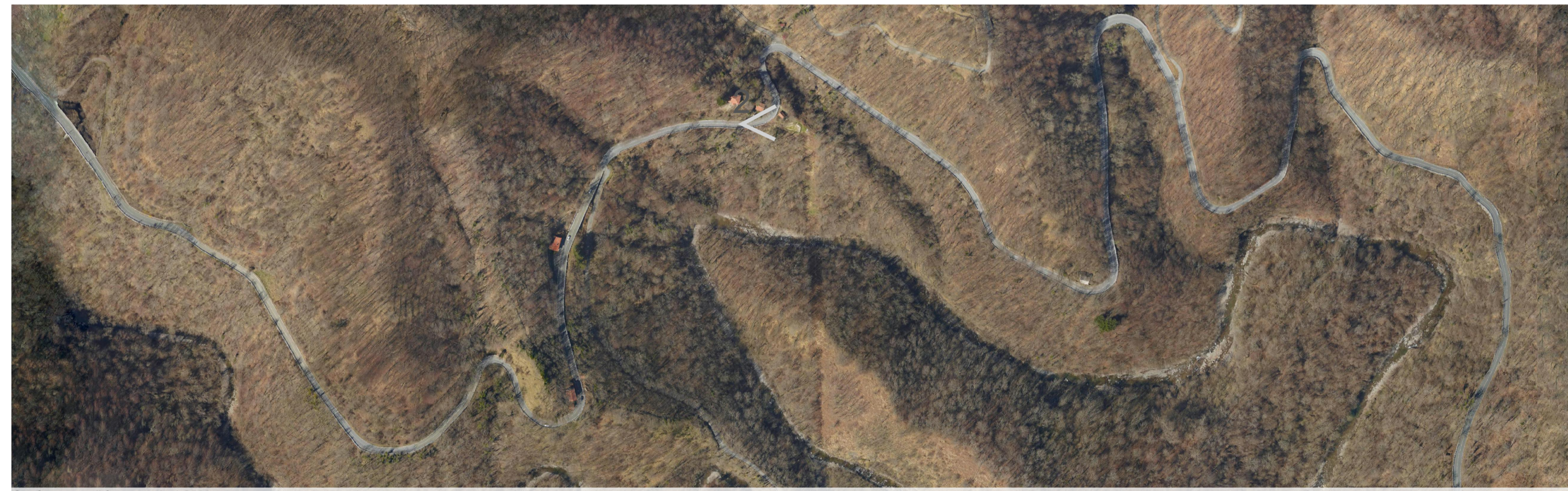
Ortofoto stato di fatto - scala 1:3500