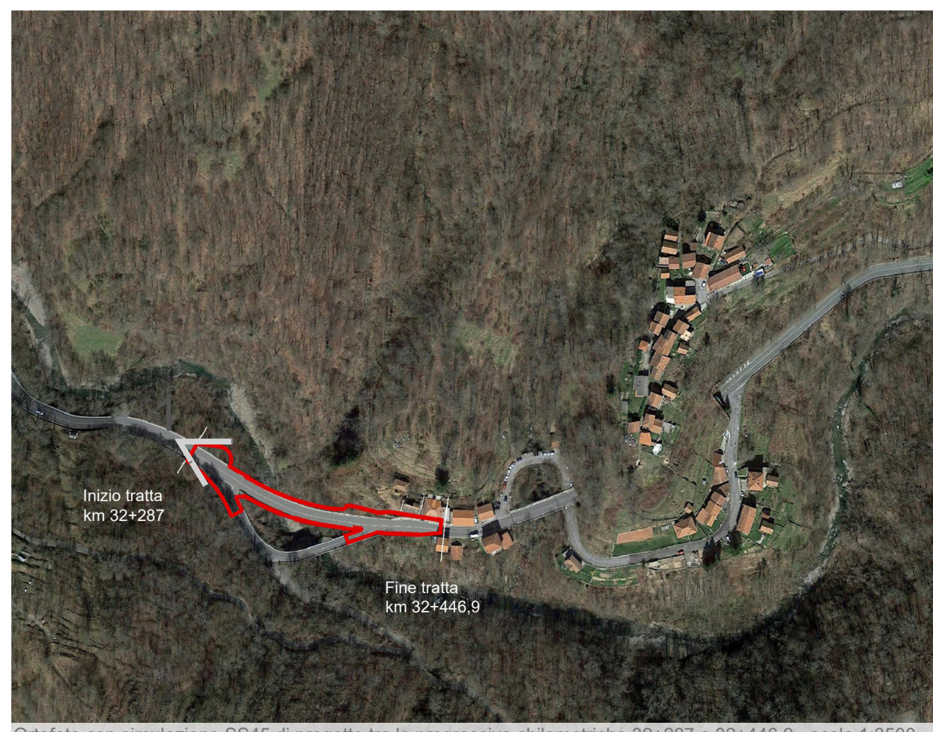
Ortofoto con simulazione SS45 di progetto tra le progressive chilometriche 32+287 e 32+446,9 - scala 1:3500