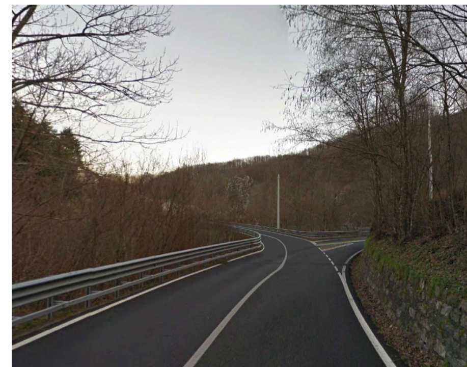
1. Fotosimulazione stato di progetto