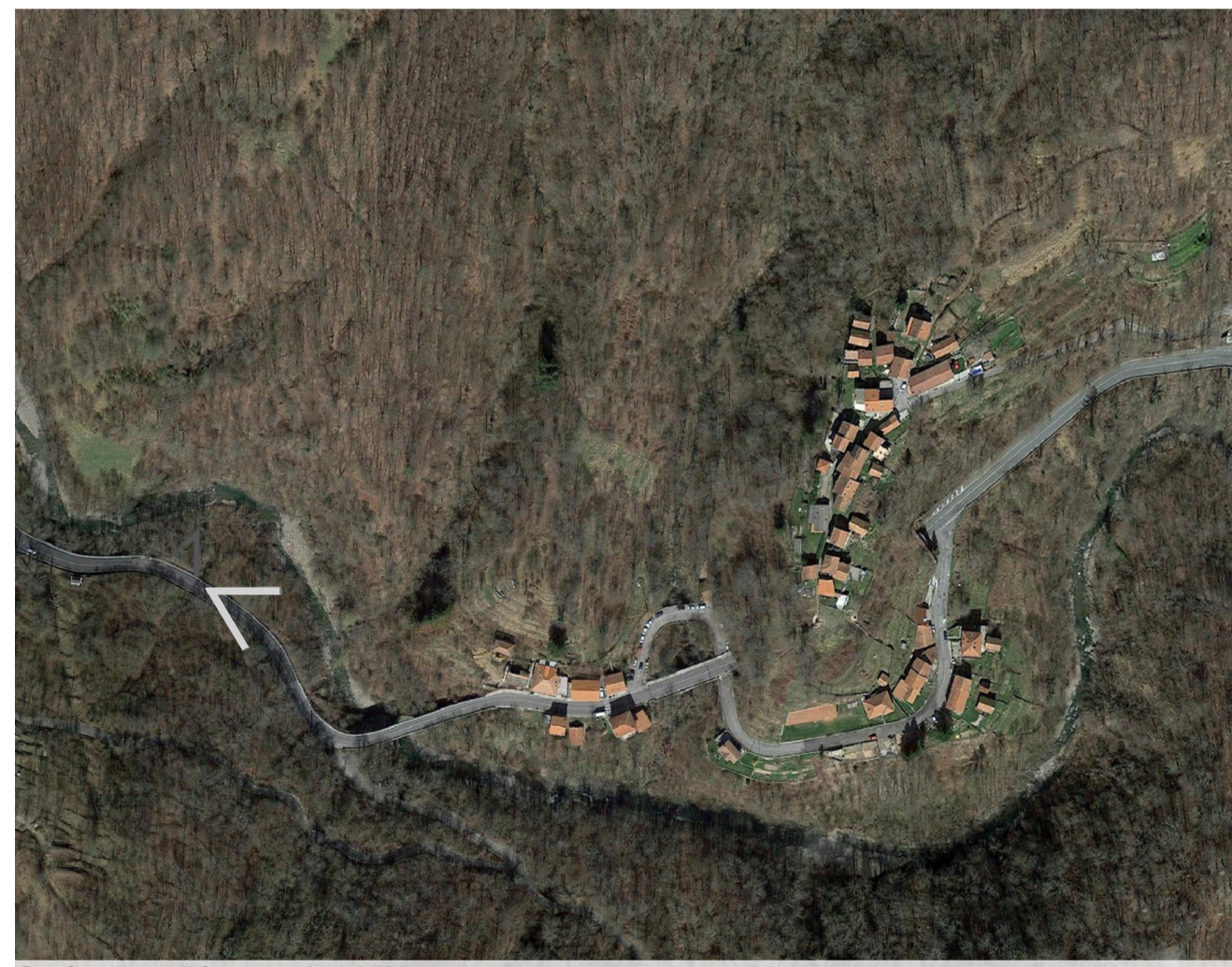
Ortofoto stato di fatto - scala 1:3500