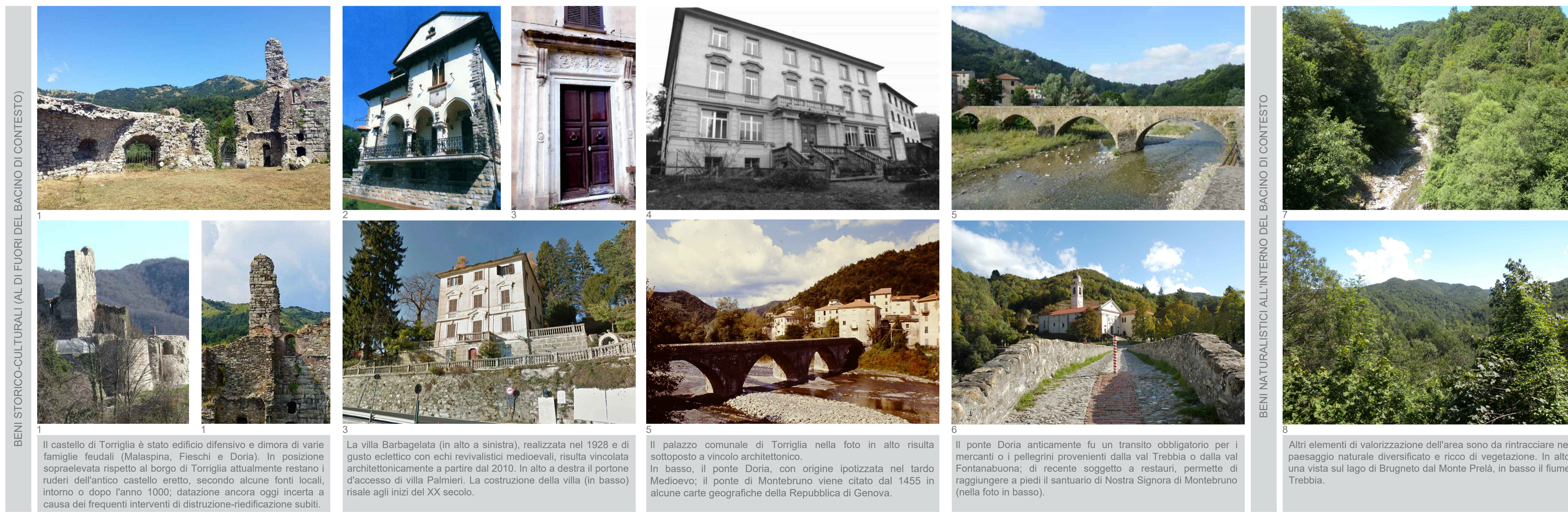
BENI STORICO-CULTURALI (AL DI FUORI DEL BACINO DI CONTESTO)