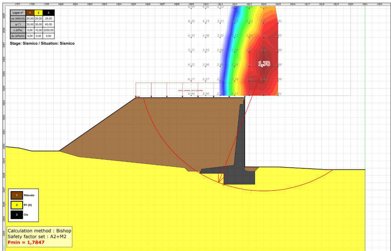
Verifica di stabilità globale in campo sismico