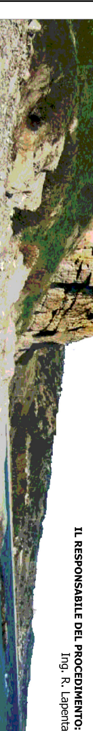
Fig. 1/4 - Gruppo 1 Fig. 2/1 - Gruppo 2 Fig. 3/1 - Gruppo 3

Il progettista Il coordinatore per la sicurezza Il responsabile del movimento