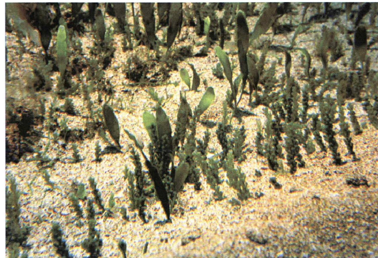
Foto 4: Stazione 6 - Particolare delle due Specie del Genere Caulerpa: "C. racemosa" e "C. prolifera" sul Fondale di Sabbia Grossolana. Si noti la Natura Instabile del Fondale.