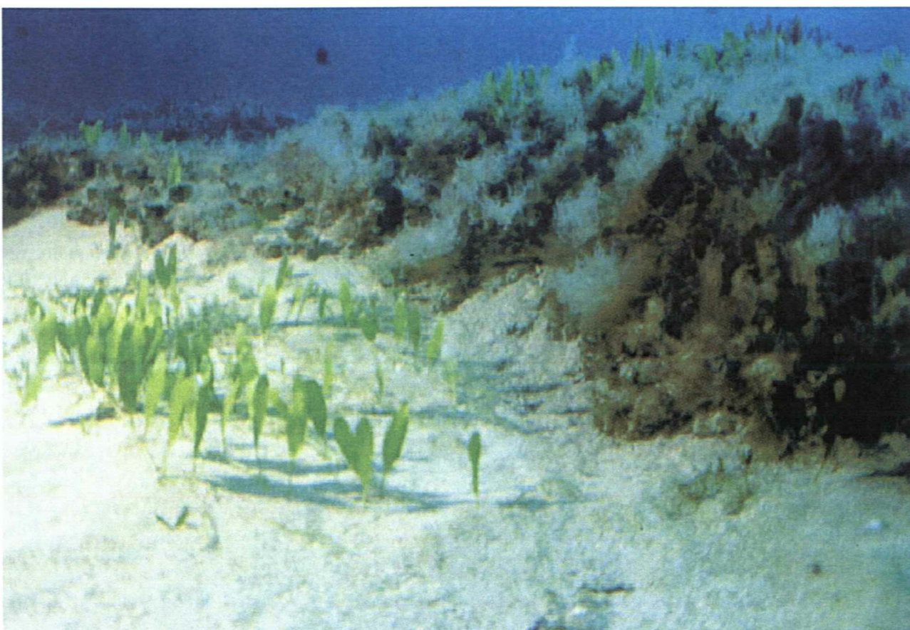
Foto 3: Stazione 5 - Affioramenti di Matte Morta di "Posidonia oceanica" e "Caulerpa prolifera".