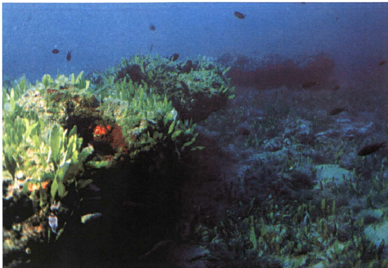
Foto 1: Stazione 2 - La Ricchezza Specifica di questa Stazione è Favorita dalla Morfologia del Fondale.