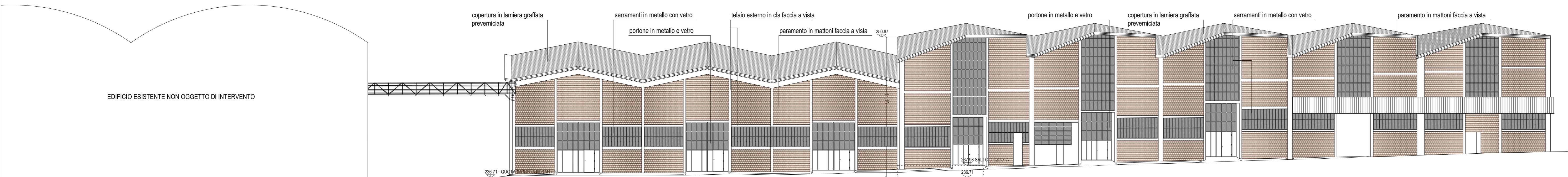
PROSPETTO SUD - EST

Comune di Nave Impianto Peaker per bilanciamento rete elettrica via Bologna 19, Nave (BRESCIA)