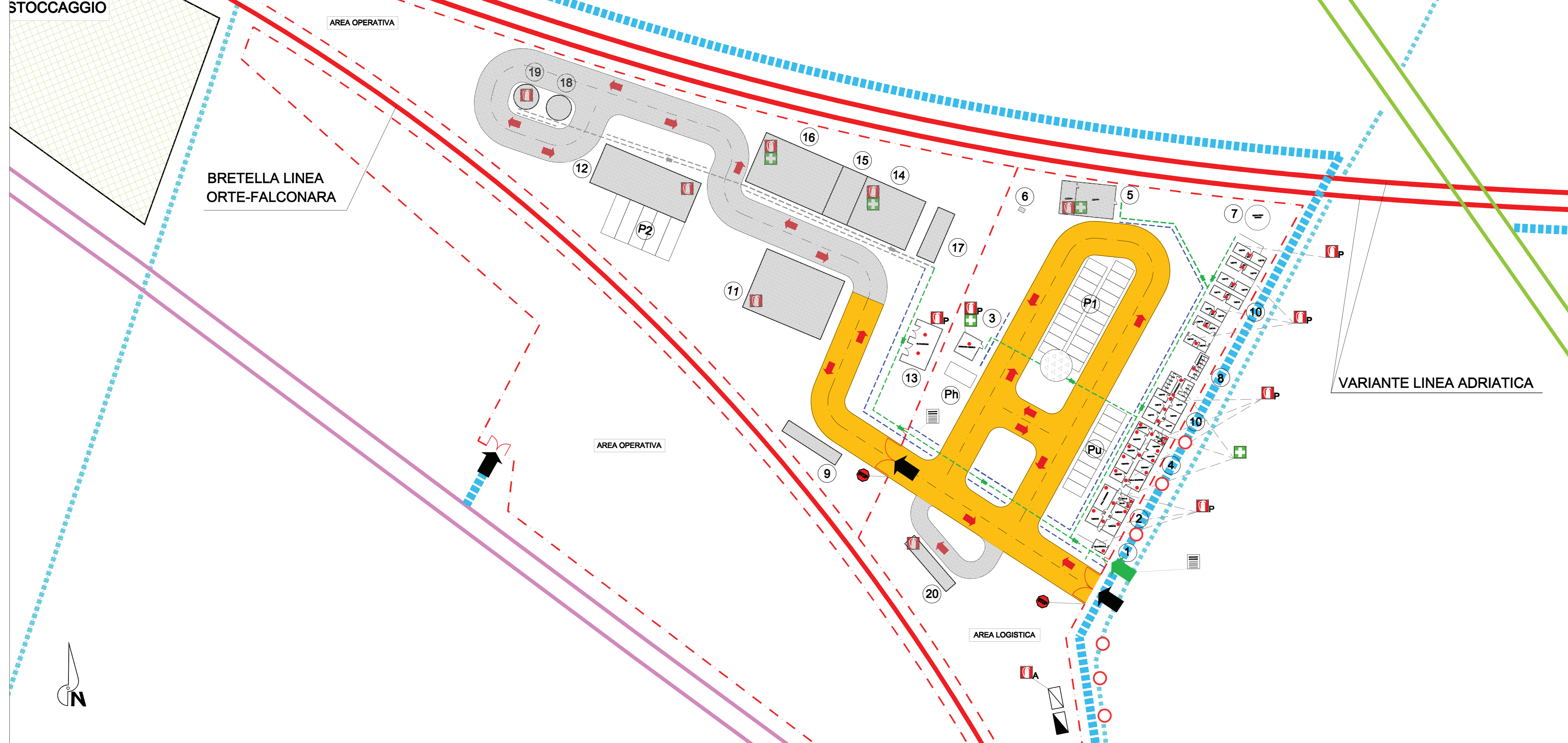
Layout CANTIERE OPERATIVO E DI BASE N.3 "CASERME" - Scala 1:500