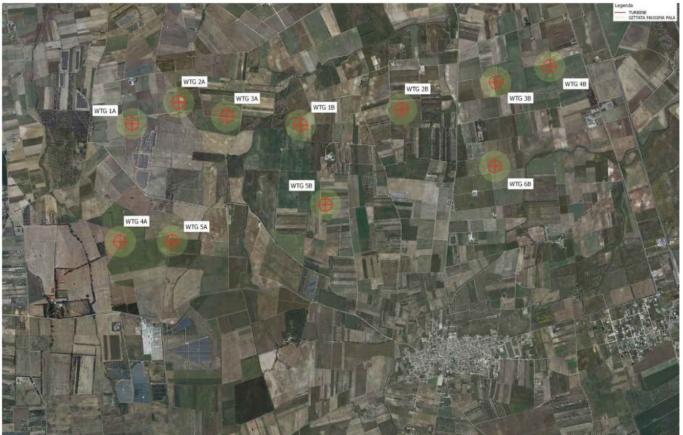
Figura 1 - Gittata massima della pala in caso di distacco - planimetria

Nota la posizione di quest'ultimo, date le caratteristiche geometriche della pala, si è calcolato il punto in cui cadrà il vertice della pala stessa, ovvero nella situazione peggiore il vertice della pala cadrà ad una distanza massima dall'asse della turbina pari a 177.49 m .