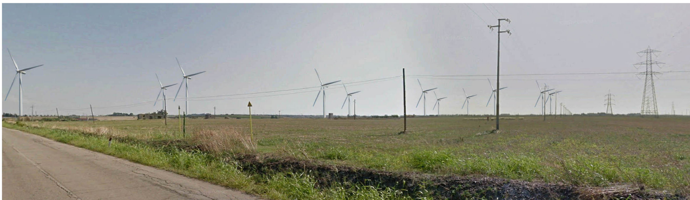
PUNTO FOTOGRAFICO 01 STRADA VALENZA PAESAGGISTICA SS16 POST OPERA