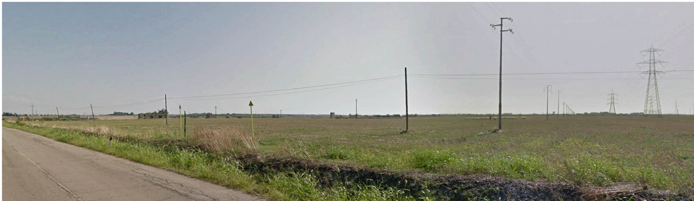
PUNTO FOTOGRAFICO 01 STRADA VALENZA PAESAGGISTICA SS16 ANTE OPERA