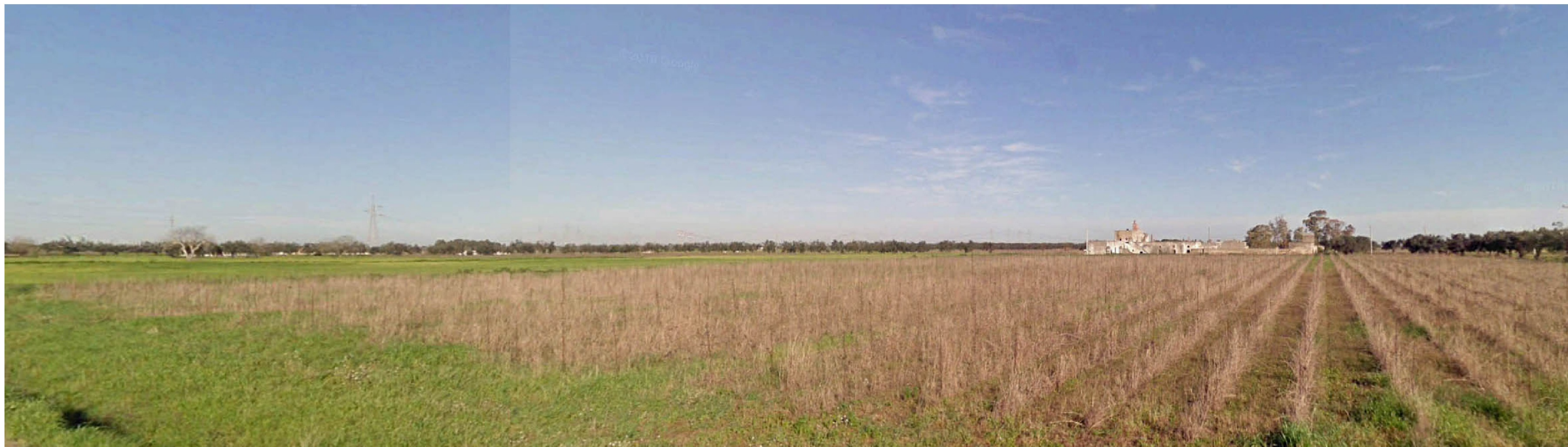
PUNTO FOTOGRAFICO 02 STRADA VALENZA PAESAGGISTICA SP 81 ANTE OPERA