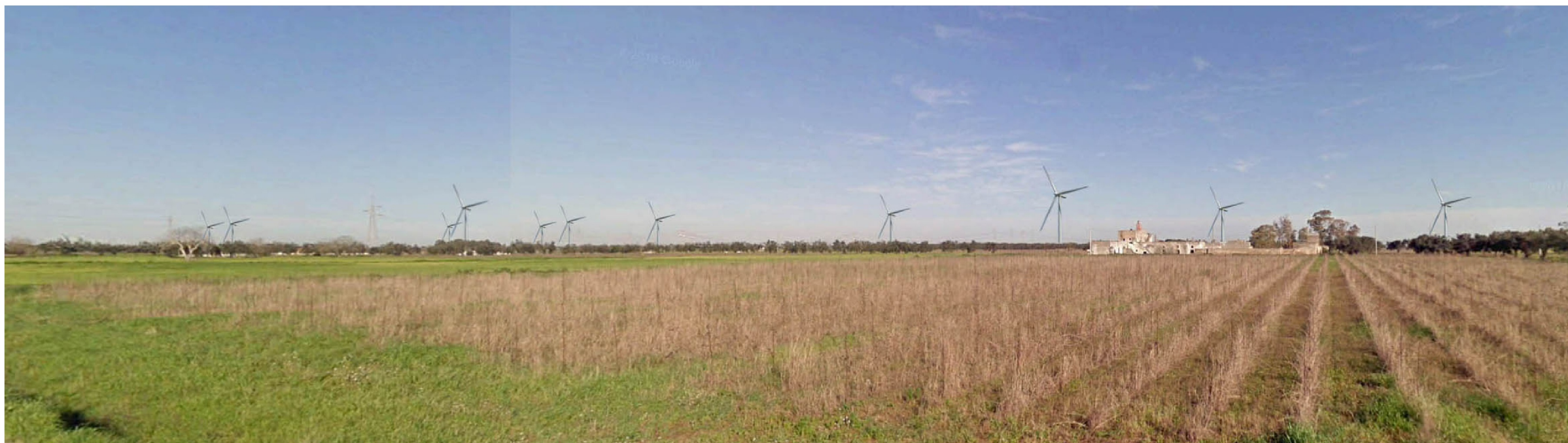
PUNTO FOTOGRAFICO 02 STRADA VALENZA PAESAGGISTICA SP 81 POST OPERA