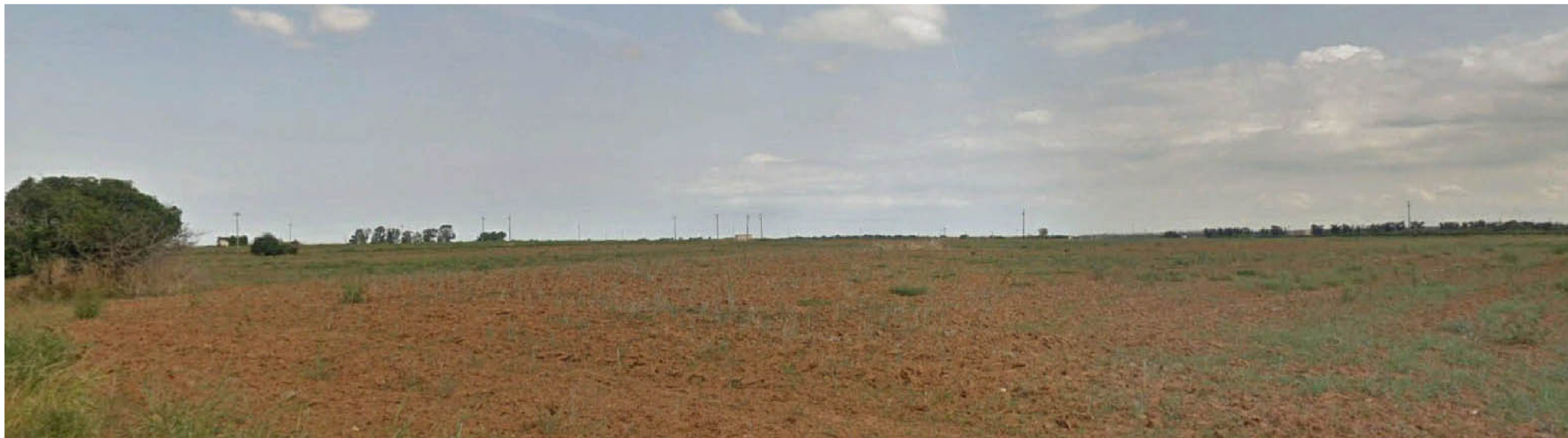
PUNTO FOTOGRAFICO 03 CENTRO ABITATO MESAGNE ANTE OPERA