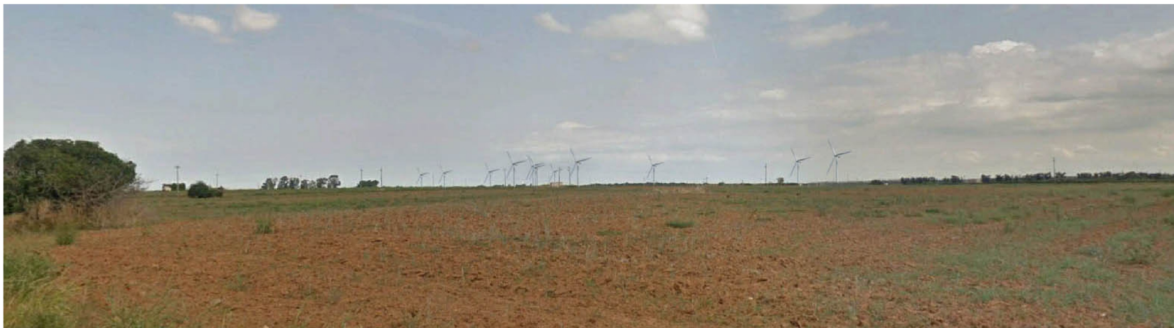
PUNTO FOTOGRAFICO 03 CENTRO ABITATO MESAGNE POST OPERA