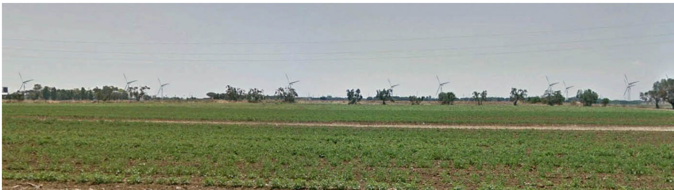
PUNTO FOTOGRAFICO 04 CENTRO ABITATO BRINDISI POST OPERA