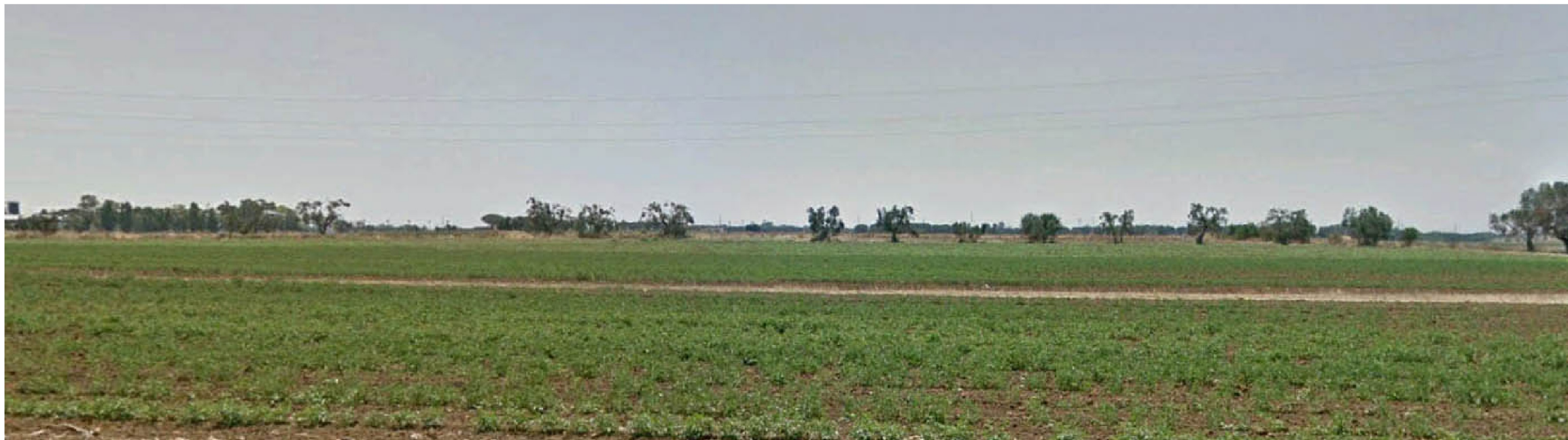
PUNTO FOTOGRAFICO 04 CENTRO ABITATO BRINDISI ANTE OPERA