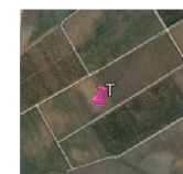
TURBINE TOZZI GREEN