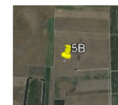
TURBINE EN IT