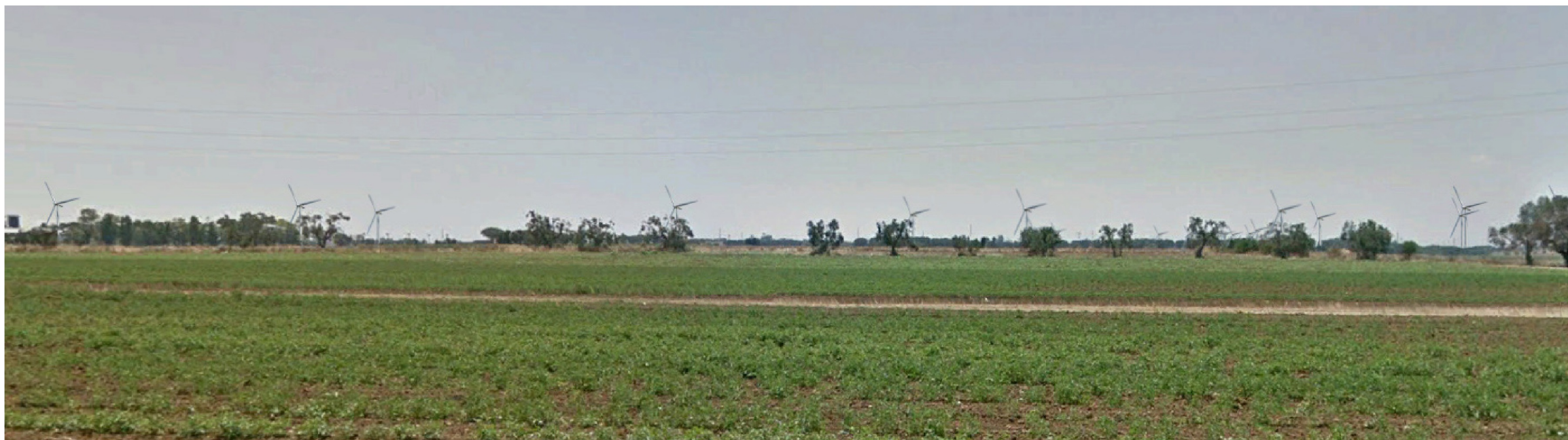
PUNTO FOTOGRAFICO 04 CUMULATIVO CENTRO ABITATO BRINDISI POST OPERA