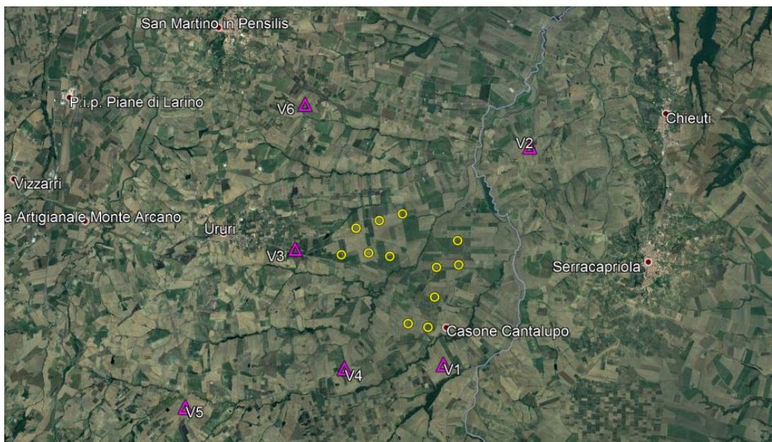
Figura 4 - Individuazione dei punti di presa fotografica dagli elementi sensibili

mentre i punti di vista da cui si è analizzata la visibilità del parco eolico di progetto sono indicati sull'ortofoto seguente: