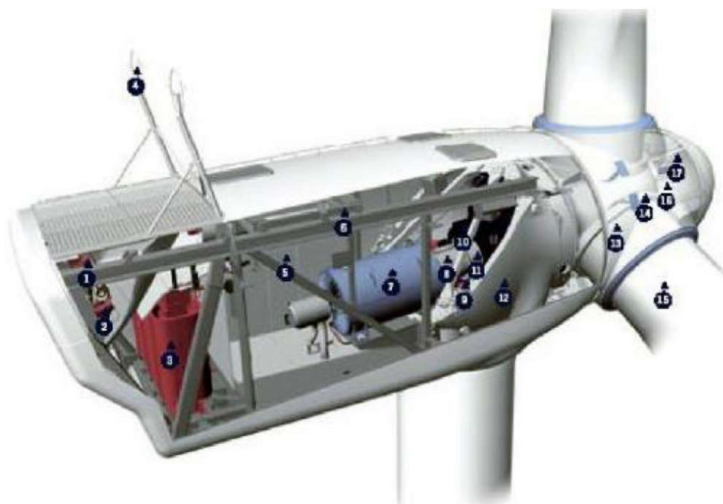
Fig. 4-1a. Schema di navicella completa di rotore e di pale (1. Raffreddamento olio; 2. Raffreddamento generatore; 3. Trasformatore; 4. Sensori condizioni vento; 5. Sistema controllo; 6. Argano e rotaia di movimentazione pezzi; 7. Punto di controllo generatore; 8. Collegamento generatore-moltiplicatore giri; 9. Azionamento imbardata; 10. Moltiplicatore; 11. Freno di stazionamento; 12. Cella di sostegno macchinario; 13. Cuscinetto di pala; 14/15. Albero; 16. Collegamento per azionamento pitch; 17. Controller dell'albero)