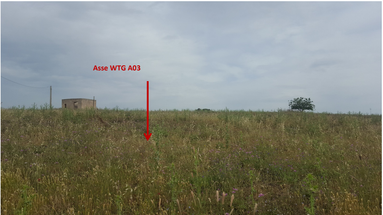
Stato dei luoghi WTG A03