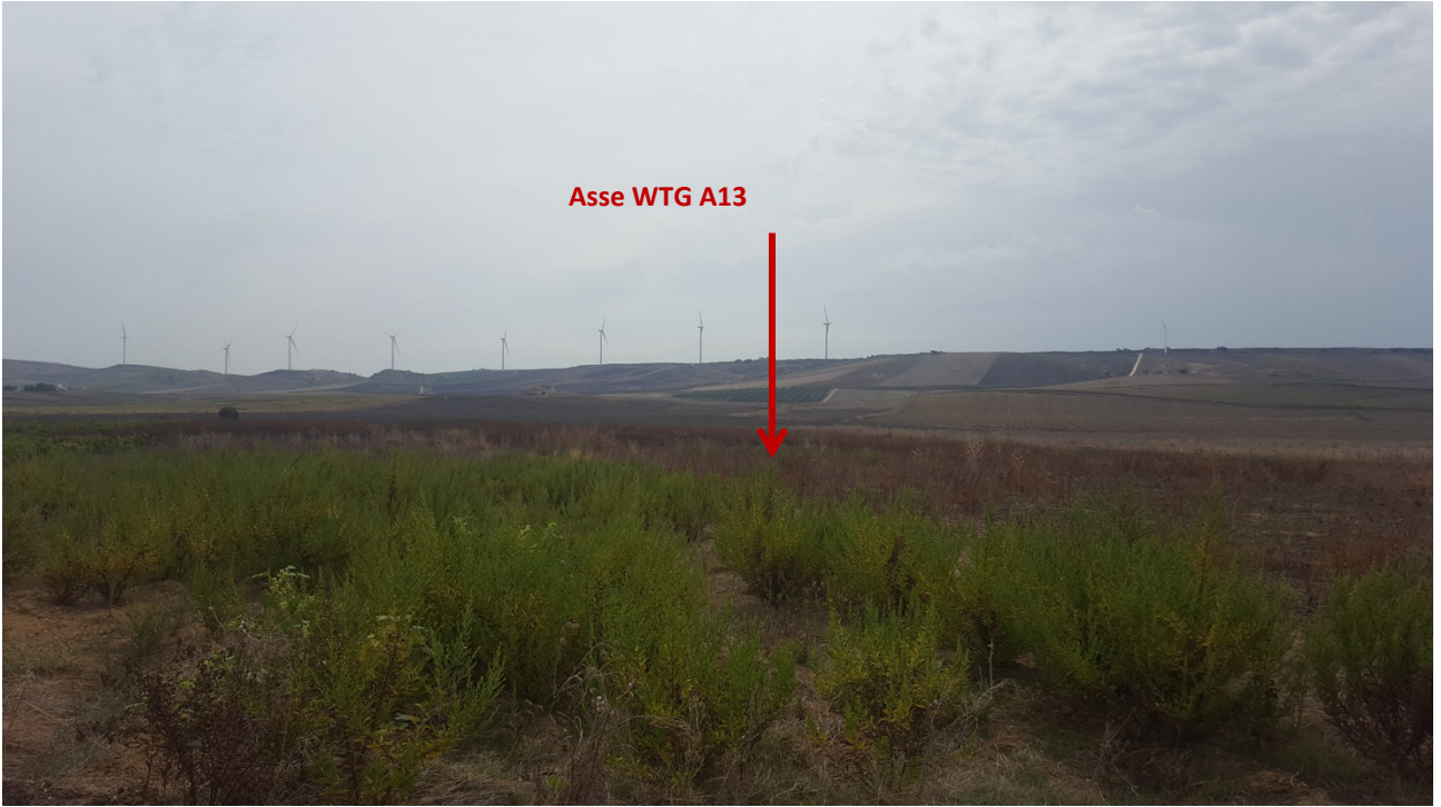
Stato dei luoghi WTG A13