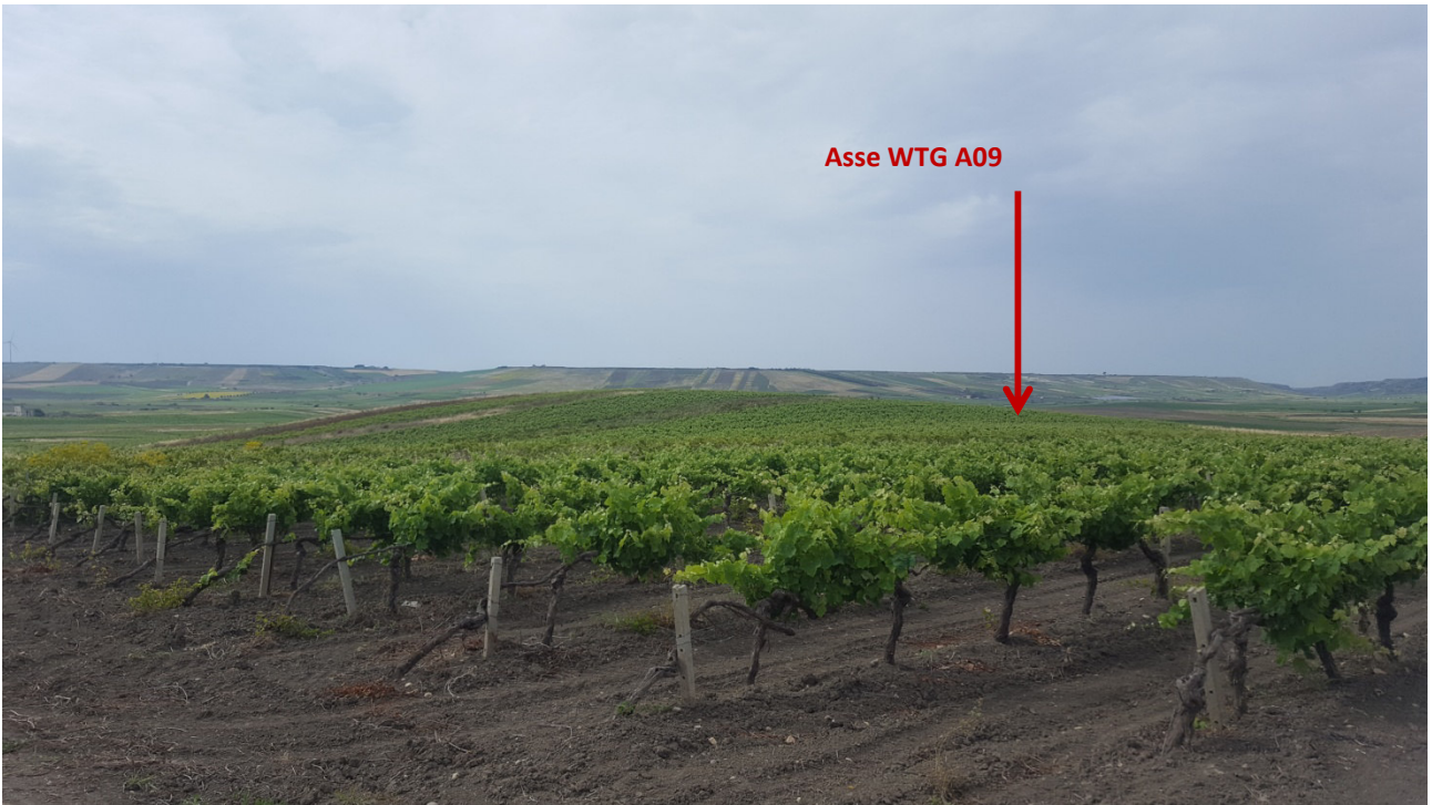
Stato dei luoghi WTG A09