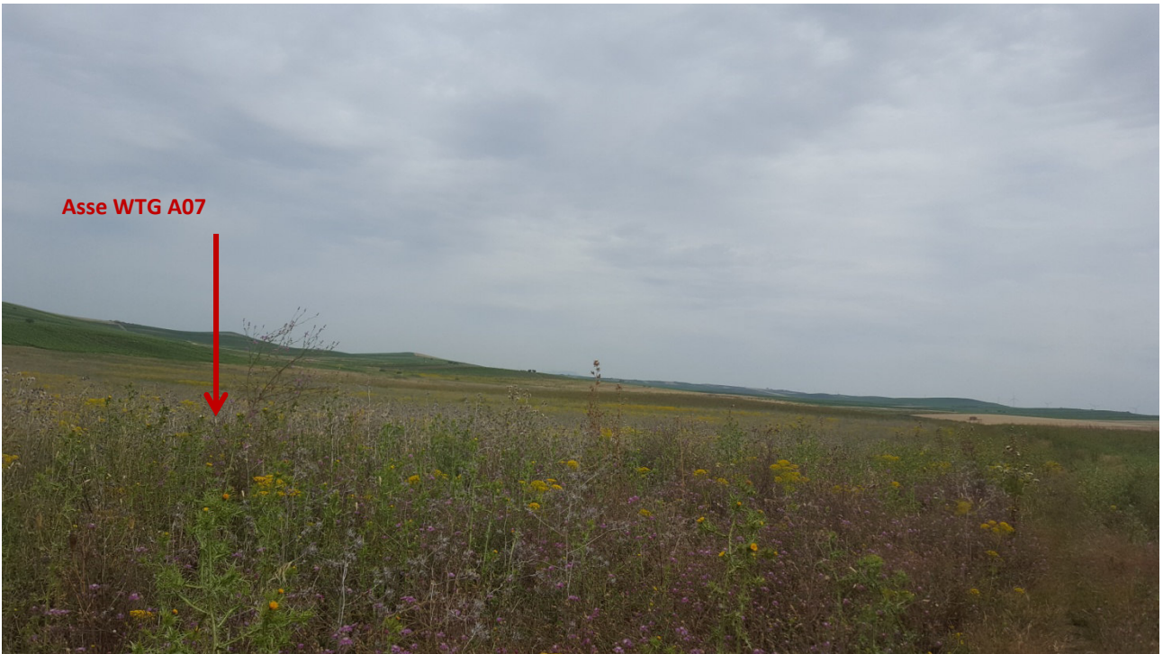
Stato dei luoghi WTG A07