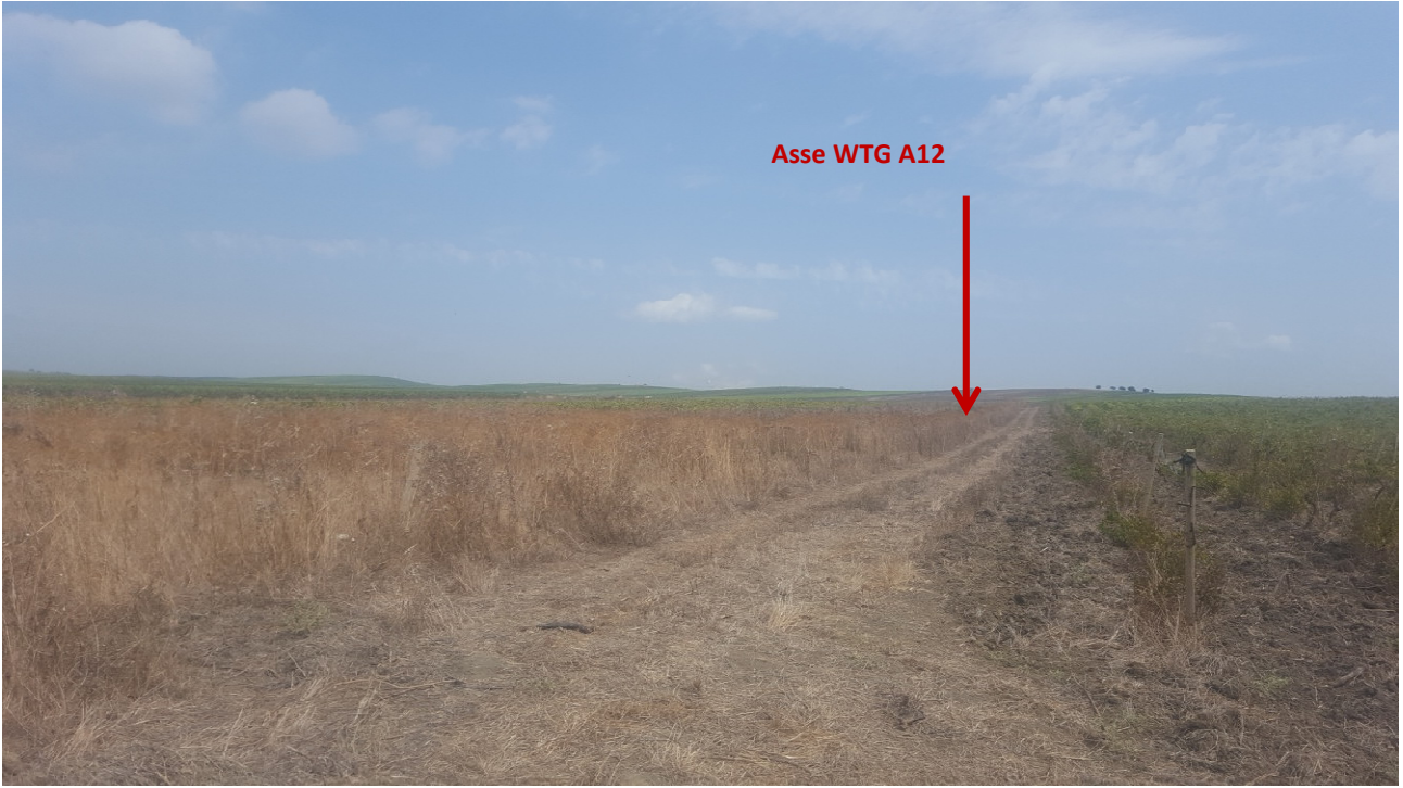
Stato dei luoghi WTG A12