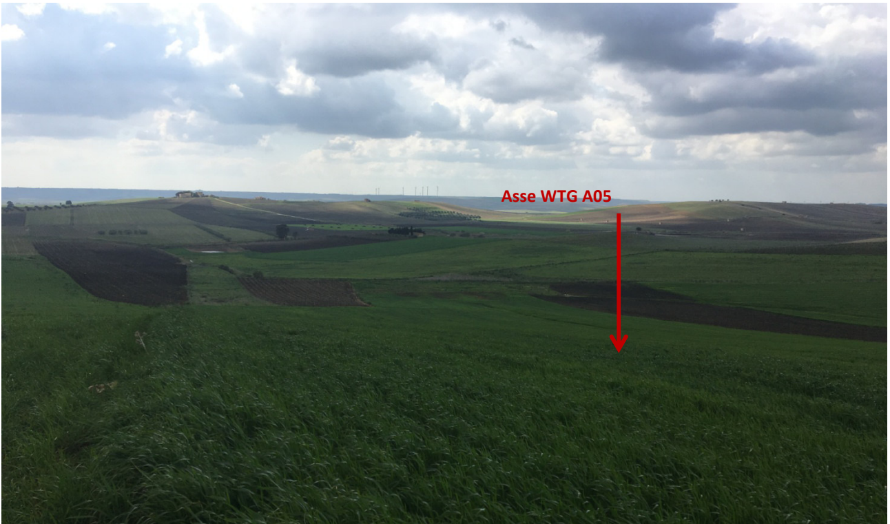
Stato dei luoghi WTG A05