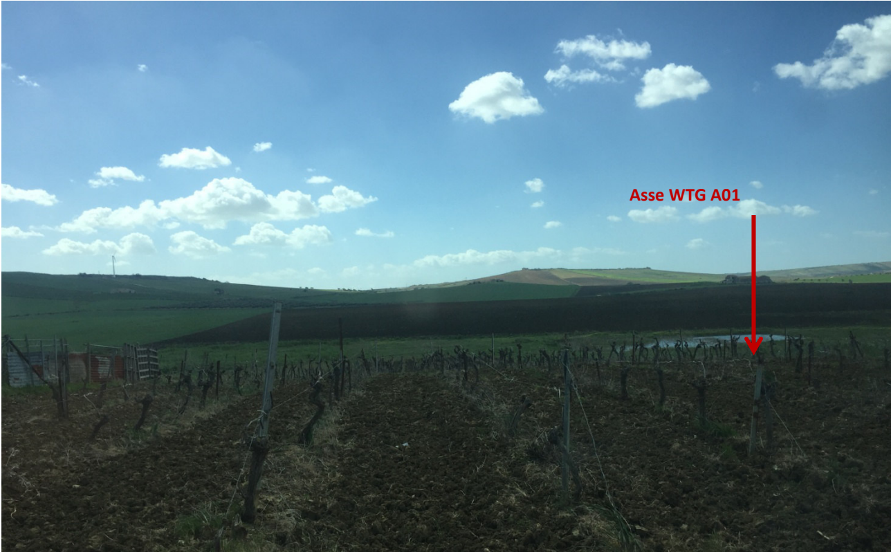
Stato dei luoghi WTG A01