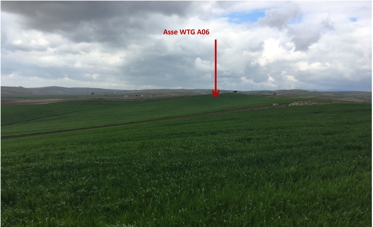
Stato dei luoghi WTG A06