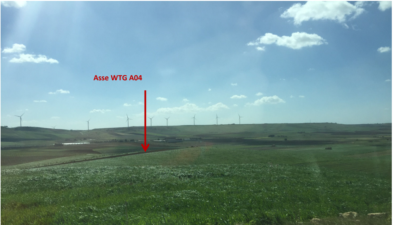
Stato dei luoghi WTG A04