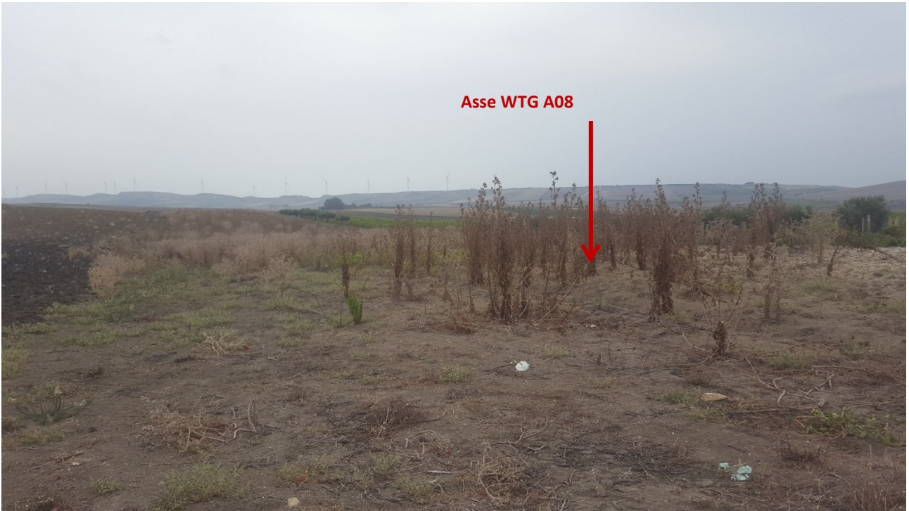
Stato dei luoghi WTG A08