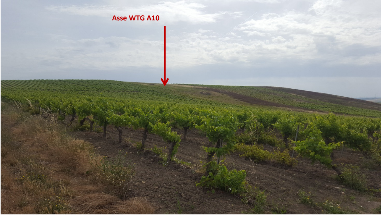
Stato dei luoghi WTG A10