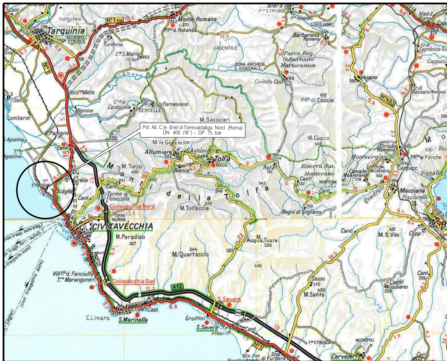
COROGRAFIA Scala 1:200.000