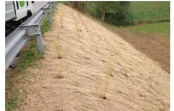
TRATTAMENTO ANTIEROSIVO DI SCARPATE STRADALI REALIZZATO CON: