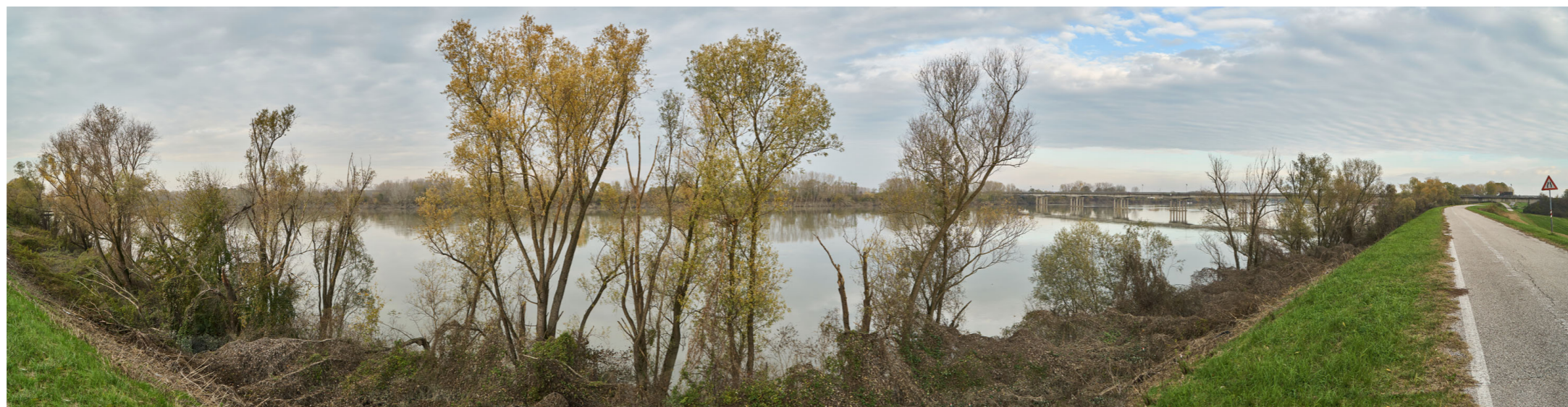
Punto di ripresa n°17 - vista dell'area di intervento del Gruppo n°1, dall'argine maestro del Po, in sponda destra. Si nota la struttura arginale con i pendii a vegetazione prativa e la ricca vegetazione ripariale sul bordo del fiume; tra questa si evidenzia la presenza di numerosi alberi igrofilo. Sullo sfondo si intravede il ponte sul Po che collega la SP n° 34bis (Provincia di Rovigo) con la SP n° 91 (Provincia di Mantova).