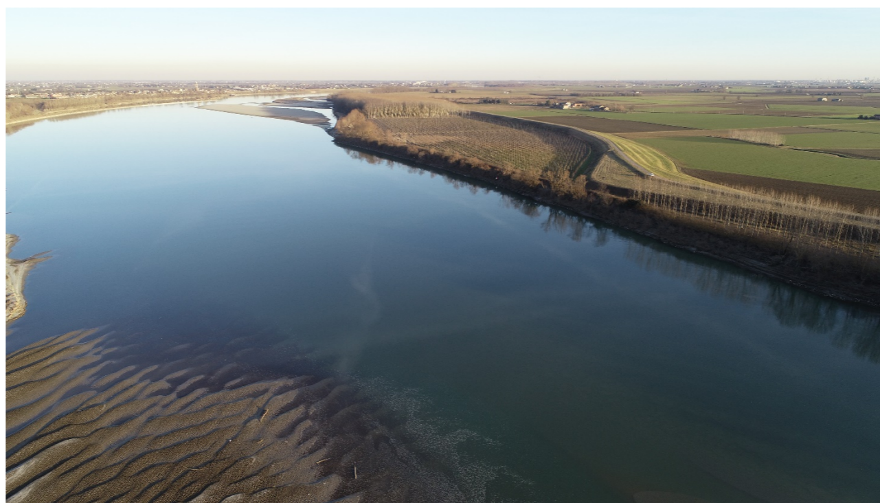
Punto di ripresa n°7