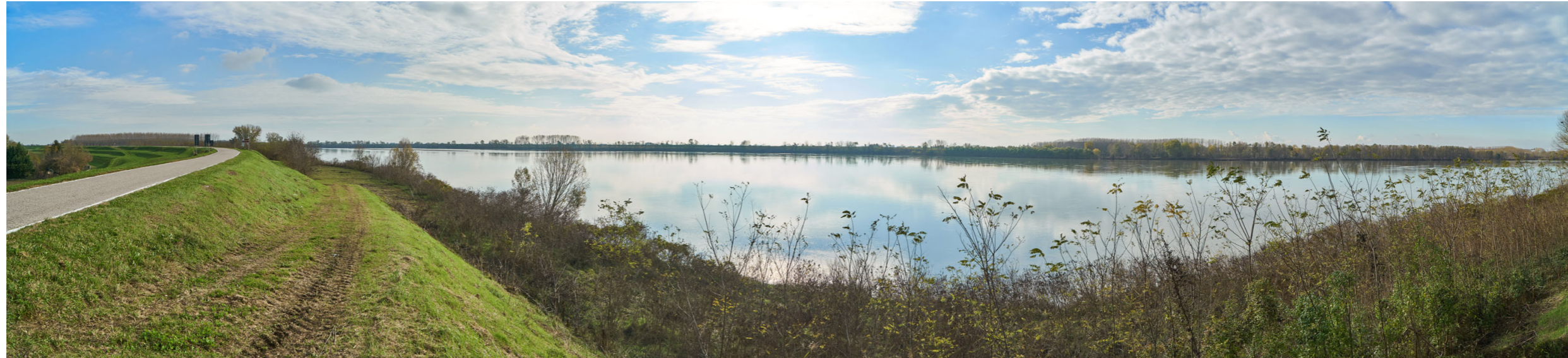
Punto di ripresa n°14 - viste dell'area di intervento del Gruppo n°3, dall'argine maestro del Po, in sponda sinistra. La foto mostra la struttura arginale con scarpata a vegetazione prativa ed una discesa carrabile; la fascia tra l'argine ed il fiume è ricca di vegetazione ripariale. Sulla riva opposta, dove è situata un'altra parte dell'intervento del Gruppo n°3, si notano zone golenali con coltivazioni di pioppeti e fasce alberate spontanee.