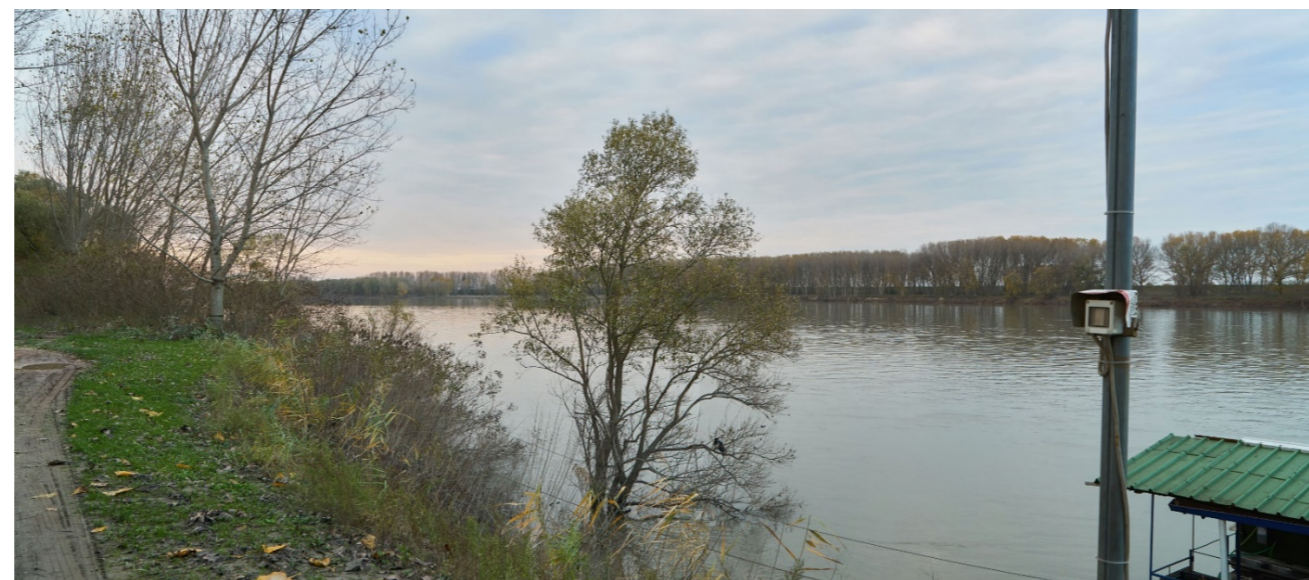
Punto di ripresa n°24 - vista dell'area di intervento del Gruppo n°7 dalla sponda destra del fiume. Si nota la ricca vegetazione ripariale e gli alberi di diverse specie autoctone igrofile; sulla destra è presente un punto di attracco galleggiante.