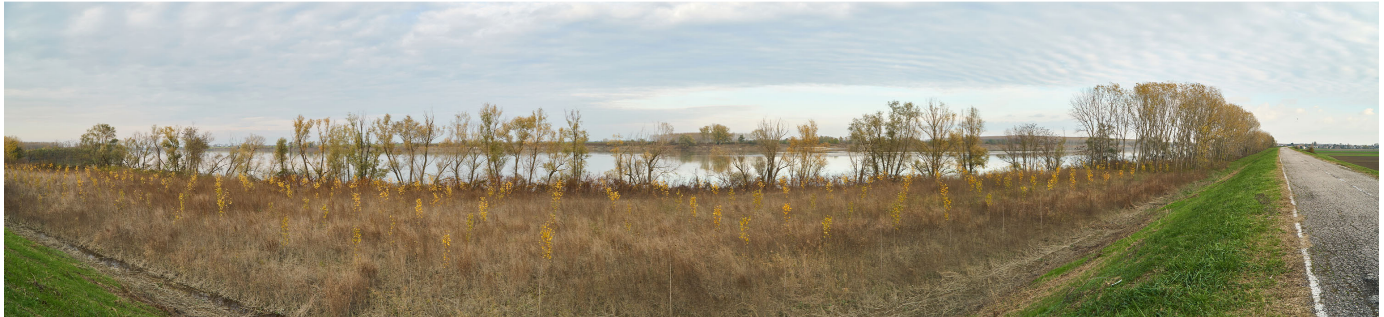
Punto di ripresa n°18 - vista dell'area di intervento del Gruppo n°3, dall'argine maestro del Po, in sponda destra. Si notano la struttura arginale a vegetazione prativa e la zona golenale coltivata a pioppeto di recente impianto; sulla riva fluviale è presente una ricca vegetazione ripariale. Il livello dell'acqua particolarmente alto copre l'ampio greto sabbioso presente in queste aree.