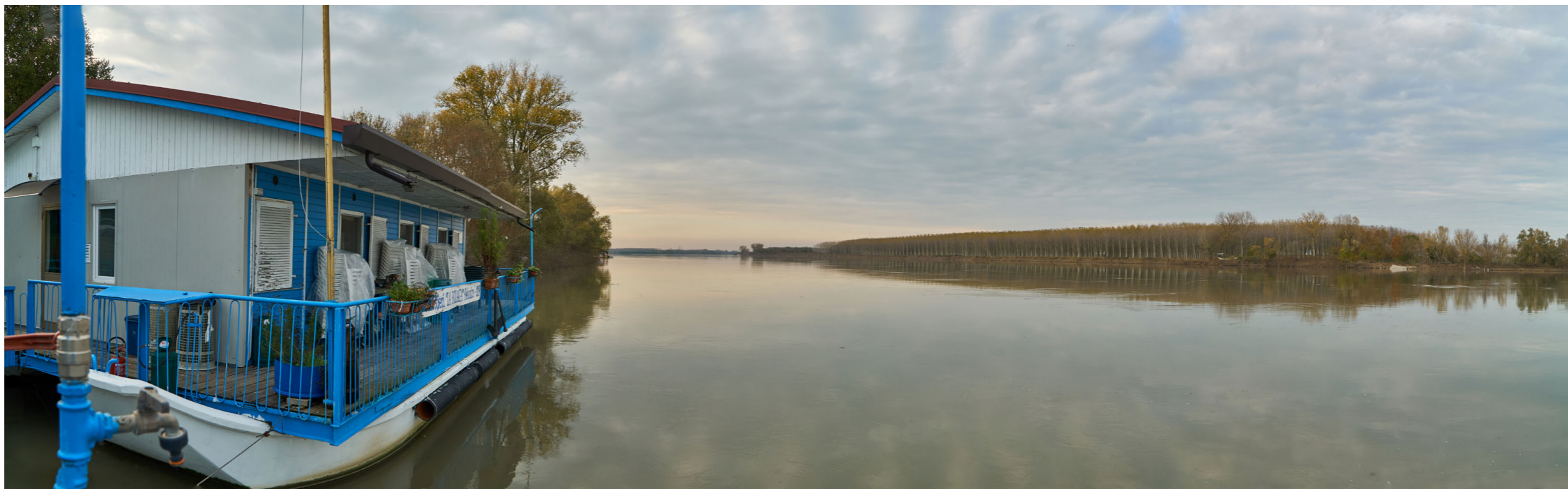
Punto di ripresa n°20 - viste dell'area di intervento del Gruppo n°4, nella zona del Parco fluviale di Felonica, in sponda destra. Nella foto si evidenziano le rive ricche di vegetazione ripariale e la zona golenale ricca di alberi autoctoni del Parco fluviale. In primo piano si notano i pontili del punto di attracco di Felonica. Nella seconda e terza foto, in primo piano, si nota la struttura galleggiante sede della Società Canottieri di Felonica; sulla riva del fiume si nota la folta vegetazione ripariale e la presenza di numerosi alberi; in quest'area è presente un albero segnalato come monumentale, indicato nel PTCP della Provincia di Mantova e nel PGT del Comune di Sermide e Felonica.