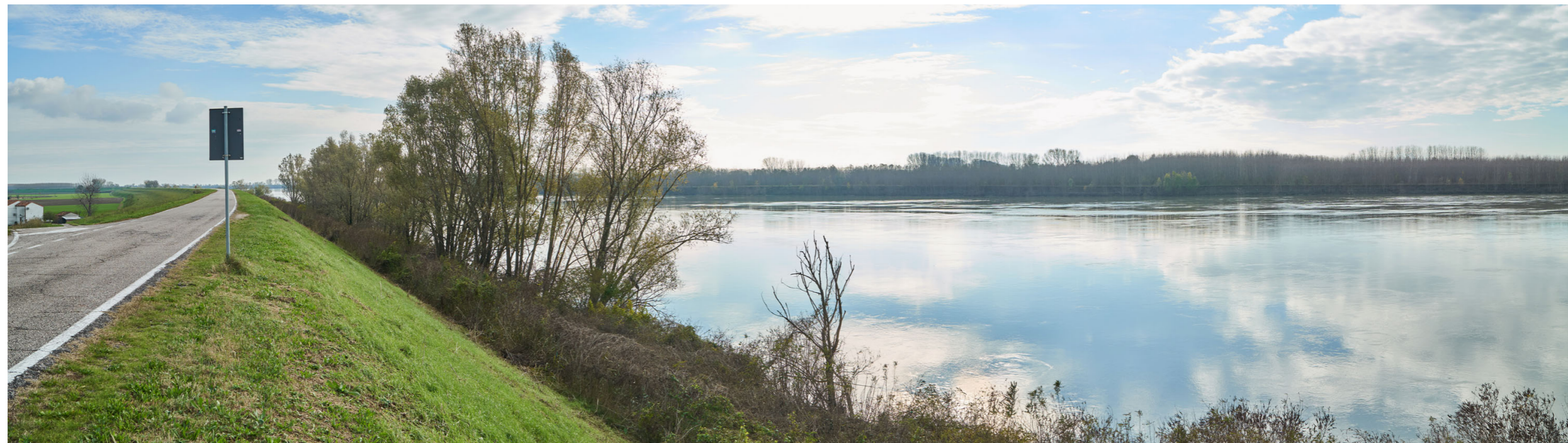
Punto di ripresa n°15 - vista dell'area di intervento del Gruppo n°2, dall'argine maestro del Po, in sponda sinistra. La foto mostra l'imponente struttura arginale con scarpate a vegetazione prativa; tra l'argine ed il fiume si nota la stretta fascia ricca di vegetazione ripariale e alberi igrofilo.