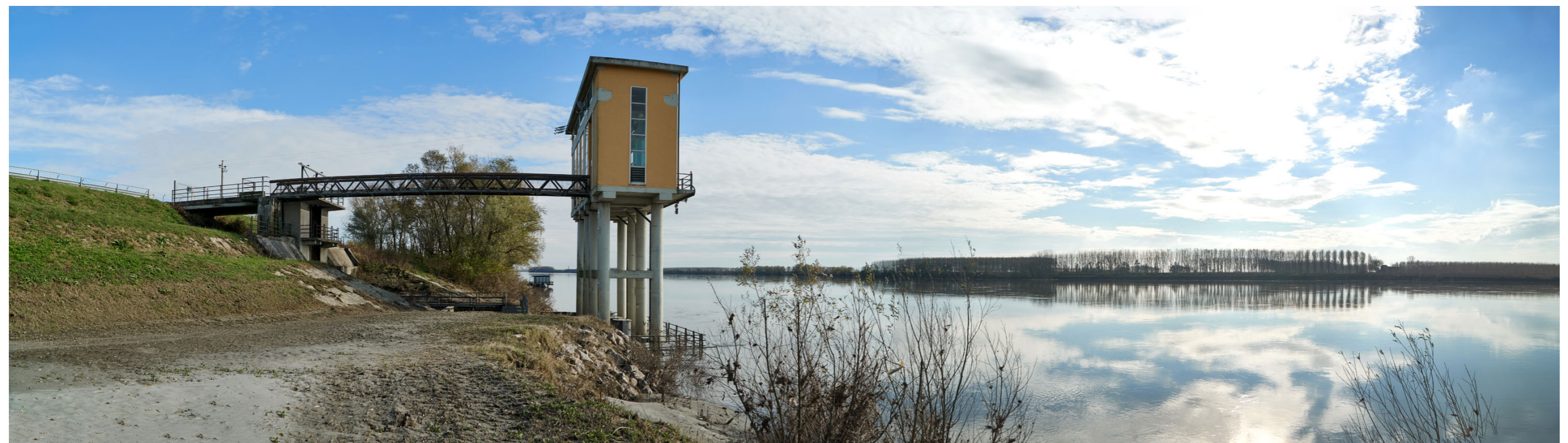
Punto di ripresa n°13 - vista dell'area di intervento del Gruppo n°12, dalla zona all'interno dell'alveo del Po, in sponda sinistra. Le quattro foto mostrano la struttura della Chiavica di Calto, derivazione del Cavo di Calto dal Fiume Po. L'area di intervento si trova a valle della struttura.