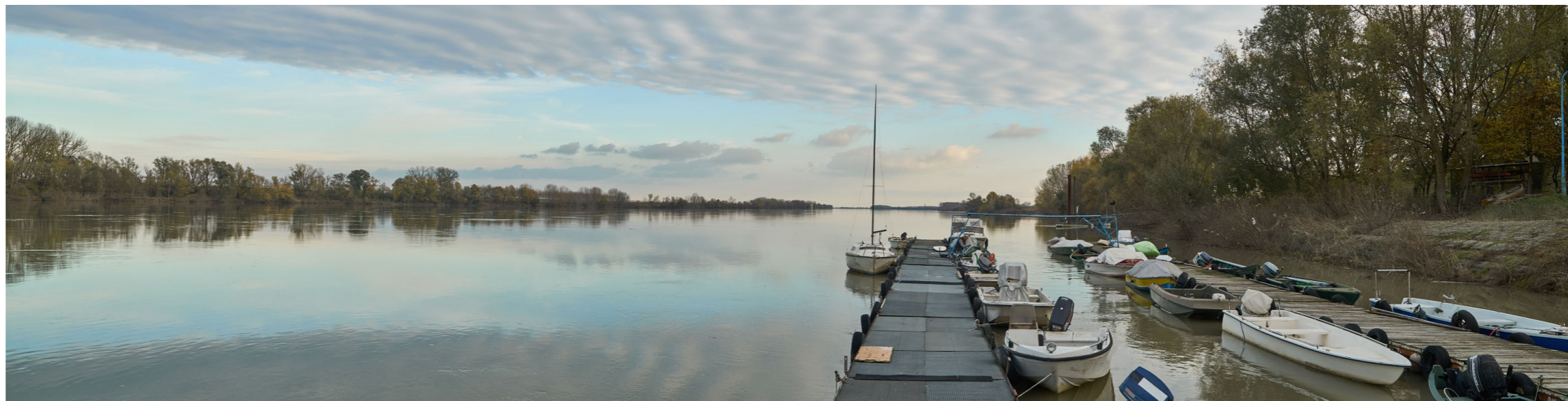
Punto di ripresa n°20 - viste dell'area di intervento del Gruppo n°4, nella zona del Parco fluviale di Felonica, in sponda destra. Nella foto si evidenziano le rive ricche di vegetazione ripariale e la zona golenale ricca di alberi autoctoni del Parco fluviale. In primo piano si notano i pontili del punto di attracco di Felonica. Nella seconda e terza foto, in primo piano, si nota la struttura galleggiante sede della Società Canottieri di Felonica; sulla riva del fiume si nota la folta vegetazione ripariale e la presenza di numerosi alberi; in quest'area è presente un albero segnalato come monumentale, indicato nel PTCP della Provincia di Mantova e nel PGT del Comune di Sermide e Felonica.