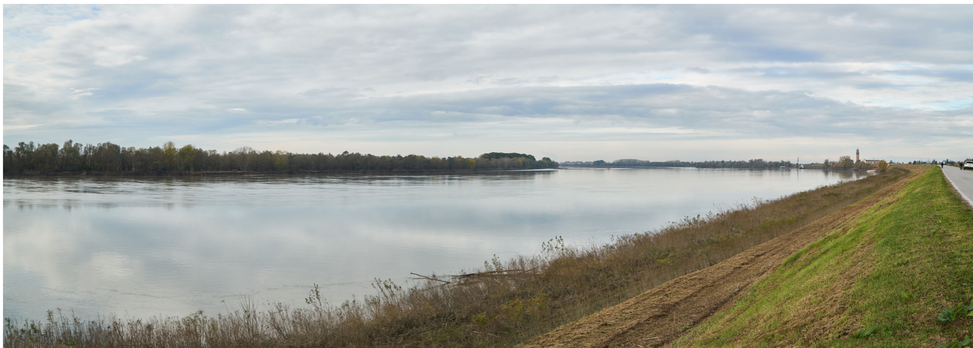
Punto di ripresa n°3 - vista dell'area di intervento del Gruppo n°14, dall'argine maestro del Po, in sponda sinistra. L'area, posta sul confine tra i Comuni di Stienta e di Occhiobello, è caratterizzata dalla ripida scarpata dell'argine a vegetazione di tipo prativo e da una fascia ripariale con una ricca vegetazione idrofila ed igrofila. L'area tra l'argine ed il fiume in questo tratto è indicata, nel PAT del Comune di Stienta e nel PAT del Comune di Occhiobello, come "zone boscate".