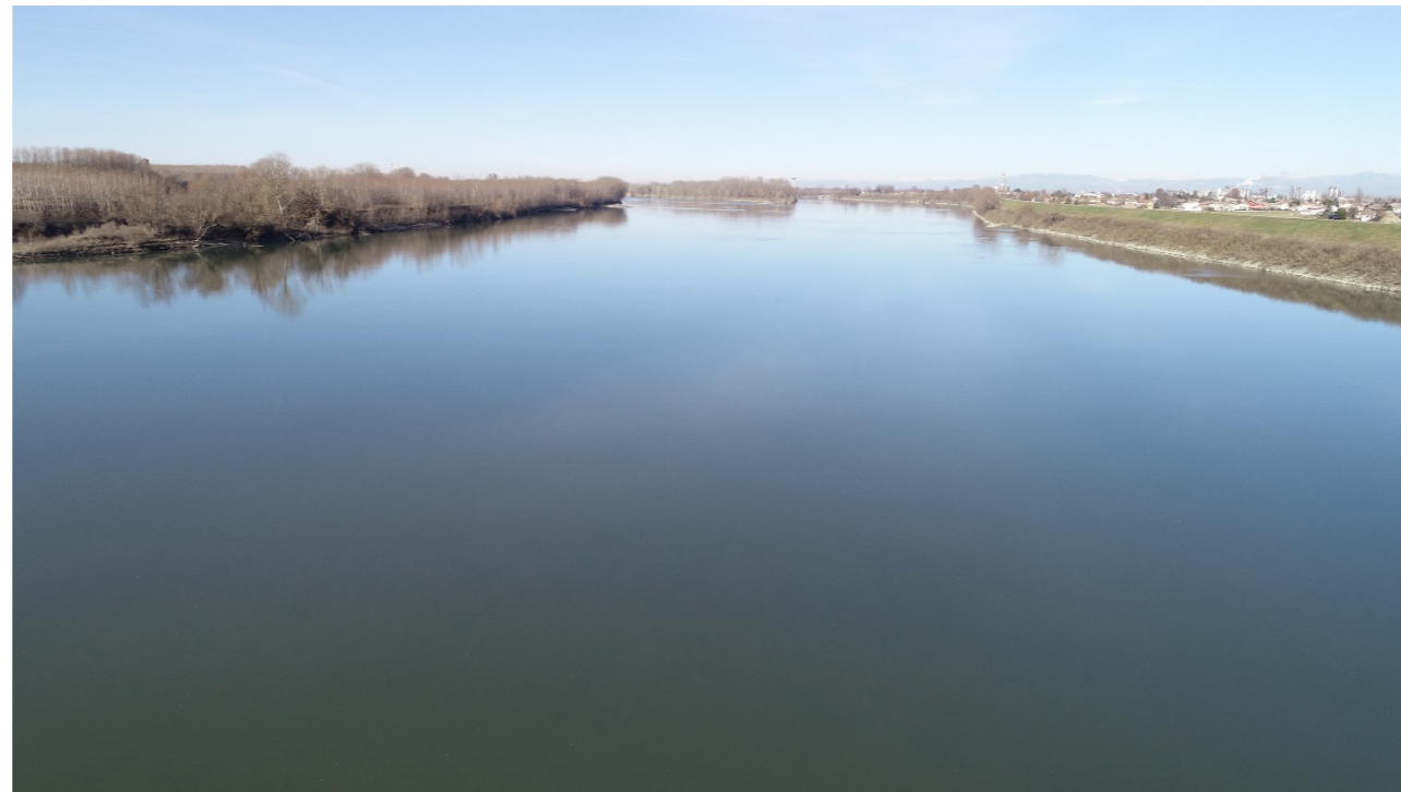
Punto di ripresa n°2