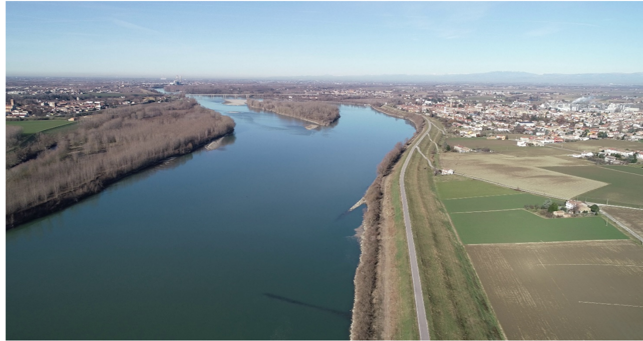
Punto di ripresa n°1