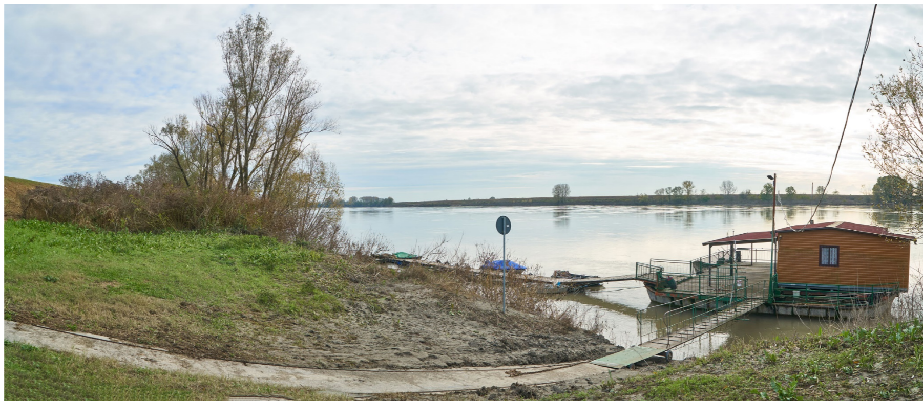
Punto di ripresa n°8 - vista dell'area di intervento del Gruppo n°10, da una zona interna all'argine sinistro posta in corrispondenza dell'abitato di Gaiba. Si nota la ricca vegetazione ripariale arbustiva ed arborea; nell'area è situato un punto di attracco su struttura galleggiante.