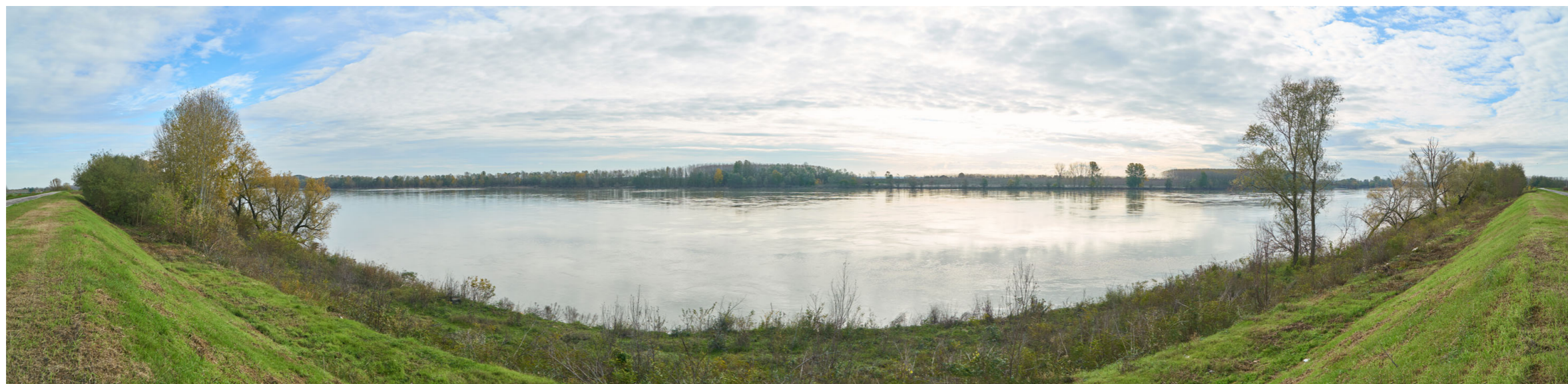
Punto di ripresa n°9 - vista del Fiume Po, dall'argine maestro in sponda sinistra, nel tratto tra i centri abitati di Ficarolo e di Gaiba. La struttura arginale e le caratteristiche vegetazionali sono simili alle situazioni già presentate nelle foto precedenti. Sulla sponda opposta del fiume si nota l'area golenale del Comune di Bondeno, che presenta zone coltivate a pioppeto e zone con macchie a bosco. L'area di intervento del Gruppo n°9 sarà situata di fronte a queste ultime aree golenali.