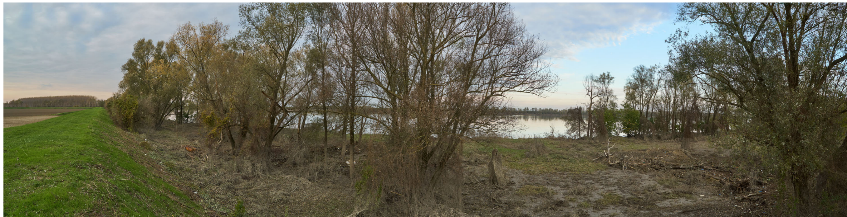
Punto di ripresa n°21 - vista dell'area di intervento del Gruppo n°6, dall'argine maestro del Po, in sponda destra. Si evidenzia l'area golenale e la presenza di vegetazione spontanea ripariale, arbustiva ed arborea.