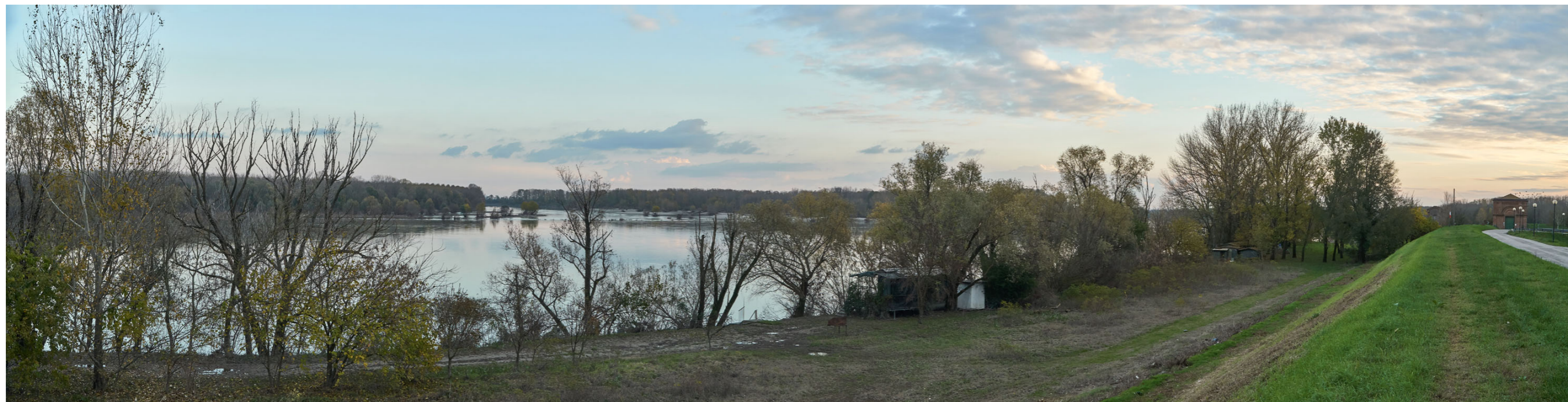
Punto di ripresa n°25 - vista del Fiume Po, dall'argine maestro in sponda destra, verso la sponda veneta. Su quest'ultima è situata l'area di intervento del Gruppo n°8, collocata sul bordo di una lanca, tra la struttura arginale e l'isola della Tontola. La ripresa mostra in primo piano la zona golenale in sponda destra con vegetazione ripariale e diverse strutture galleggianti, su questa sponda non sono previsti interventi. In sponda sinistra si notano: sulla sinistra l'argine maestro ricco di vegetazione arborea, al centro la parte convessa dell'ansa di Ficarolo con la lanca parzialmente sommersa; sulla destra una parte l'isola della Tontola parzialmente sommersa con vegetazione ripariale ed arborea.