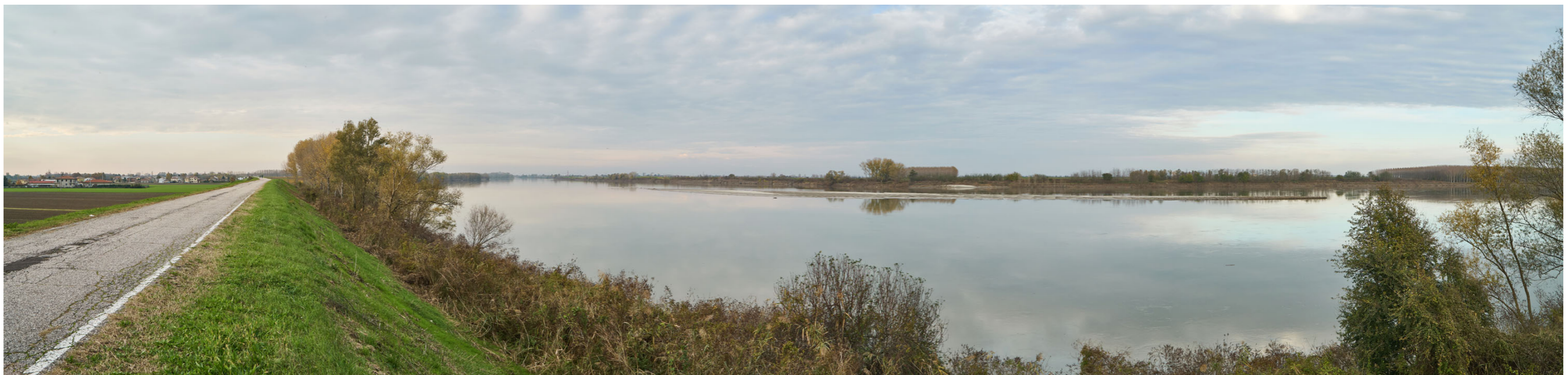
Punto di ripresa n°19 - vista dell'area di intervento del Gruppo n°3, dall'argine maestro del Po, in sponda destra. Si notano la struttura arginale con vegetazione prativa, la fascia sul bordo con una ricca vegetazione ripariale arbustiva e sporadiche alberature. Nonostante il livello dell'acqua particolarmente alto si nota la presenza di ampie zone sabbiose (sabbioni) parzialmente emerse nel greto del fiume.