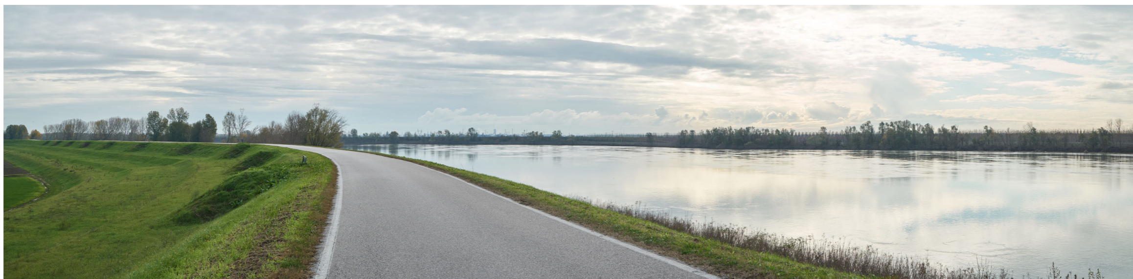
Punto di ripresa n°4 - vista dall'area di intervento del Gruppo n°14 verso valle. L'area presenta verso il fiume una scarpata dell'argine inerbita ed una stretta fascia con una ricca vegetazione ripariale. Nella foto si notano inoltre l'imponente struttura arginale con sezione complessa e l'alveo pensile del Fiume Po.