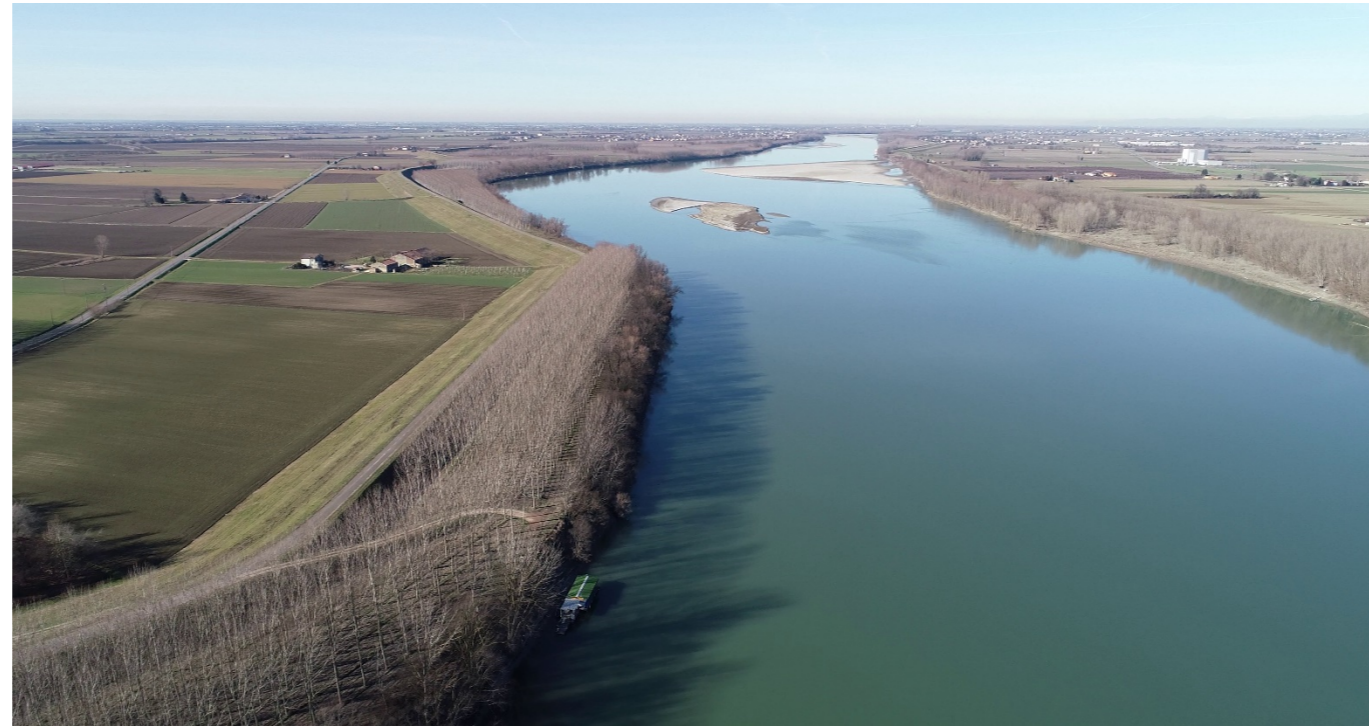
Punto di ripresa n°4