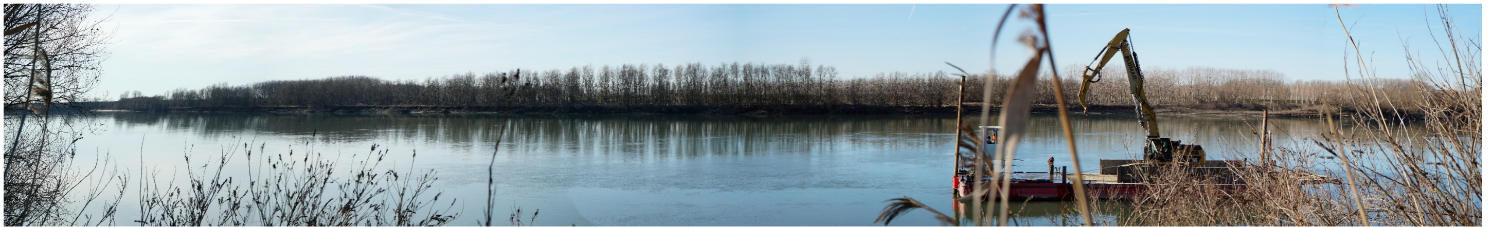
Punto di ripresa n°3