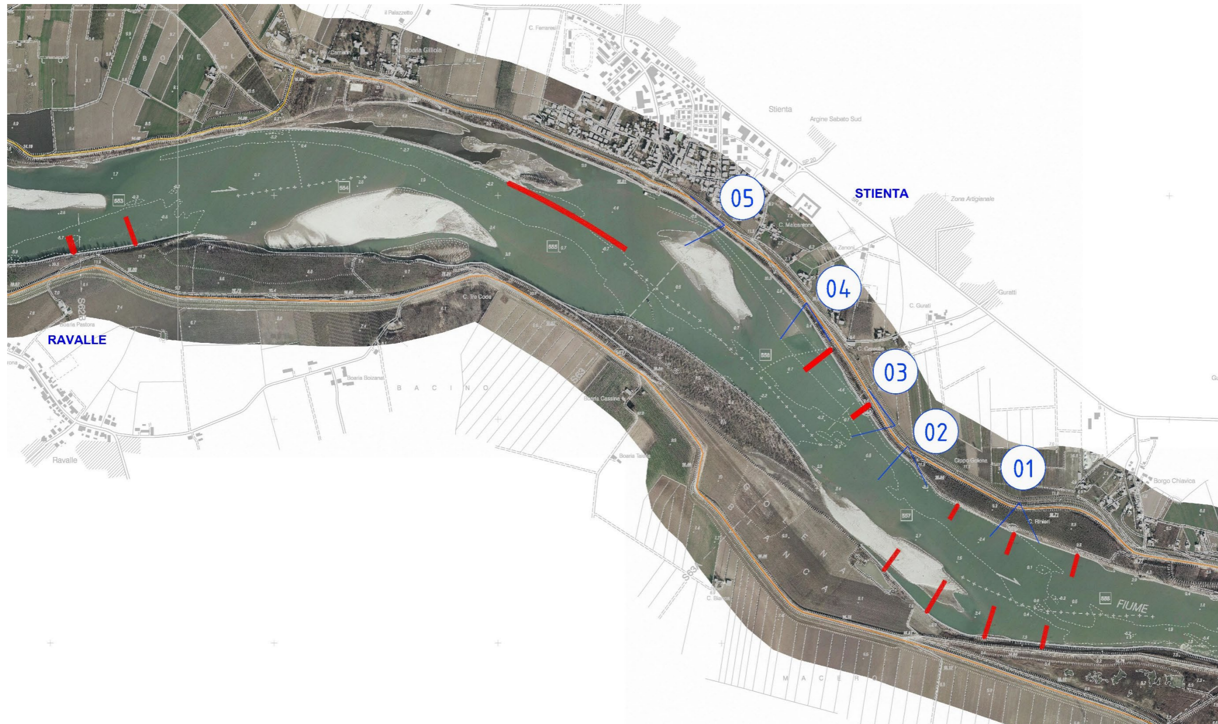
ESTRATTO DELLA CARTOGRAFIA DEI PUTNI DI RIPRESA FOTOGRAFICA: TRATTO RAVALLE-STIENTA