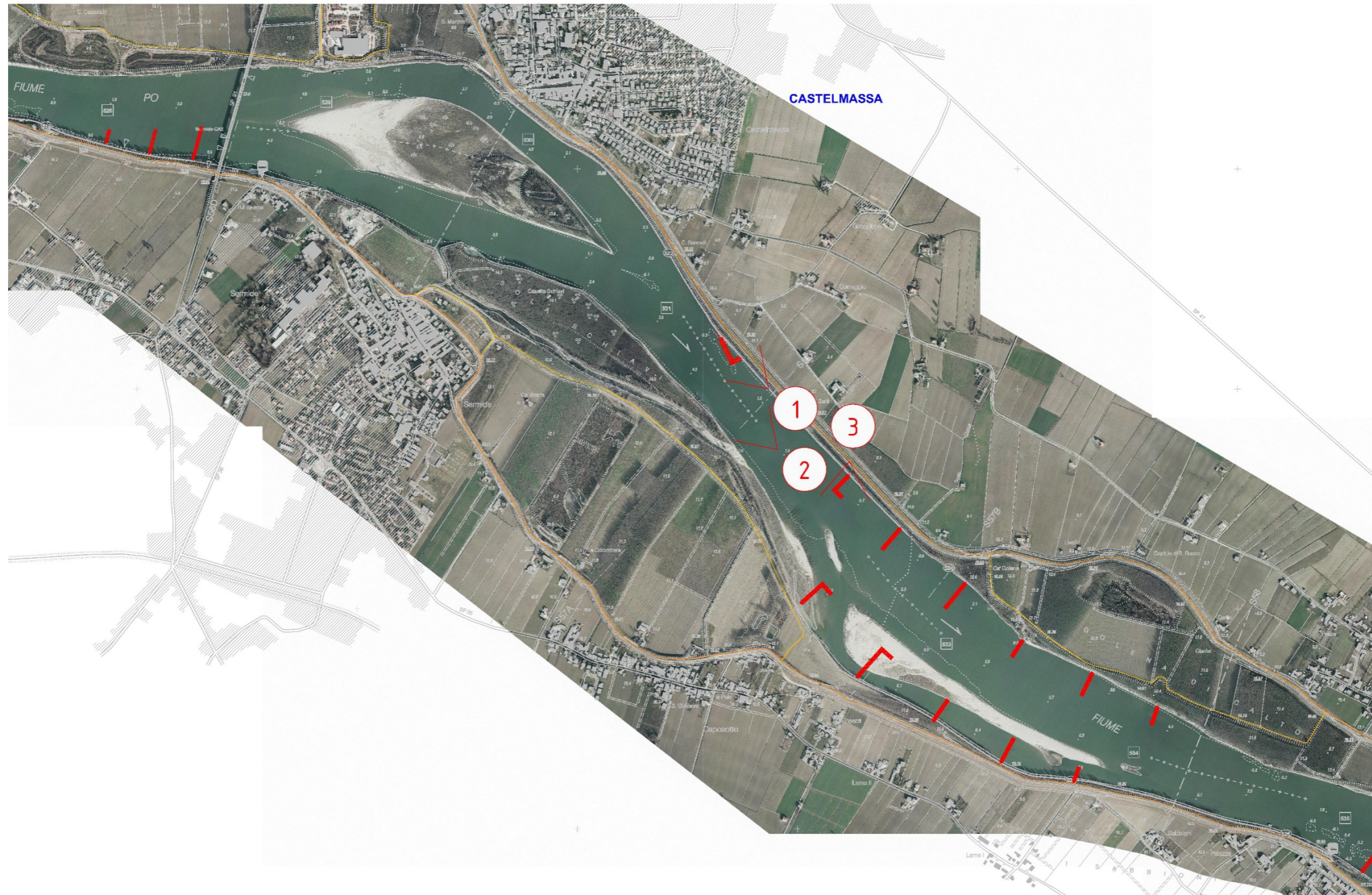
ESTRATTO DELLA CARTOGRAFIA DEI PUTNI DI RIPRESA FOTOGRAFICA: INTERVENTI N°2 e N°3 – RIPRESE DEL 15.01.2019