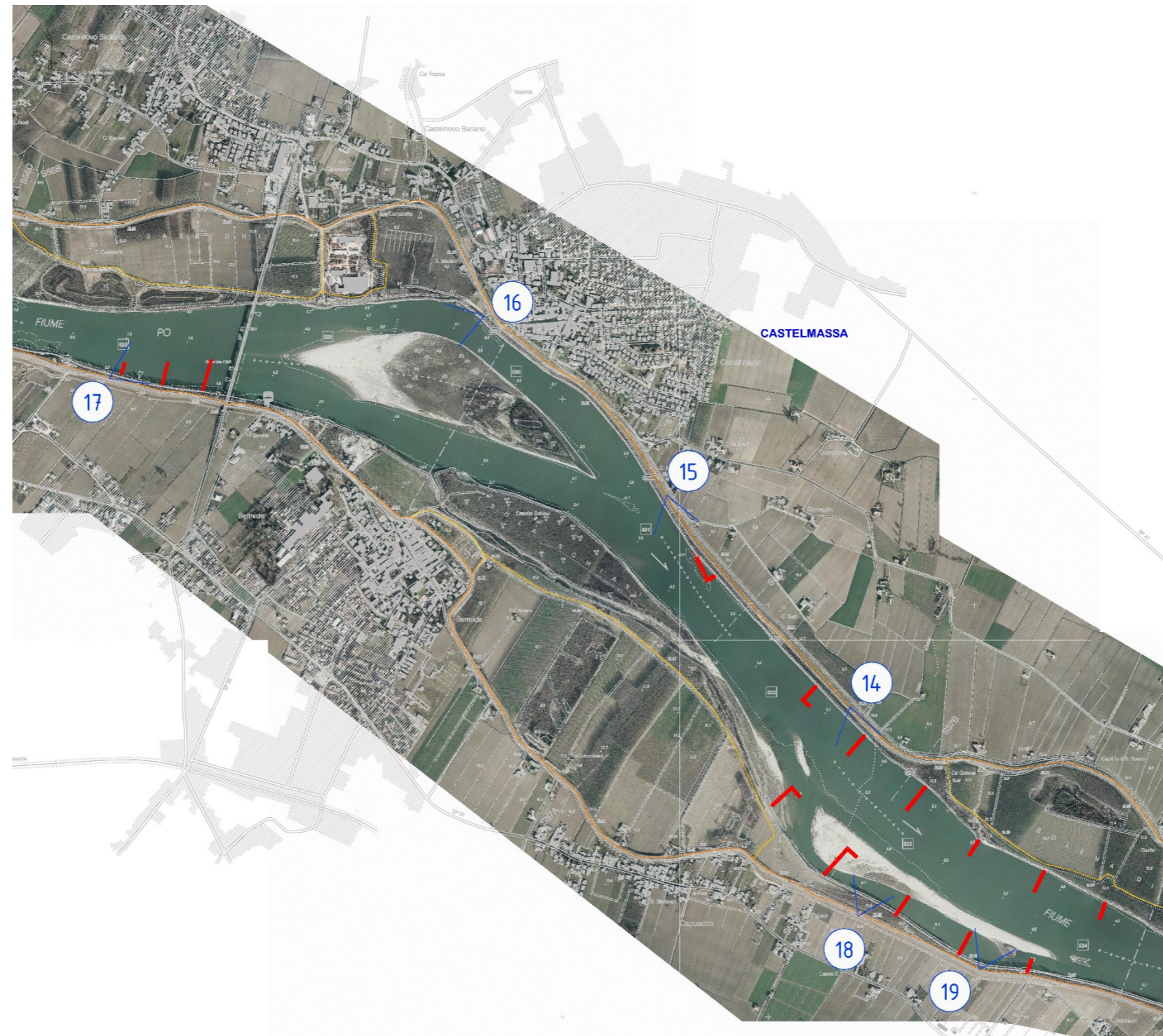
ESTRATTO DELLA CARTOGRAFIA DEI PUTNI DI RIPRESA FOTOGRAFICA: TRATTO CASTELMASSA-FELONICA