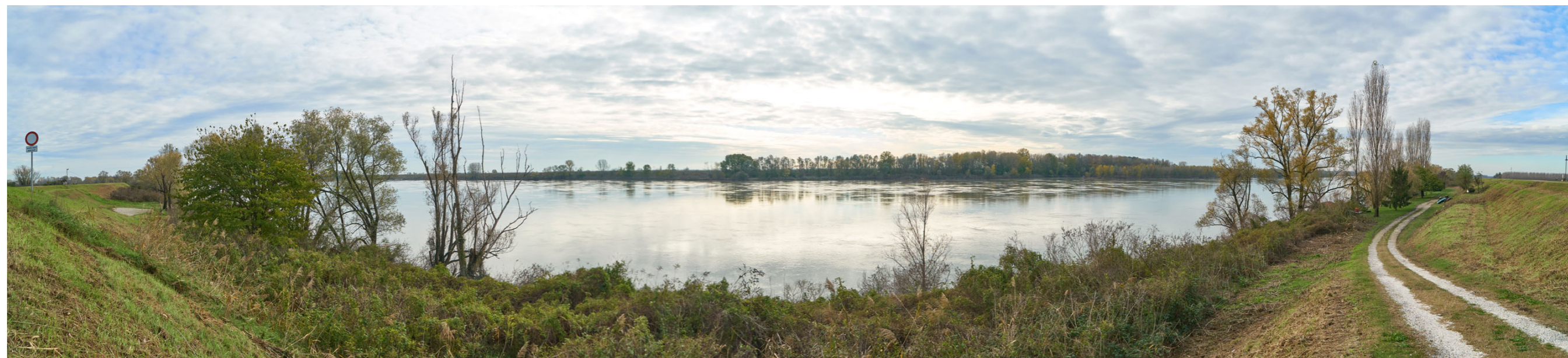
Punto di ripresa n°7 - vista dell'area di intervento del Gruppo n°10, dall'argine maestro del Po, in sponda sinistra.

La foto mostra il paesaggio fluviale dall'argine verso la sponda ferrarese dove dovrà essere realizzato l'intervento del Gruppo n°11; in lontananza si vedono l'argine maestro ferrarese con diverse macchie boschive tra l'argine ed il fiume.