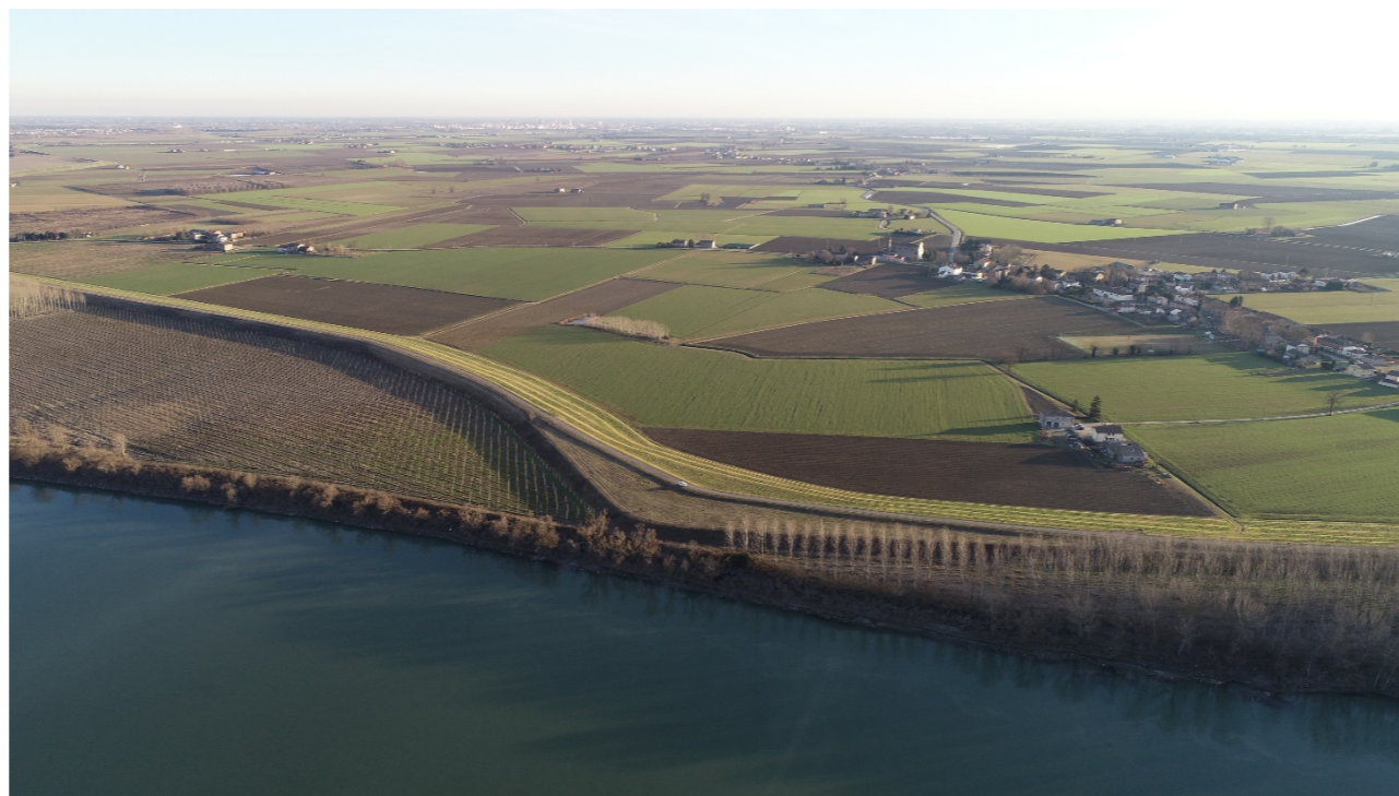
Punto di ripresa n°6