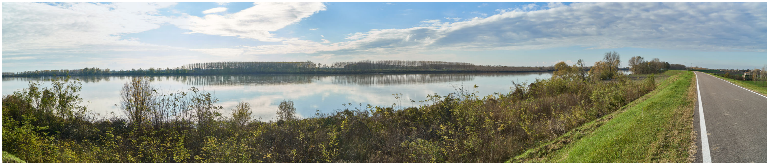
Punto di ripresa n°12 - vista dell'area di intervento del Gruppo n°12, dall'argine maestro del Po, in sponda sinistra. Si nota la struttura arginale con scarpata a vegetazione prativa e la ricca vegetazione ripariale sul bordo del fiume. Sulla riva mantovana si nota l'ampia zona dell'Isola Streggia, in parte coltivata a pioppeto ed in parte ricca di vegetazione spontanea.