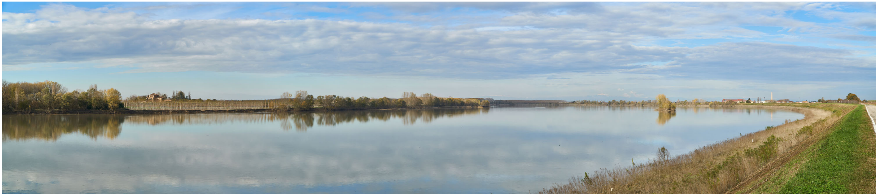
Punto di ripresa n°10 - vista dell'ampia ansa fluviale posta tra Felonica e Ficarolo, dall'argine sinistro del Po. La foto mostra uno scorcio di grande apertura visiva, caratterizzato dal rapporto complesso tra l'azione e le tracce di natura antropica (arginature, insediamenti) e quelle testimoni dell'evoluzione naturale (depositi, colonizzazione). La grande ampiezza del fiume consente di tralasciare l'alveo verso monte, con possibilità di scorci visivi a grande distanza che si possono spingere fino all'arco alpino. Sulla destra, oltre l'argine, si nota un insediamento produttivo nel Comune di Ficarolo. La vegetazione è varia: dalle scarpate dell'argine con vegetazione di tipo prativo, alle fasce di vegetazione ripariale, ai pioppeti e zone a bosco percepibili sulla sponda mantovana, ai sabbioni e alle isole fluviali parzialmente sommerse con specie pioniere o alberi igrofilo.