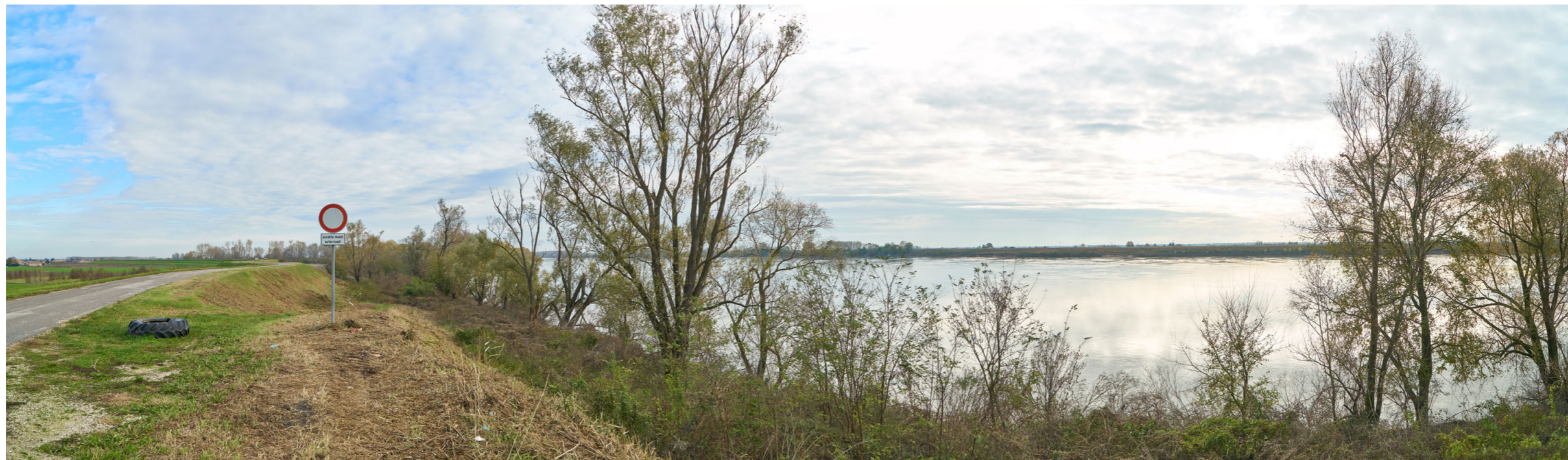
Punto di ripresa n°6 - vista del fiume Po, dall'argine maestro in sponda sinistra, nei pressi dell'abitato di Gaiba.

La foto mostra il paesaggio fluviale dall'argine verso la sponda ferrarese dove dovrà essere realizzato l'intervento del Gruppo n°11; in lontananza si vedono l'argine maestro ferrarese con diverse macchie boschive tra l'argine ed il fiume.