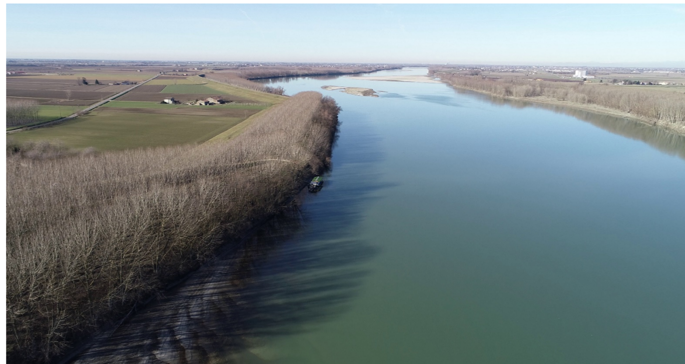
Punto di ripresa n°5