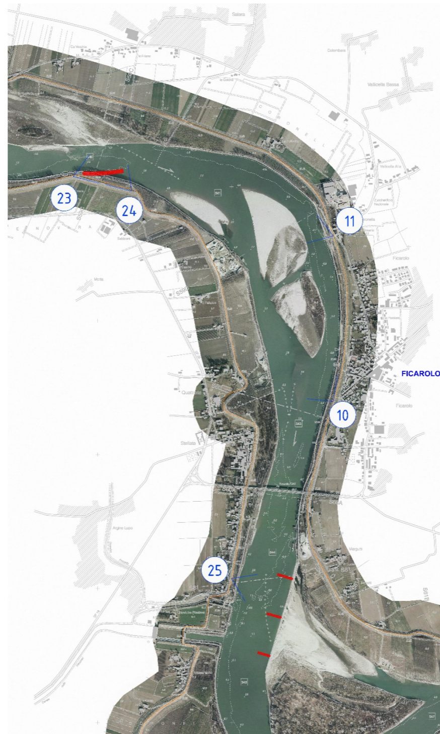
ESTRATTO DELLA CARTOGRAFIA DEI PUTNI DI RIPRESA FOTOGRAFICA: TRATTO FICAROLO-GAIBA