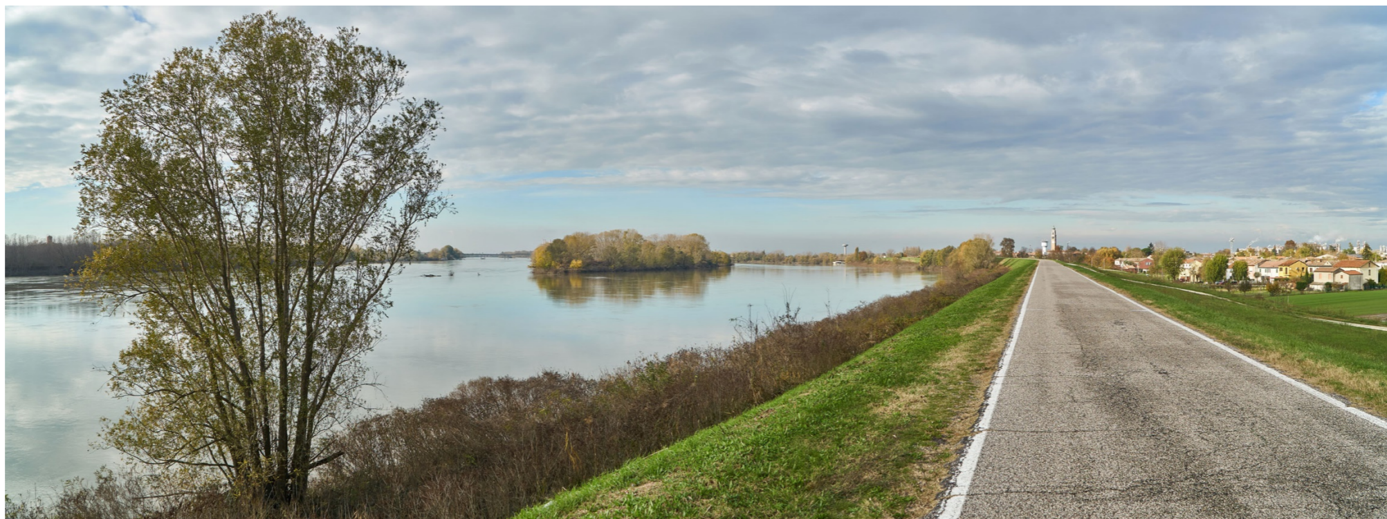
Punto di ripresa n°16 - viste del Fiume Po, dall'argine maestro in sponda sinistra, nei pressi del centro abitato di Castelmassa. Nella foto si nota: la struttura arginale con vegetazione prativa; la sponda fluviale con ricca vegetazione ripariale e la presenza di sporadici alberi igrofilo; il centro di Castelmassa in prossimità dell'argine. Si nota inoltre la presenza dell'isola fluviale, posta nel tratto tra Castelmassa e Sermide, ricca di vegetazione arbustiva ed arborea e facente parte del Parco Locale di Interesse Sovracomunale del Gruccione. Le aree inquadrate nell'immagine non sono soggette ad interventi.