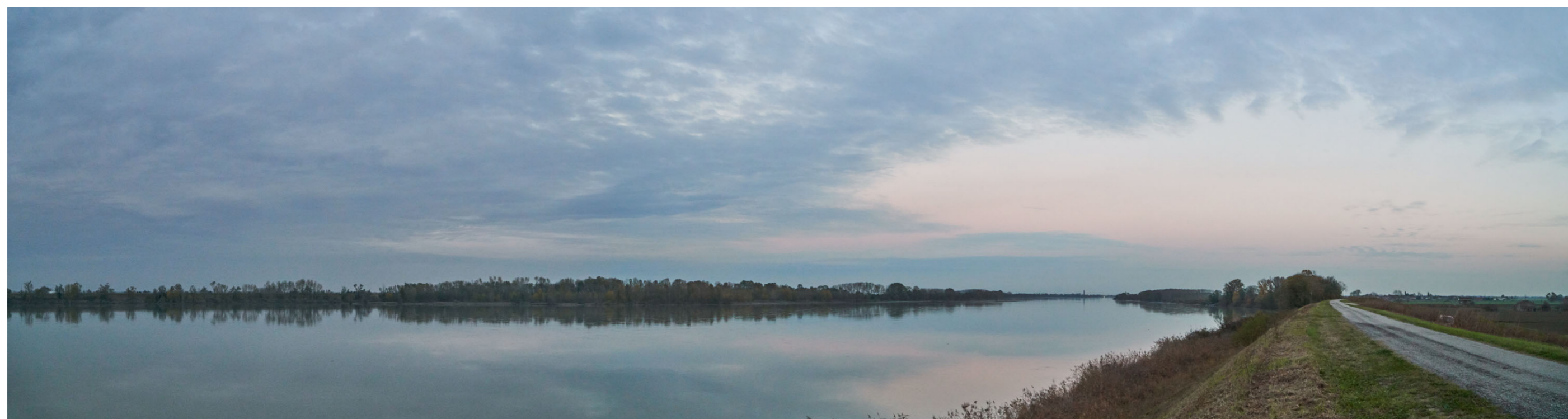
Punto di ripresa n°27 - vista dell'area di intervento del Gruppo n°11, dall'argine maestro del Po, in sponda destra, nei pressi della località Ravalle. Nella foto si nota la struttura arginale con vegetazione prativa e la folta vegetazione ripariale; in lontananza, nei pressi della zona di intervento, è presente una fascia boscosa tra l'argine ed il fiume; questa fascia è identificata dal PSC di Ferrara come "aree boscate".