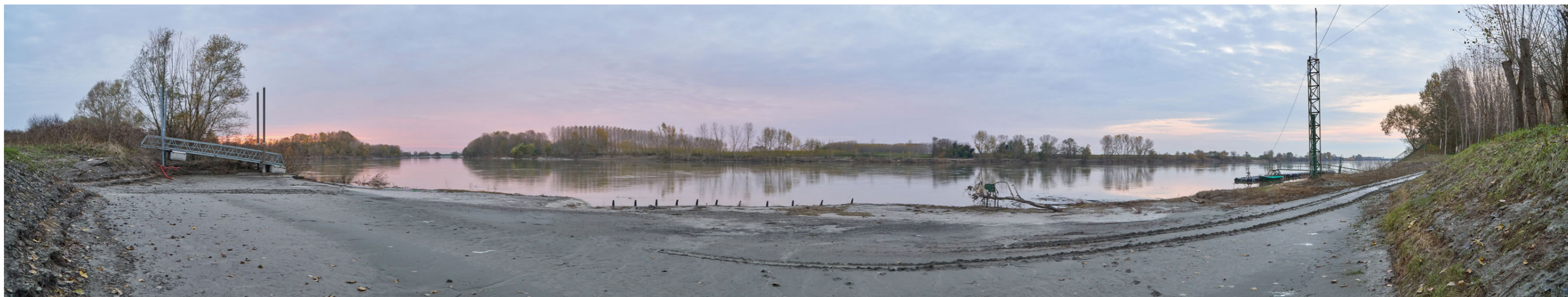
Punto di ripresa n°26 - vista del Fiume Po dalla sponda destra, nei pressi dell'immissione del Cavo napoleonico nel fiume. Si notano in primo piano l'area golenale spoglia di vegetazione con punto di accesso carrabile e due punti di attracco fluviali. Al centro del fiume, sulla sinistra, si nota la folta vegetazione dell'isola della Tontola e l'ampia lanca parzialmente allagata tra l'isola e la sponda veneta.