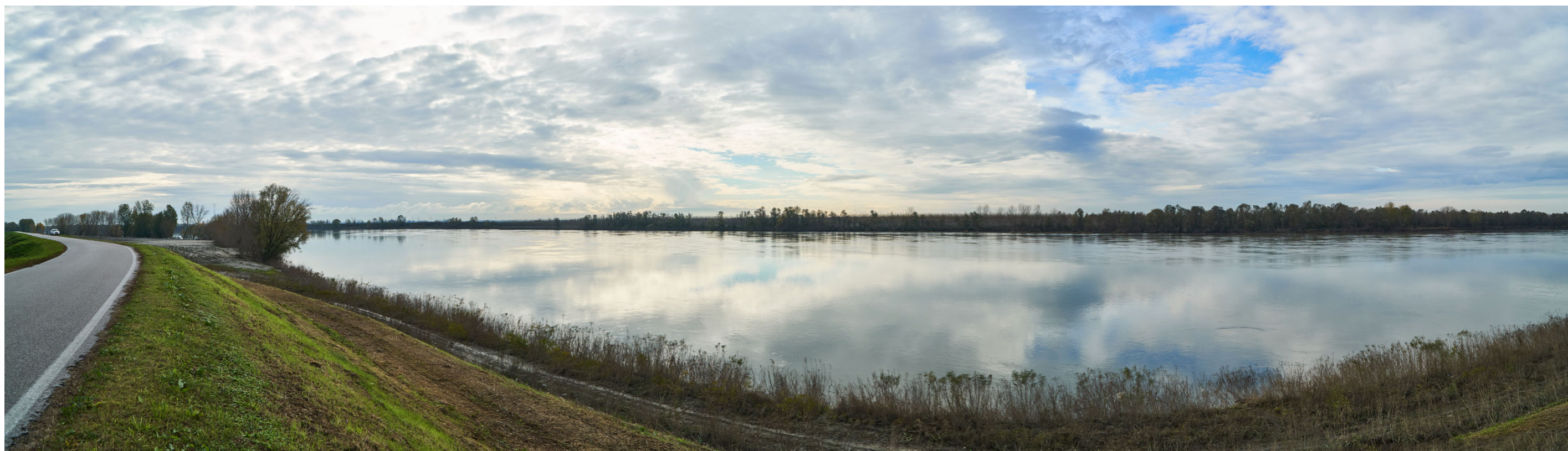
Punto di ripresa n°2 - vista dell'area di intervento del Gruppo n°15, dall'argine maestro del Po, in sponda sinistra. La foto mostra le aree di intervento site nel Comune di Ferrara, sulla sponda opposta, caratterizzata da vegetazione ripariale e da un'estesa area golenale con vegetazione autoctona, già precedentemente citata. Sulla sinistra, l'area di intervento del Gruppo n°15 in località Occhiobello, caratterizzata da vegetazione ripariale.