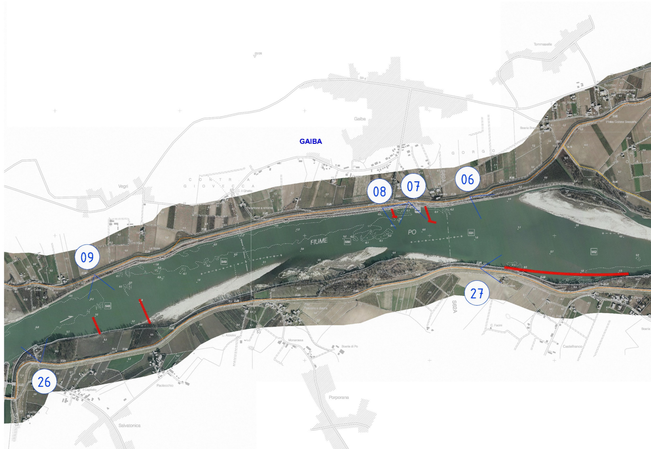
ESTRATTO DELLA CARTOGRAFIA DEI PUTNI DI RIPRESA FOTOGRAFICA: TRATTO GAIBA-RAVALLE