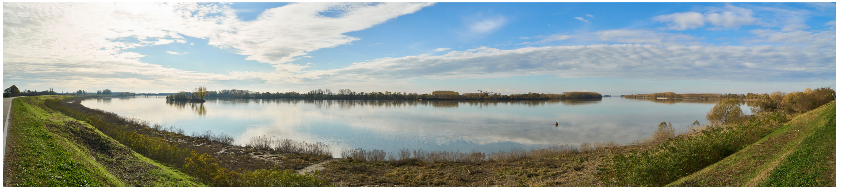
Punto di ripresa n°11 - vista dell'ampia ansa fluviale posta tra Felonica e Ficarolo già citata nelle foto precedenti. In lontananza, sulla sponda mantovana, si nota un'attività di cava ed una zona golenale in parte coltivata a pioppeto ed in parte con una ricca vegetazione spontanea arbustiva e arborea. Su quest'ultima sponda, nella parte convessa dell'ansa, è situata l'area di intervento del Gruppo n°7.