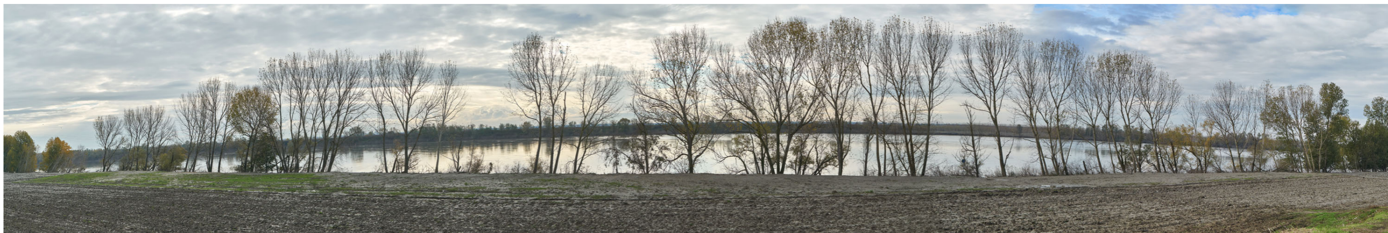
Punto di ripresa n°1 - vista dell'area di intervento del Gruppo n°15, dalla sponda sinistra del Po, nei pressi del Comune di Occhiobello. La foto mostra un'ampia area golenale; verso la sponda si nota la presenza di vegetazione ripariale, in particolar modo arbustiva ed arborea. In secondo piano, sulla sponda ferrarese, si intravede l'argine, con vegetazione ripariale arbustiva ed arborea, a protezione di una vasta area golenale con vegetazione spontanea igrofila; quest'ultima è vincolata dal PSC di Ferrara come "aree boscate".