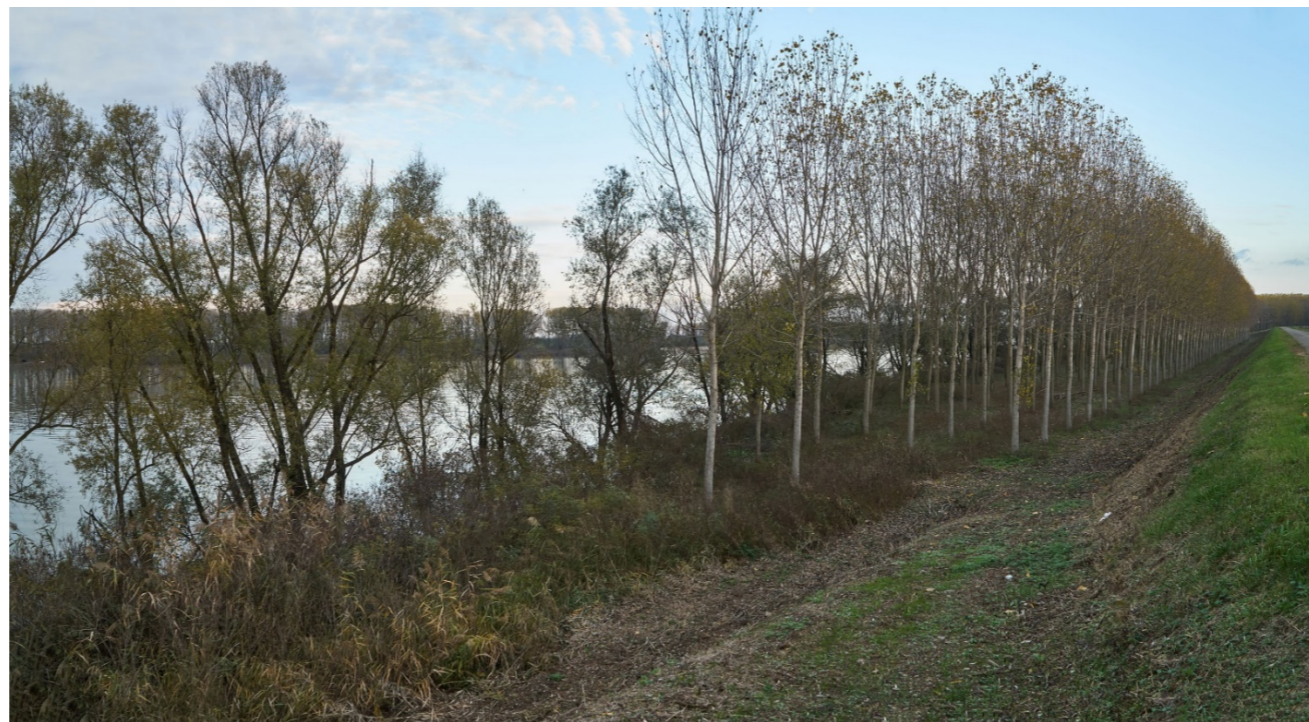
Punto di ripresa n°23 - vista dell'area di intervento del Gruppo n°7, dall'argine maestro del Po, in sponda destra. Si evidenziano: la struttura arginale con rive a vegetazione prativa; l'area golenale coltivata a pioppeto produttivo; la ricca vegetazione ripariale sulla sponda del fiume. Nei pressi del punto di ripresa è presente una discesa all'area golenale.