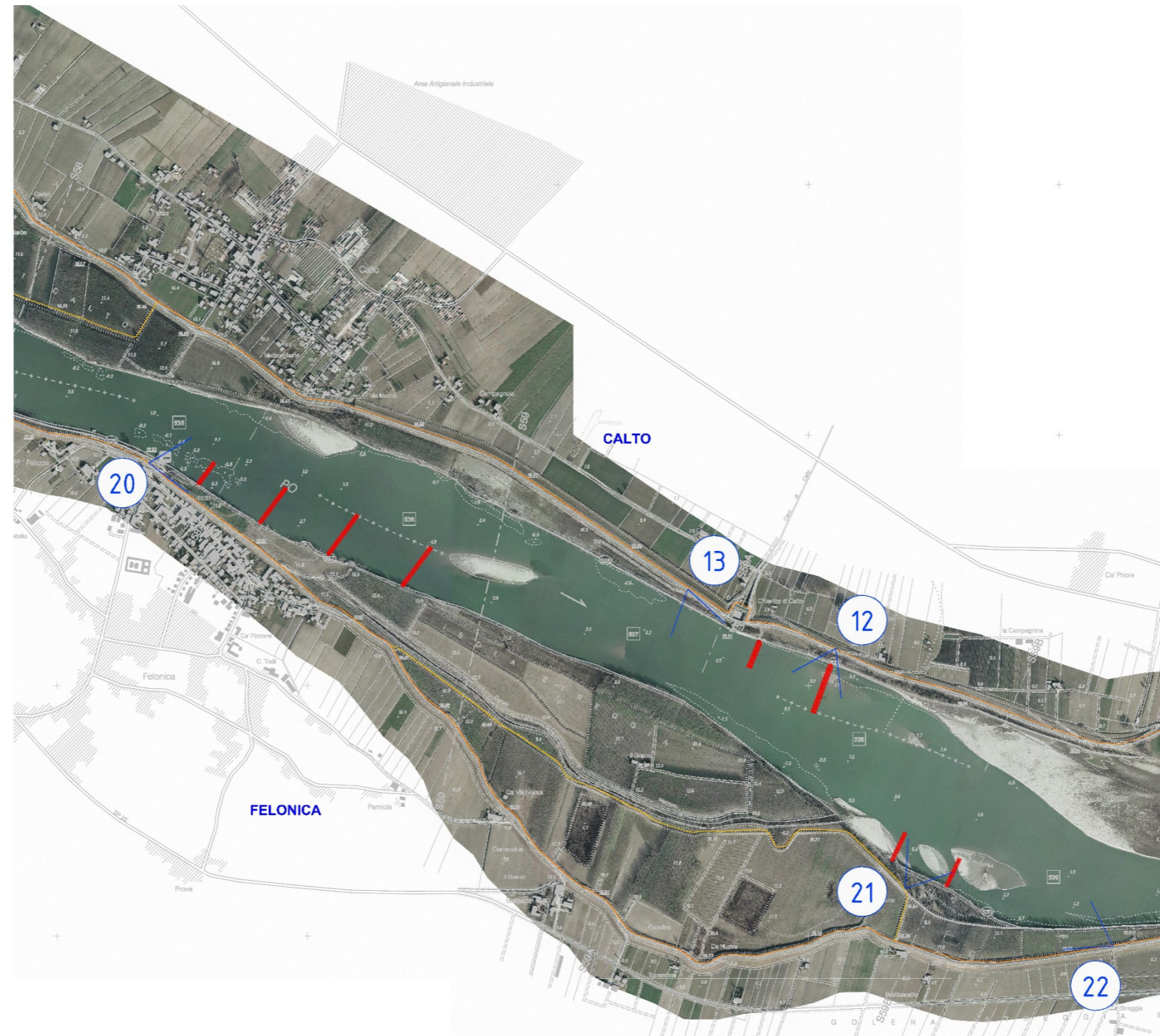
ESTRATTO DELLA CARTOGRAFIA DEI PUTNI DI RIPRESA FOTOGRAFICA: TRATTO FELONICA - FICAROLO