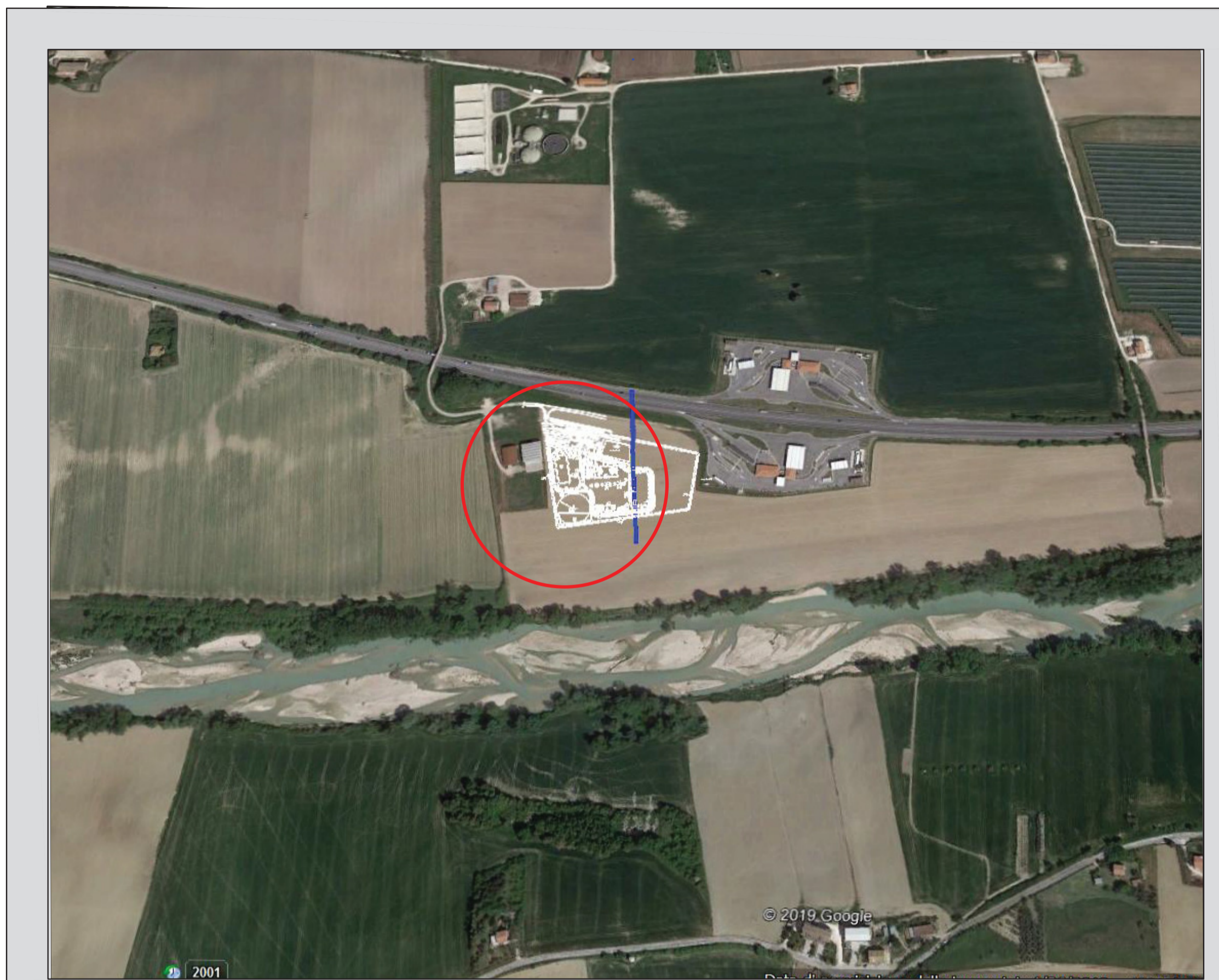
IMMAGINE DAL SATELLITE CON SOVRAPPOSIZIONE STAZIONE DI SPINTA Scala 1:5000