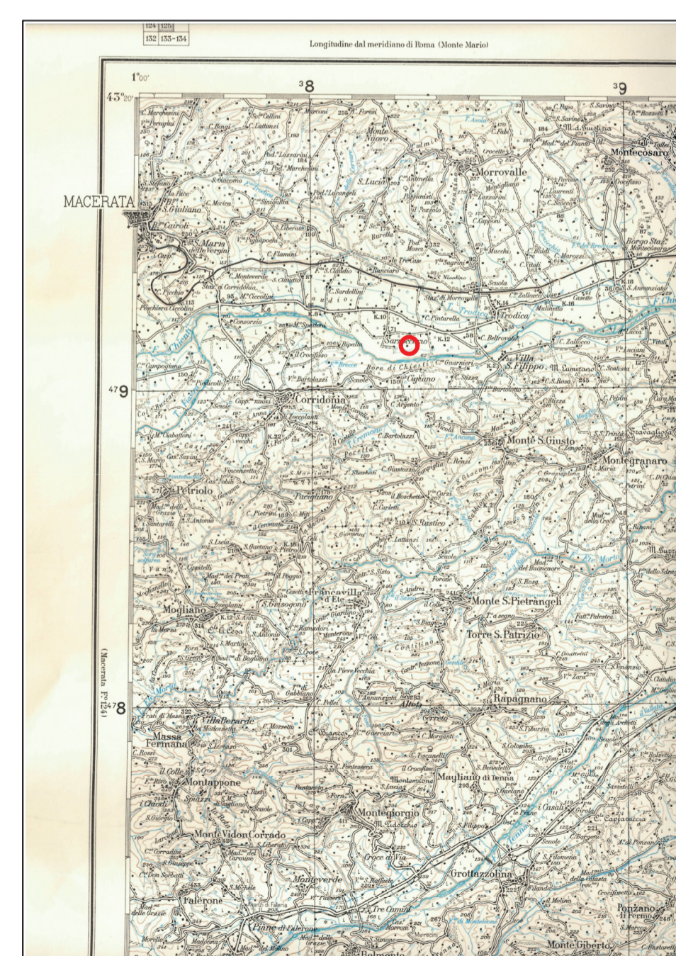
COROGRAFIA Serie: M691 Foglio FERMO 125 Edizione: 5 IGM1 Scala 1:100000