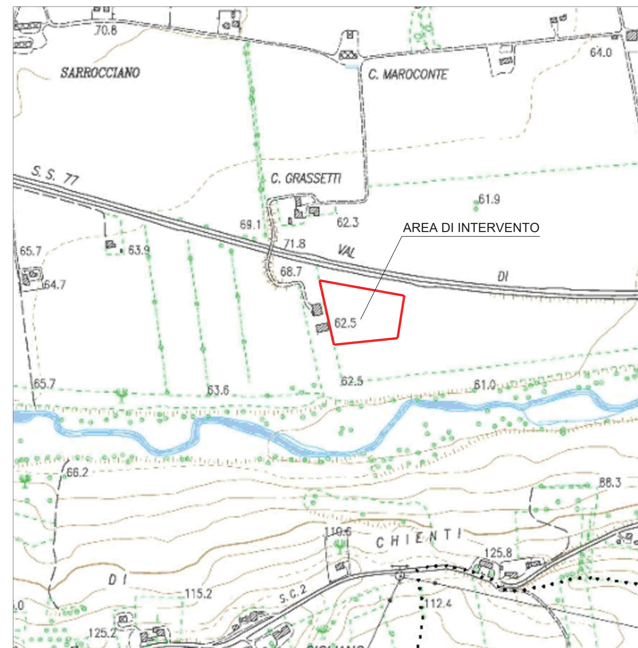
STRALCIO IN SCALA 1:5.000