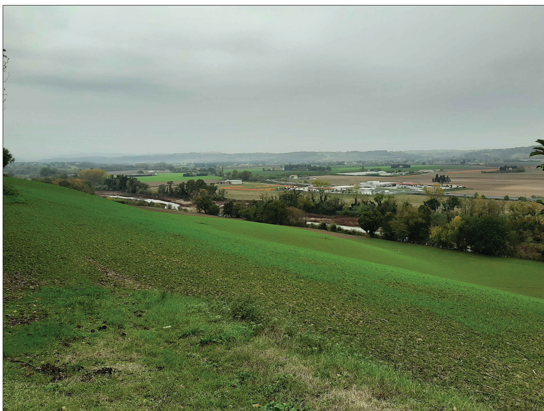
Punto di ripresa P.05