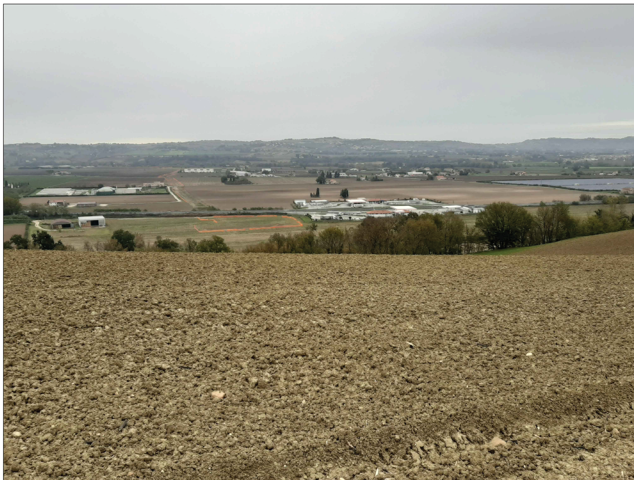
Punto di ripresa P.04