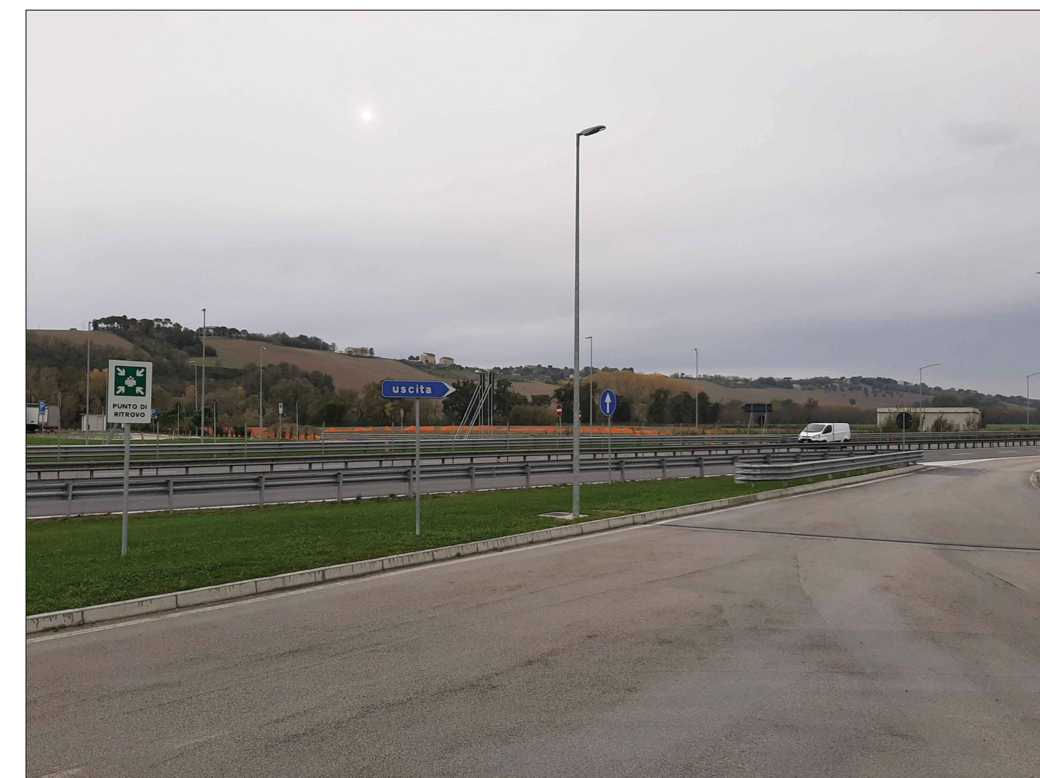
Punto di ripresa P.06