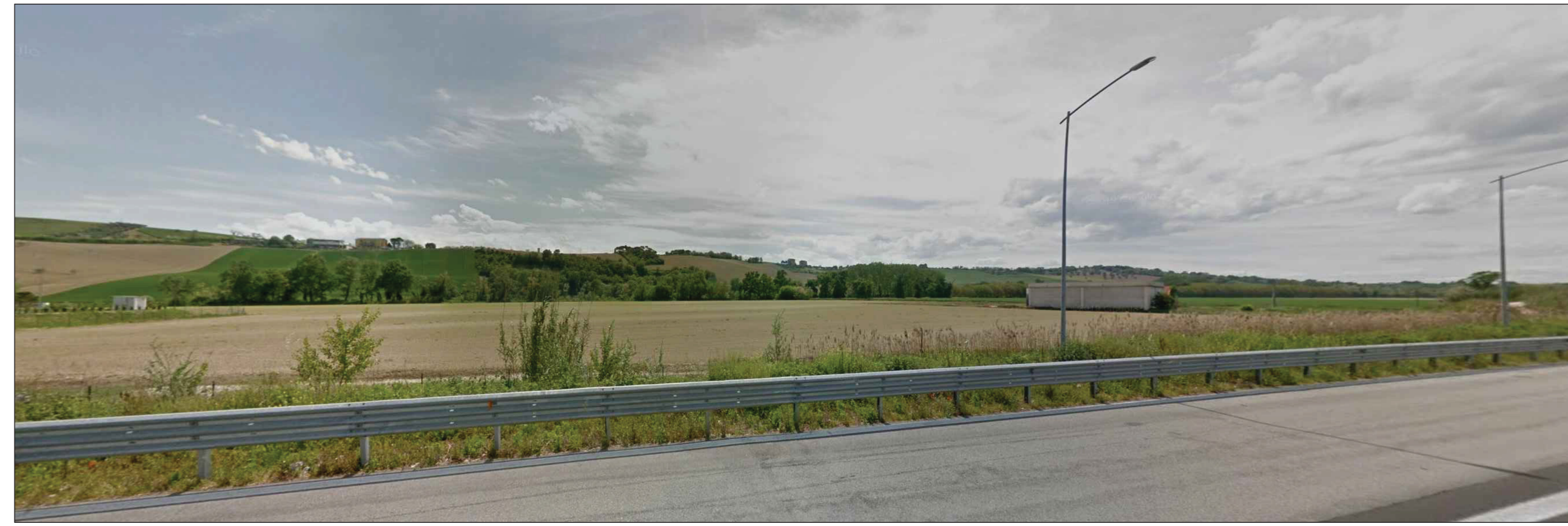
Punto di ripresa P.02