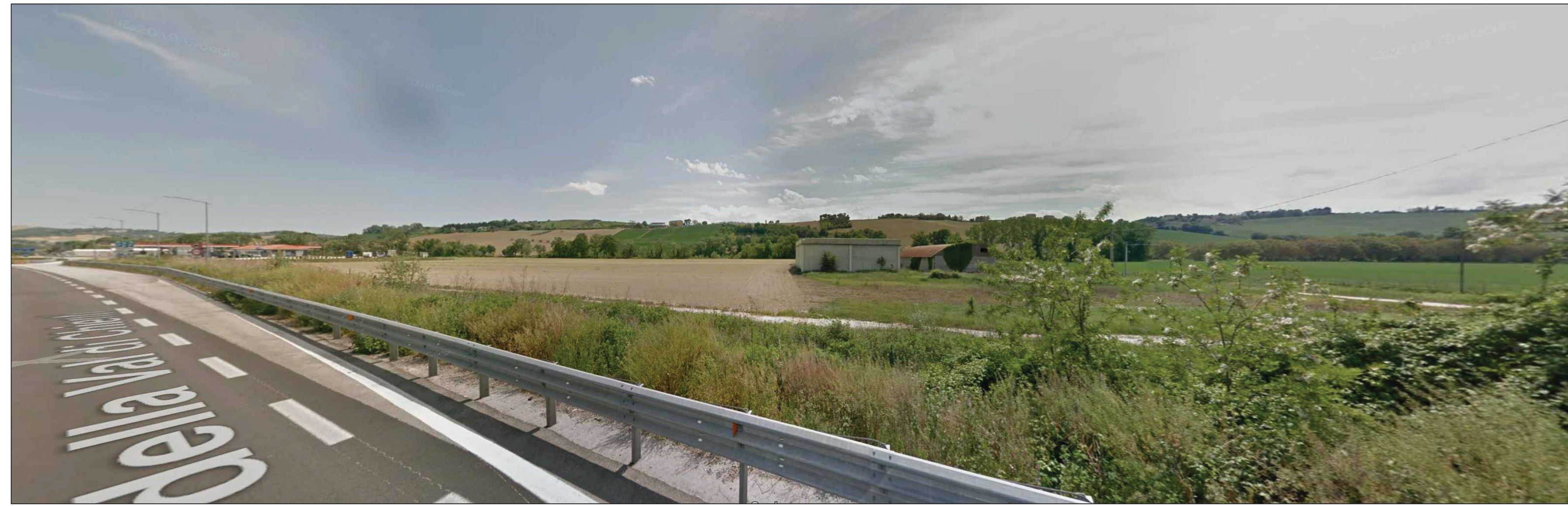
Punto di ripresa P.01