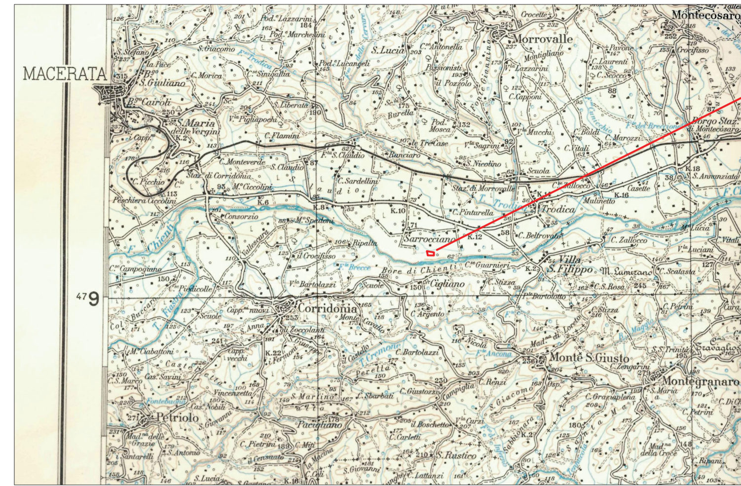
COROGRAFIA Serie: M691 Foglio FERMO 125 Edizione : 5 IGMI SCALA 1:100.000