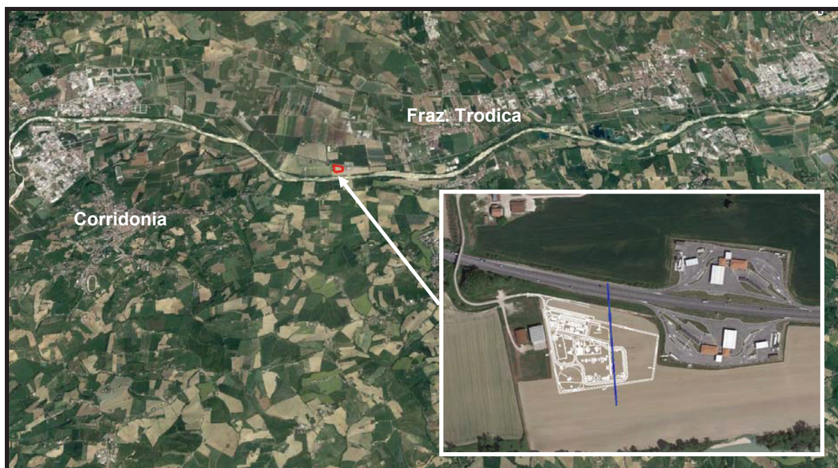
Figura 3-1– Ubicazione opere (sito di progetto in rosso ) con riquadro di dettaglio

Il centro abitato più vicino è la frazione di Trodica, nel comune di Morrovalle (MC), situato circa 2 km a nord-est, il quale si sviluppa attorno alla SP 485.