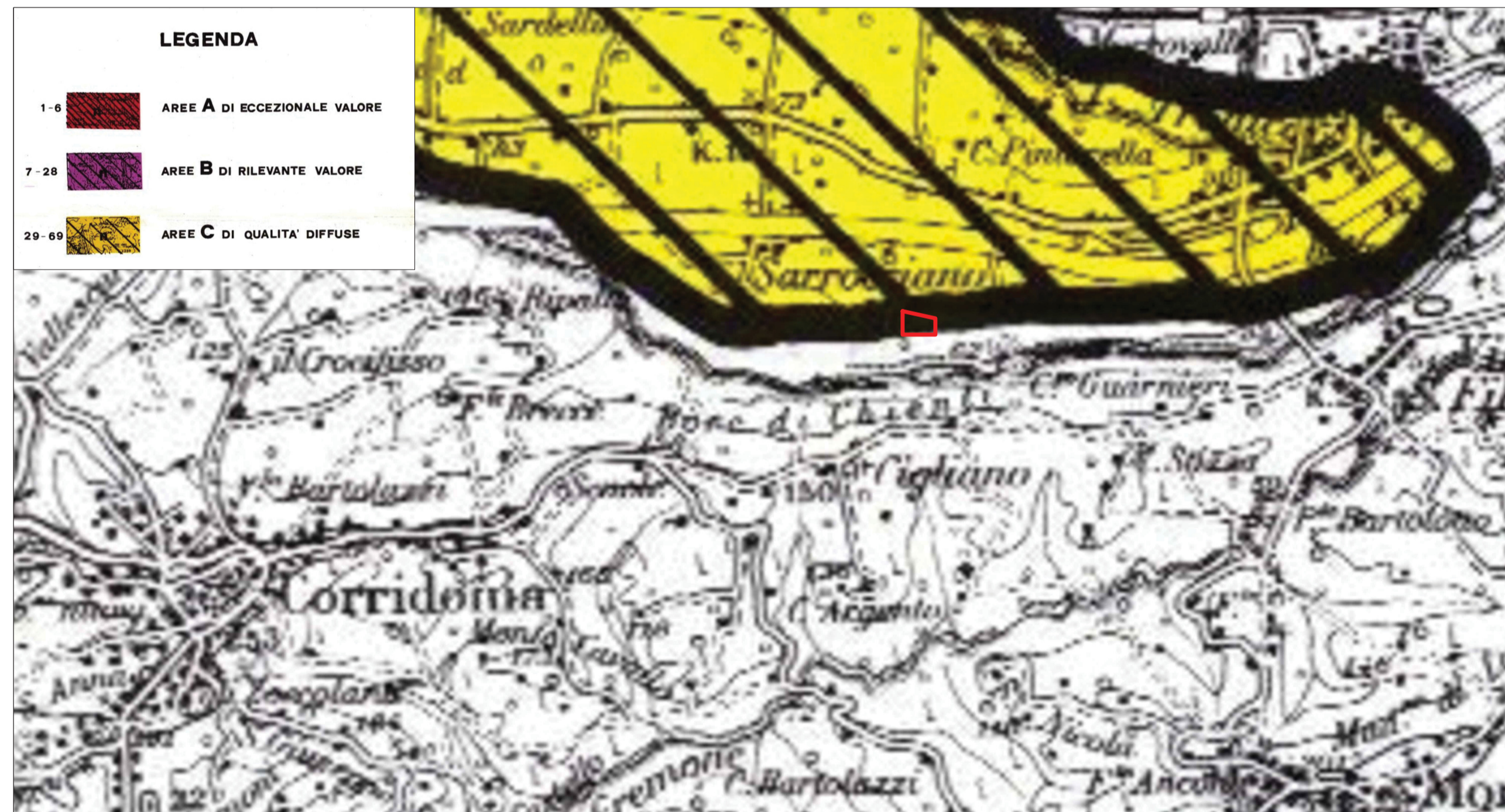
Tav.6) P.P.A.R. vigente, Regione Marche - Sottosistema territoriale generale: Aree per rilevanza dei valori paesaggistici e ambientali (art. 23, Aree C di qualità diffuse) area n. 58, territorio di "Macerata"