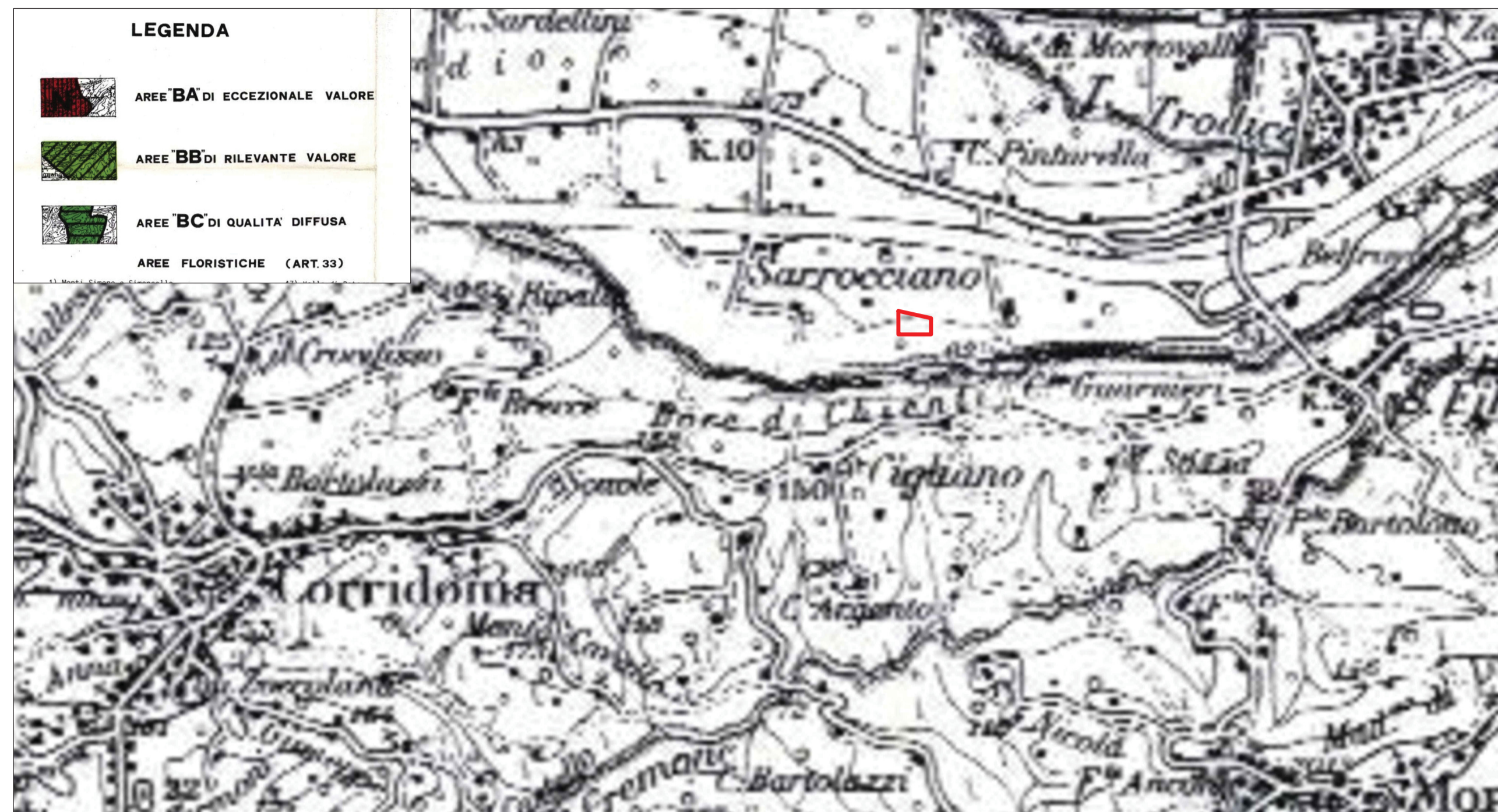
Tav.4) P.P.A.R. vigente, Regione Marche - Sottosistema botanico - vegetazionale: Sottosistemi tematici ed elementi costitutivi del sottosistema botanico-vegetazionale