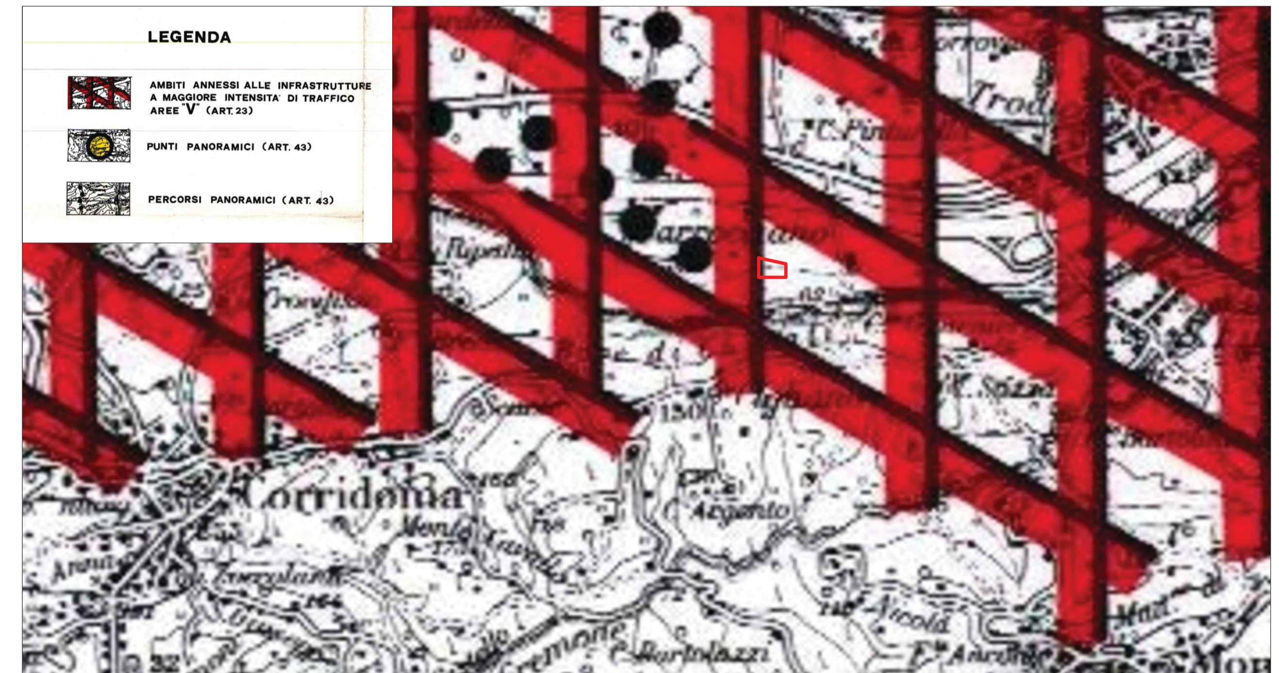
Tav.7) P.P.A.R. vigente, Regione Marche - Sottosistema territoriale generale: Aree di alta percezione visiva (art. 43, Ambiti annessi alle infrastrutture a maggiore intensità di traffico - aree "V")