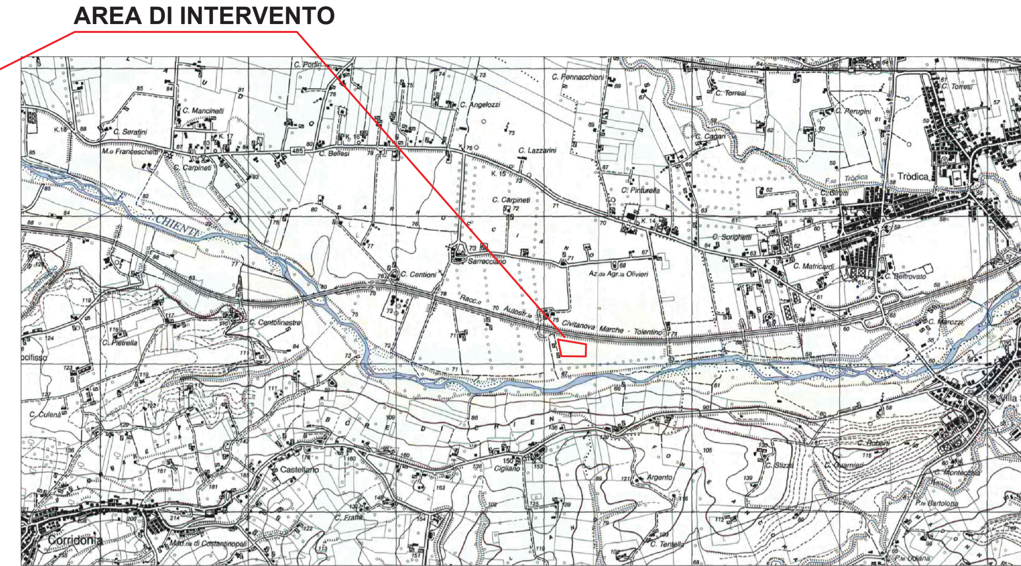
Stralcio CARTA TOPOGRAFICA IGM SCALA 1:25.000 - F° 125 IV N.O. MACERATA Est