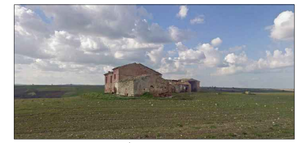
FOTO EDIFICIO F.2 P.lla 43 Col. F/2-unità colabent