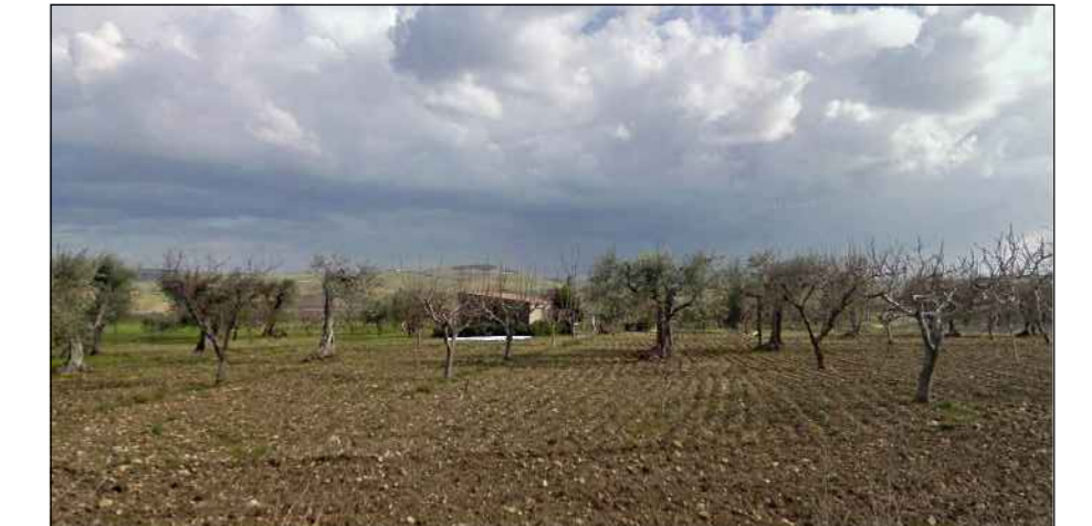
FOTO EDIFICIO F.2 P.lla 37 Col. C/4-stalle scuderie, rimessa, autorimessa