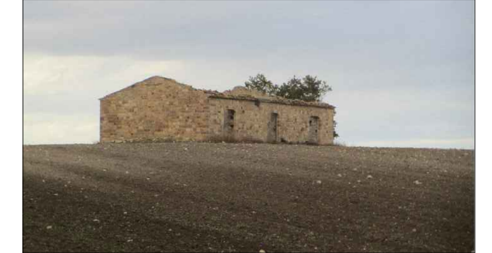
FOTO EDIFICIO F.19 P.lla 22 Col. F/2-unità colabent