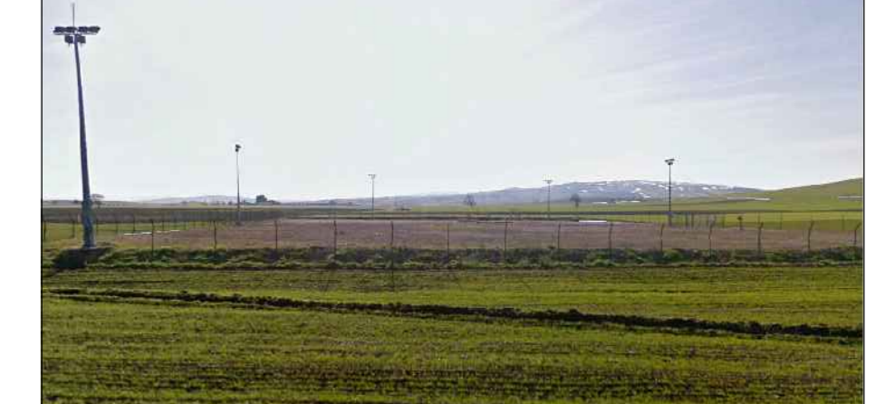
FOTO MANIFATTO F.52 P.lla 42 Col. D/1-uffici