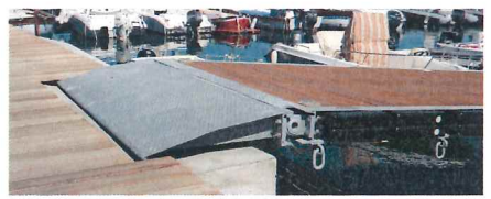
particolare attacco a terra