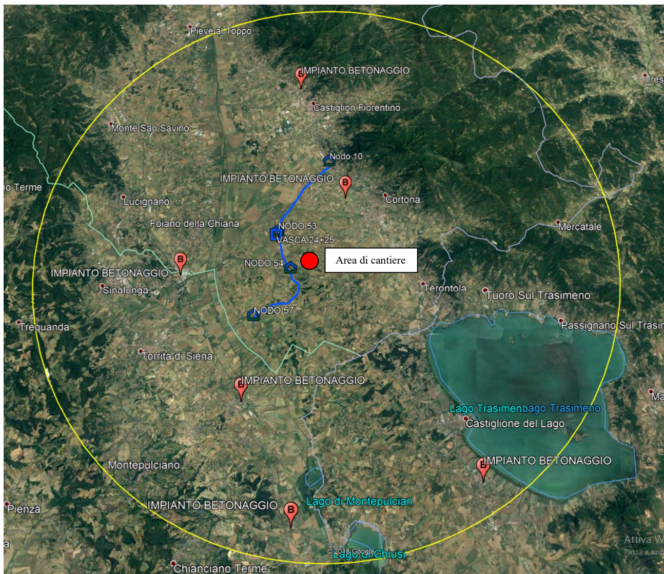
Figura 2 - Centrali di betonaggio nel raggio di 20km

Riguardo l'indicazione di centri di betonaggio in un'area relativamente vicina all'impianto del cantiere, si segnala la presenza nei territori dei comuni di Arezzo, Cortona e Castiglion Fiorentino (AR); Torrita, Rapolano E Chiusi (SI); Castiglion del Lago (PG), con distanza massima dal sito del cantiere di 20km.