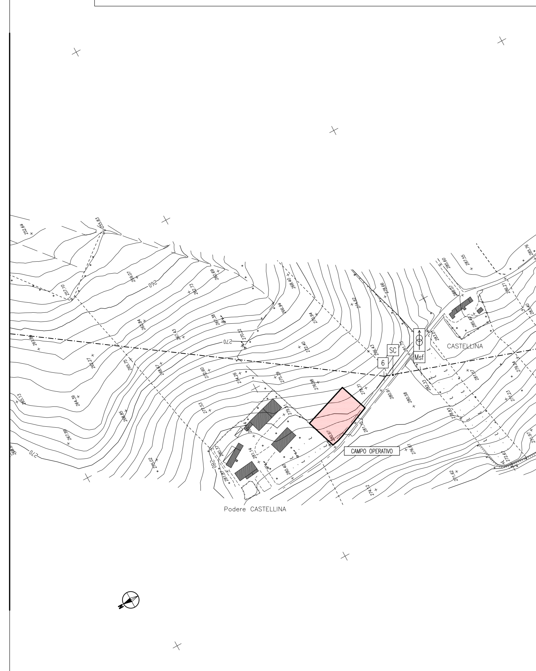
INQUADRAMENTO PLANIMETRICO - scala 1:2.500