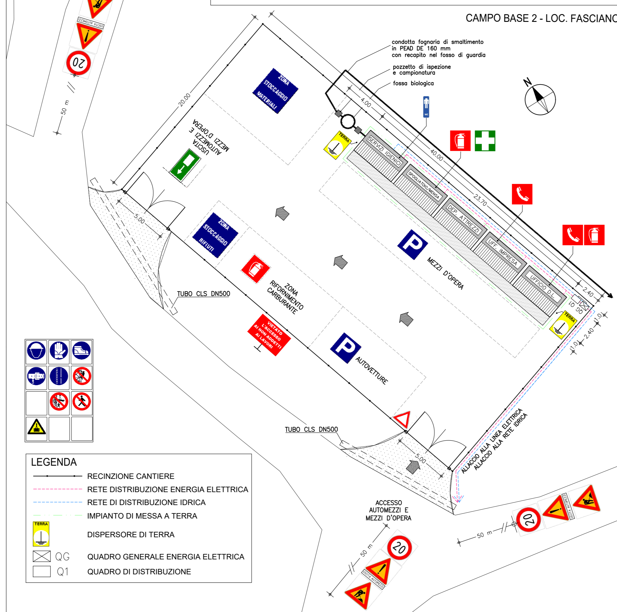
AREA DEGLI APPRESTAMENTI FISSI DI CANTIERE - scala 1:200