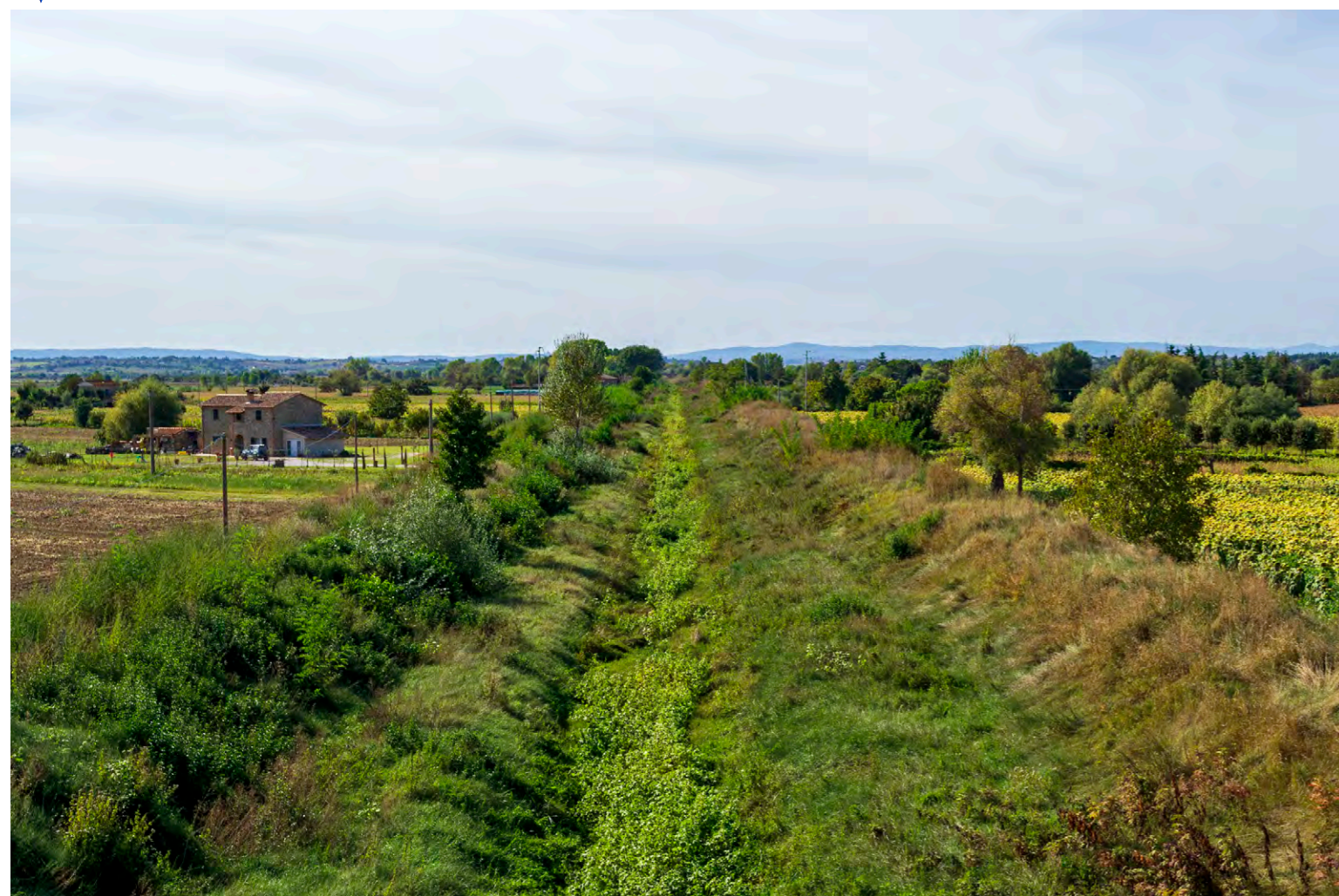
note Vista dell'area di intervento in località Chiassaie, attraversamento torrente Esse.