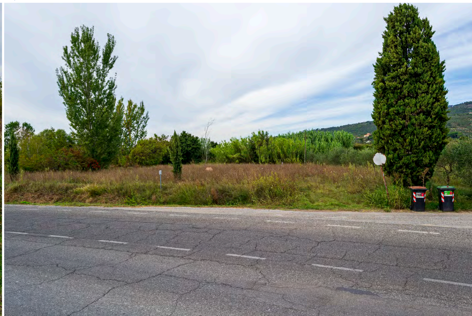
note Vista dell'area di intervento in località Sant'Eusebio, punto di inserimento del nodo di sezionamento 26B.