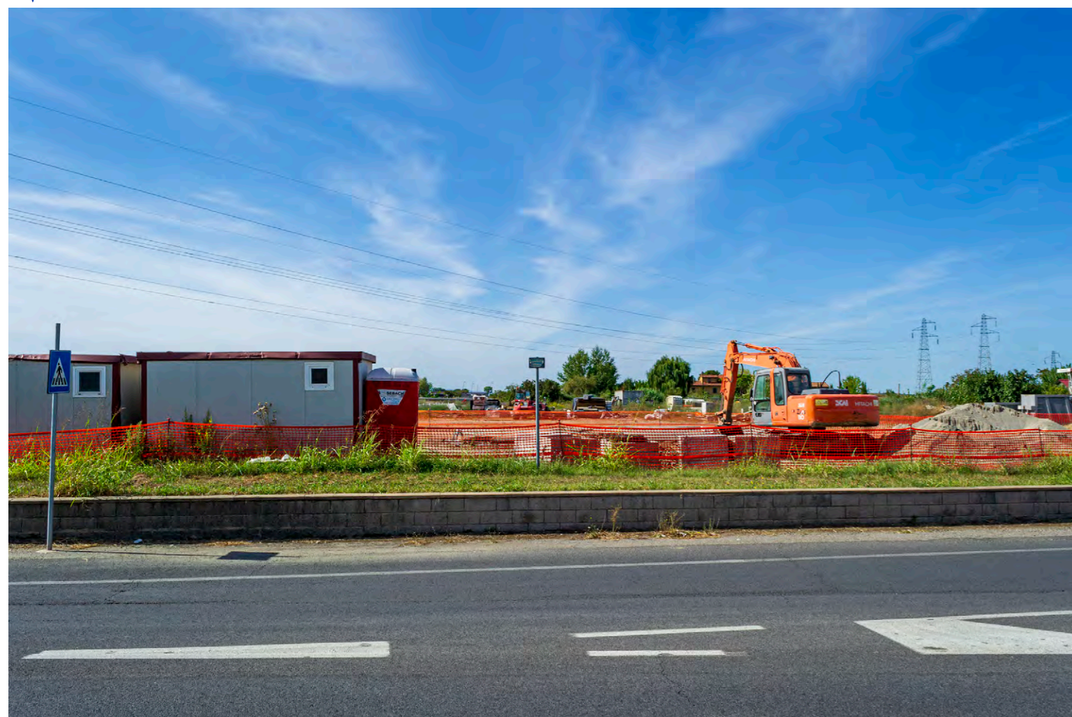
note Vista dell'area di intervento nel punto di attraversamento della Strada Provinciale Lauretana.