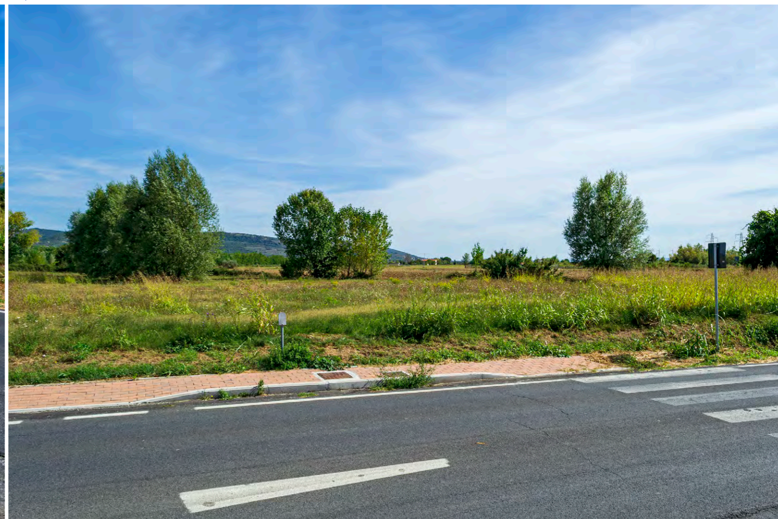
note Vista dell'area di intervento nel punto di attraversamento della Strada Provinciale Lauretana.