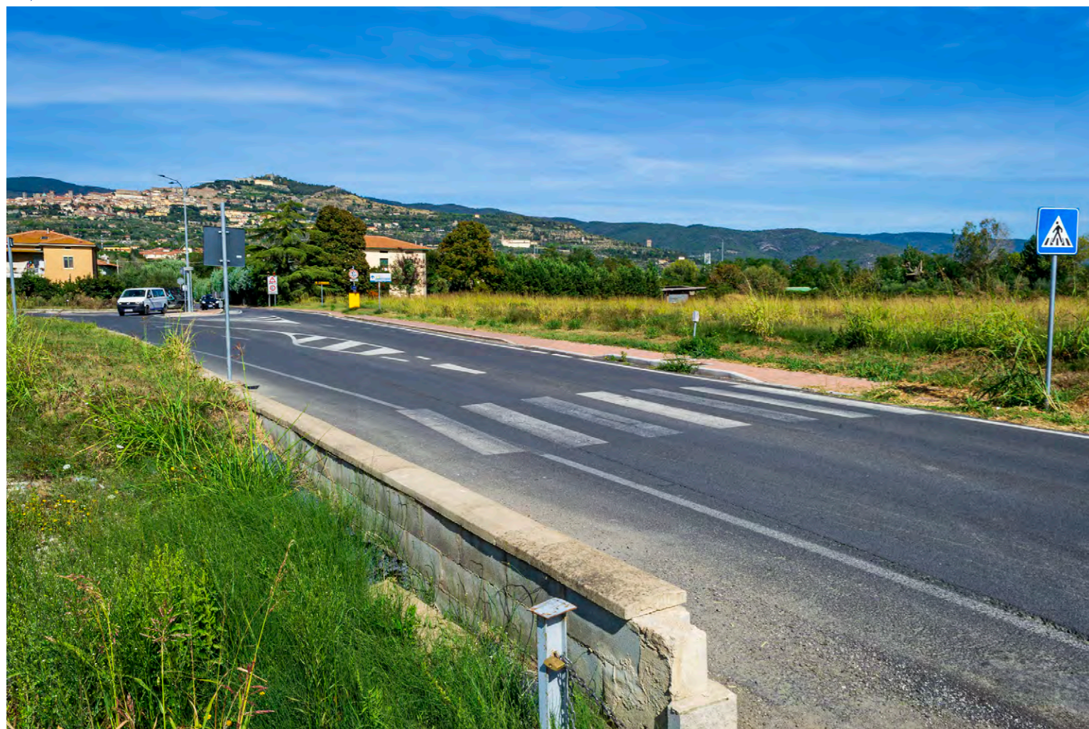
note Vista dell'area di intervento nel punto di attraversamento della Strada Provinciale Lauretana.