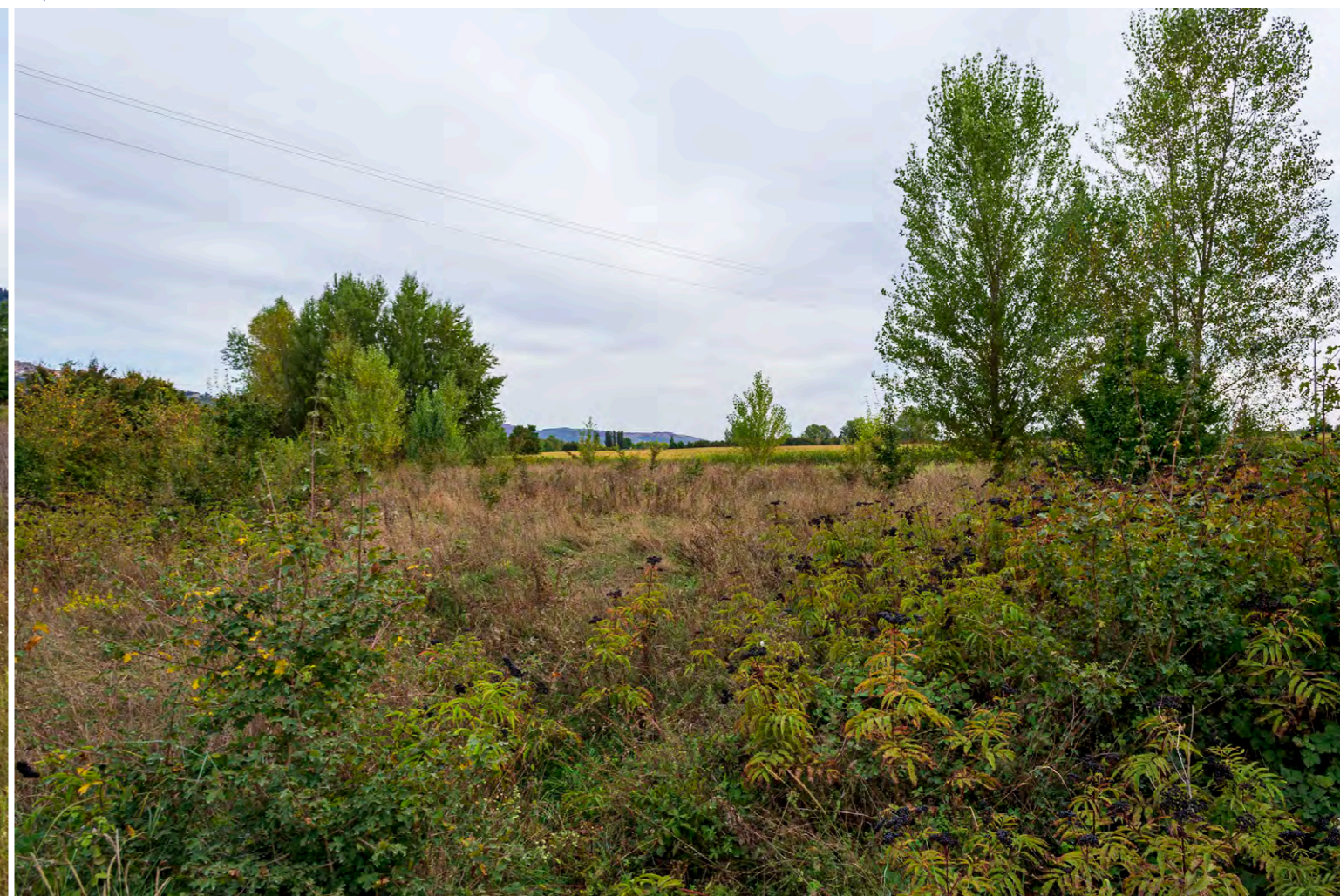
note Vista dell'area di intervento dalla località C. Rio Vecchio.