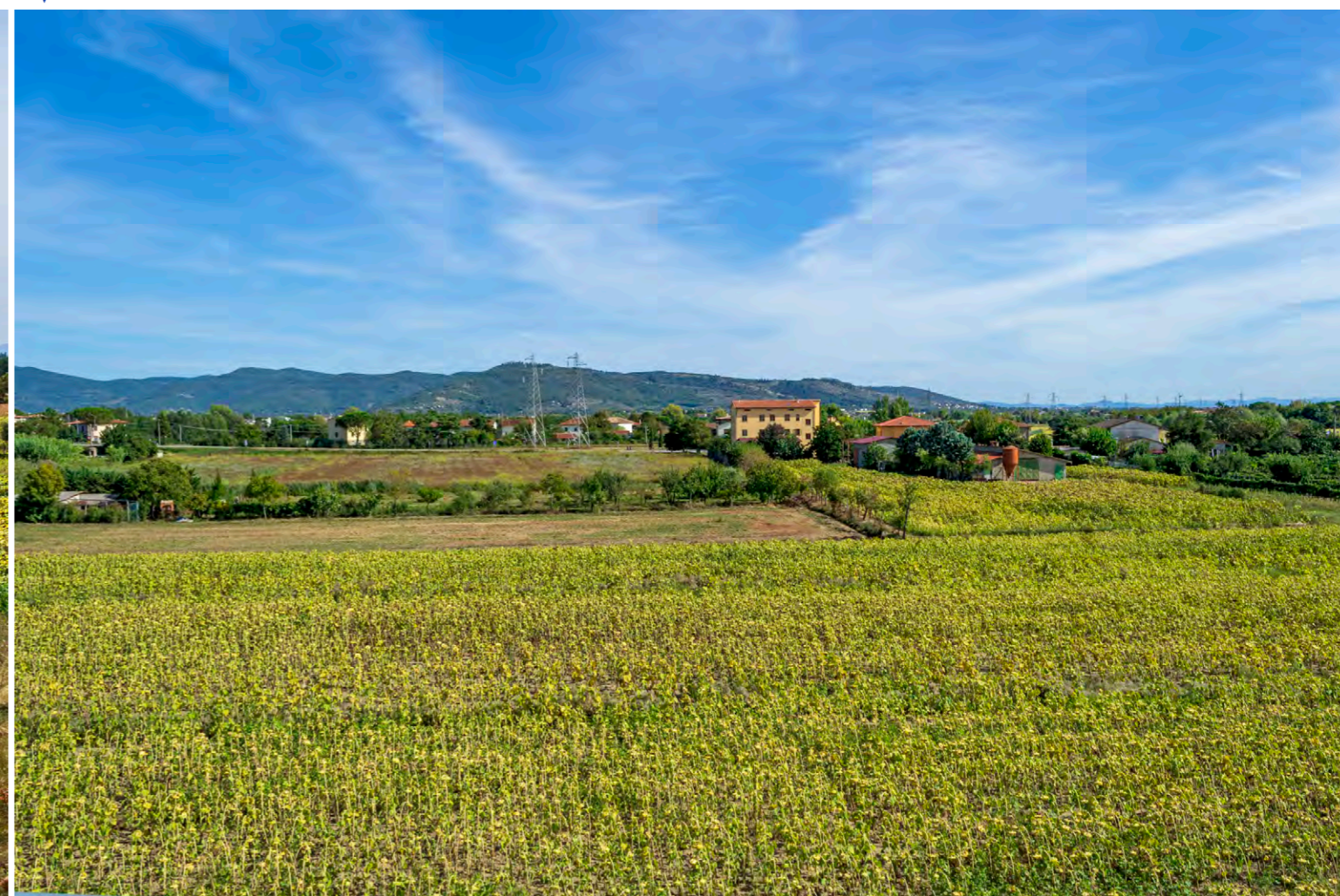
note Vista dell'area di intervento in località Chiassaie, il tracciato attraversa i campi mantendendosi distante dai luoghi abitati.