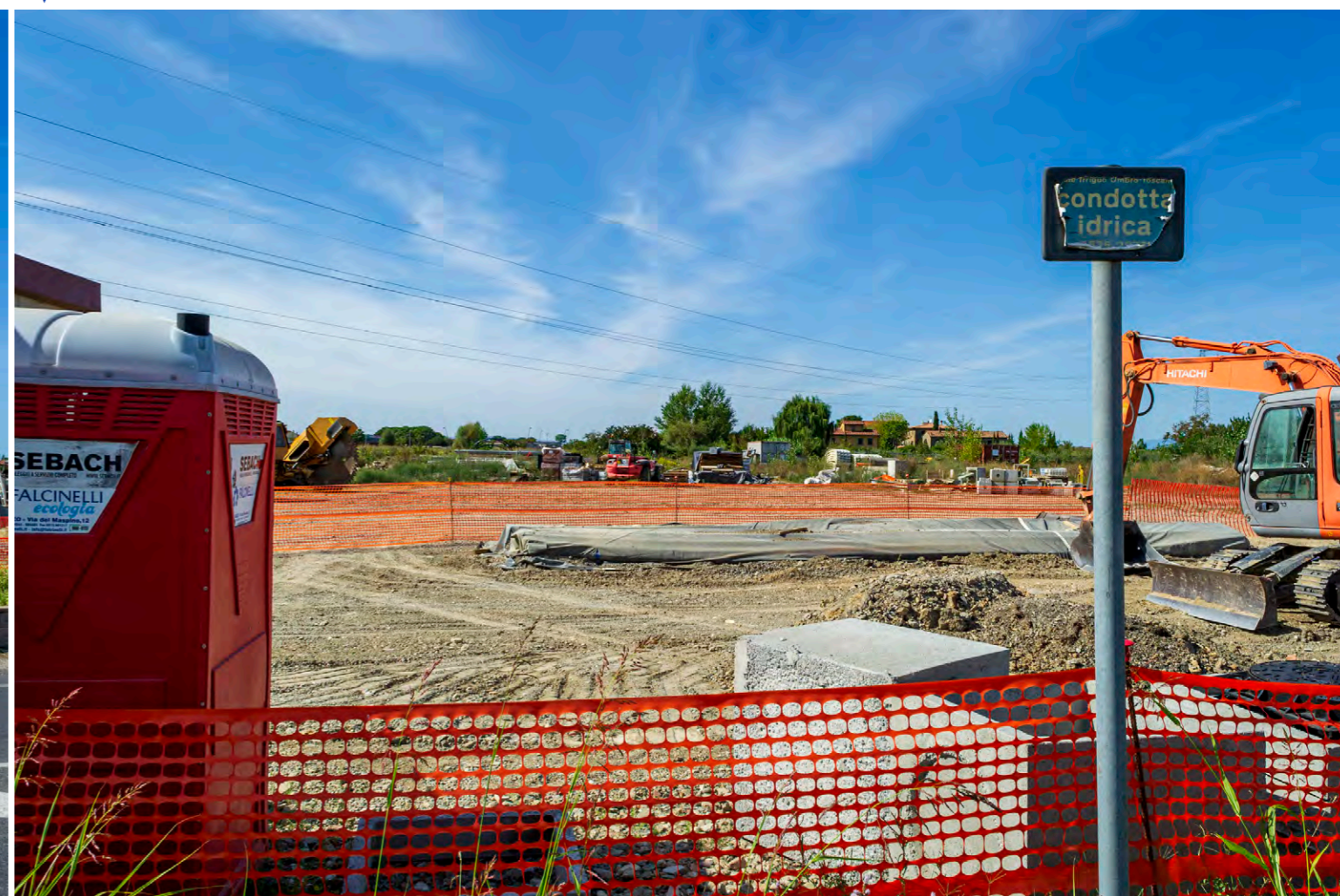
note Vista dell'area di intervento nel punto di attraversamento della Strada Provinciale Lauretana.