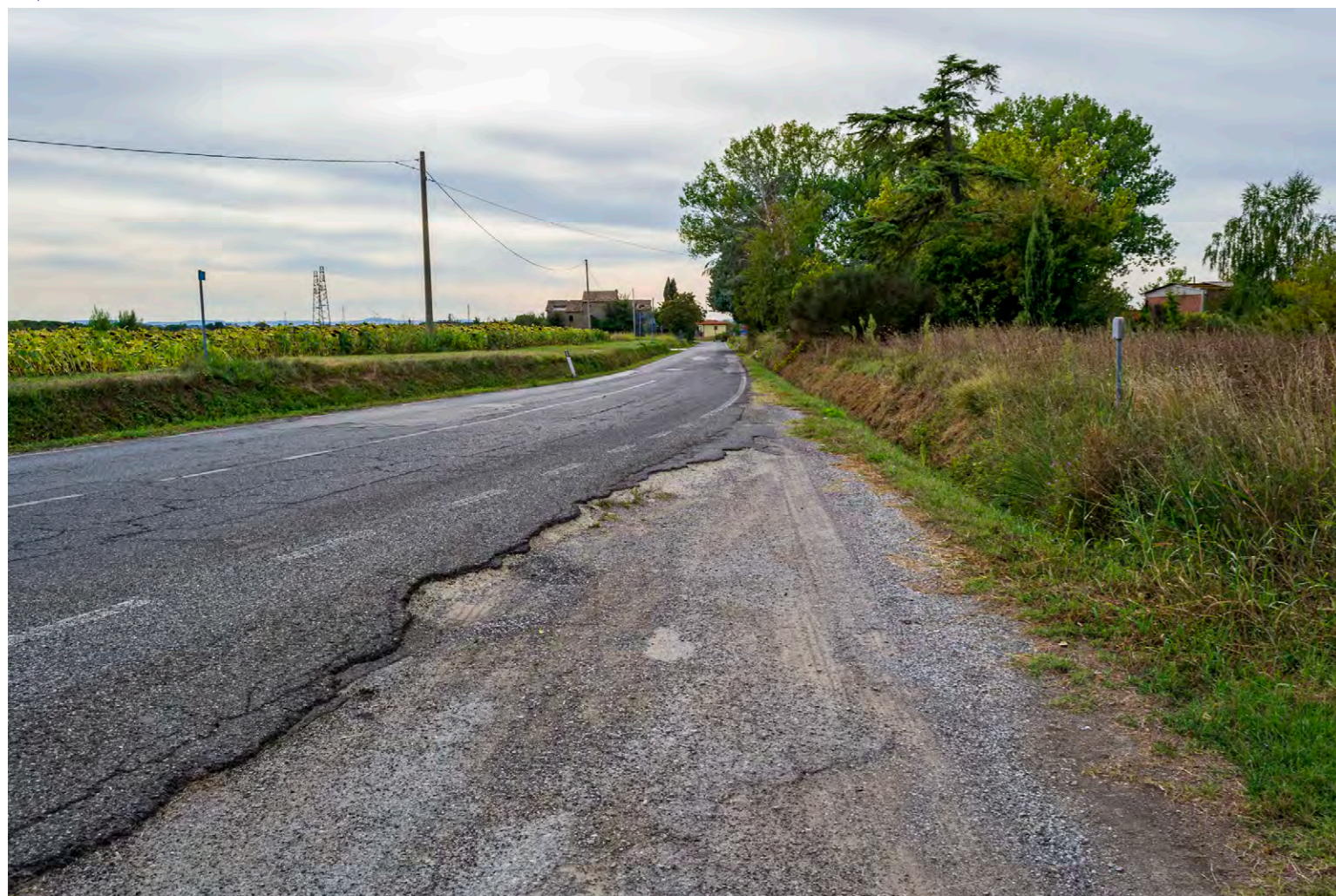
note Vista dell'area di intervento in località Sant'Eusebio, punto di attraversamento della Strada Provinciale 28 Siena-Cortona.