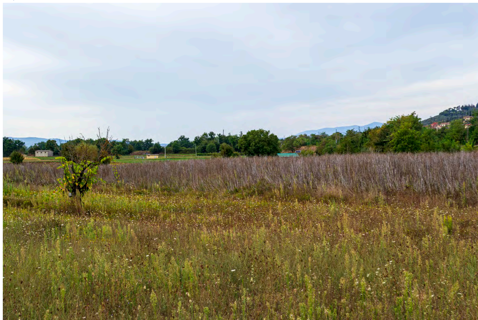
note Vista dell'area di intervento dalla località C. Rio Vecchio, sullo sfondo il nodo 26.