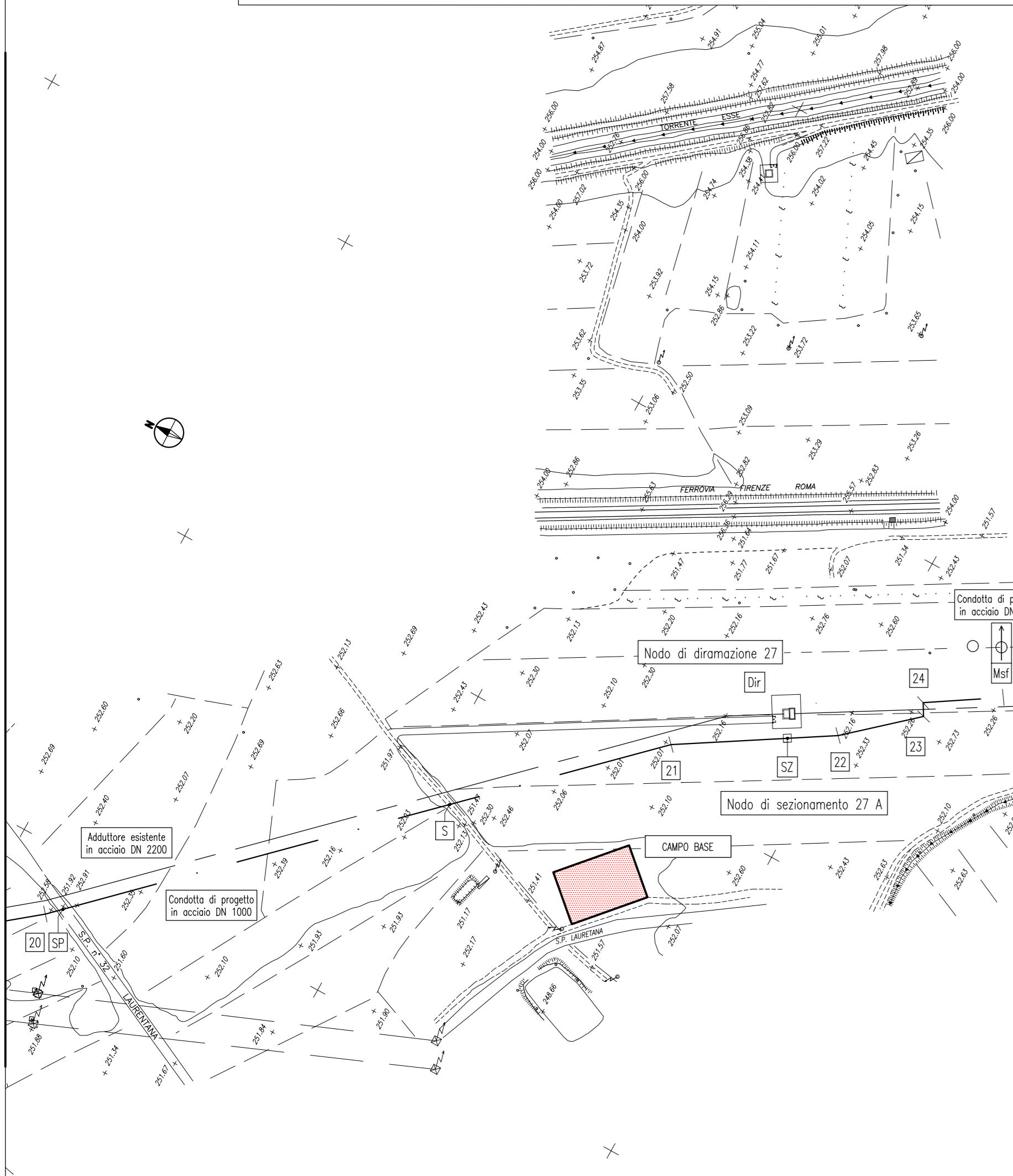
INQUADRAMENTO PLANIMETRICO - scala 1:2.500